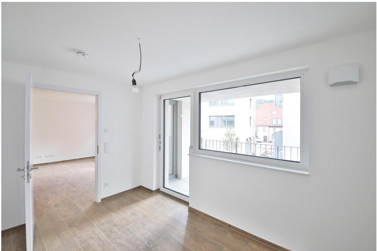
Schlafzimmer mit Balkon