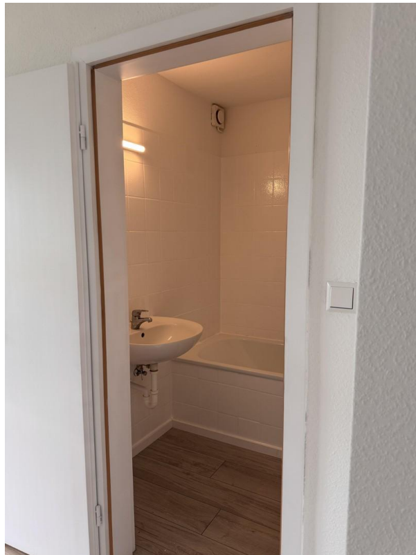
Bad mit Duschwanne