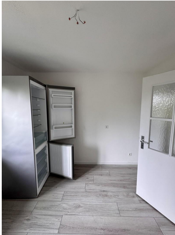
Küche mit Kühlschrank