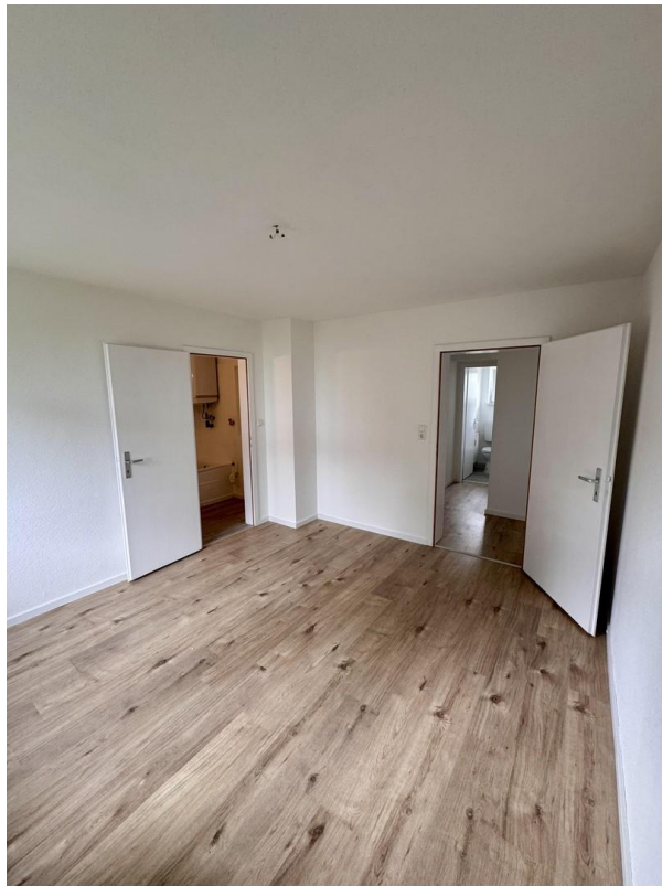
Zimmer 1 mit Zugang zum Bad