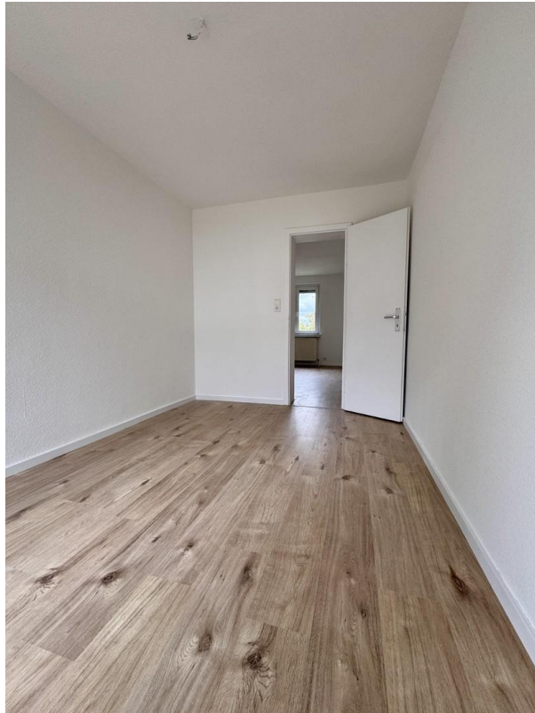
Zimmer 3 mit Zugang zum Balkon