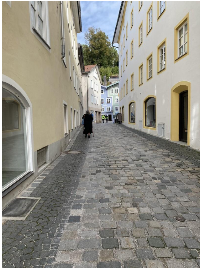
Außenansicht Richtung Marktstr