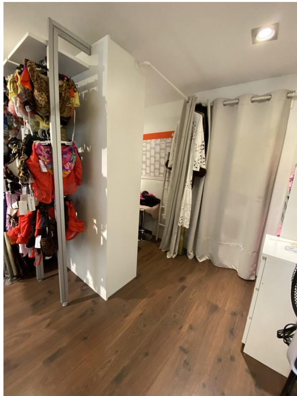
Büro und Kochnische/WC