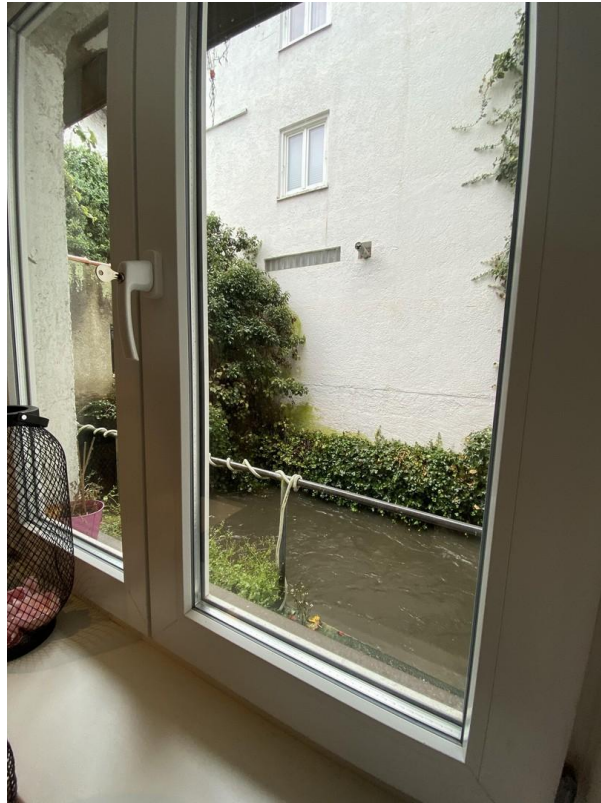
Fenster zum Ellbach