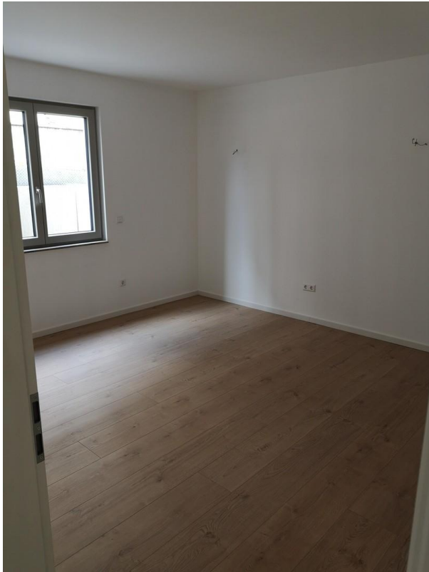
Kind / Büro