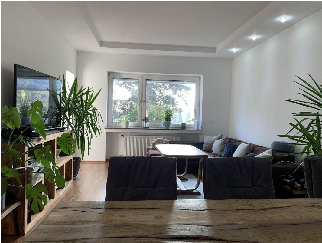
Wohnzimmer - Fenster