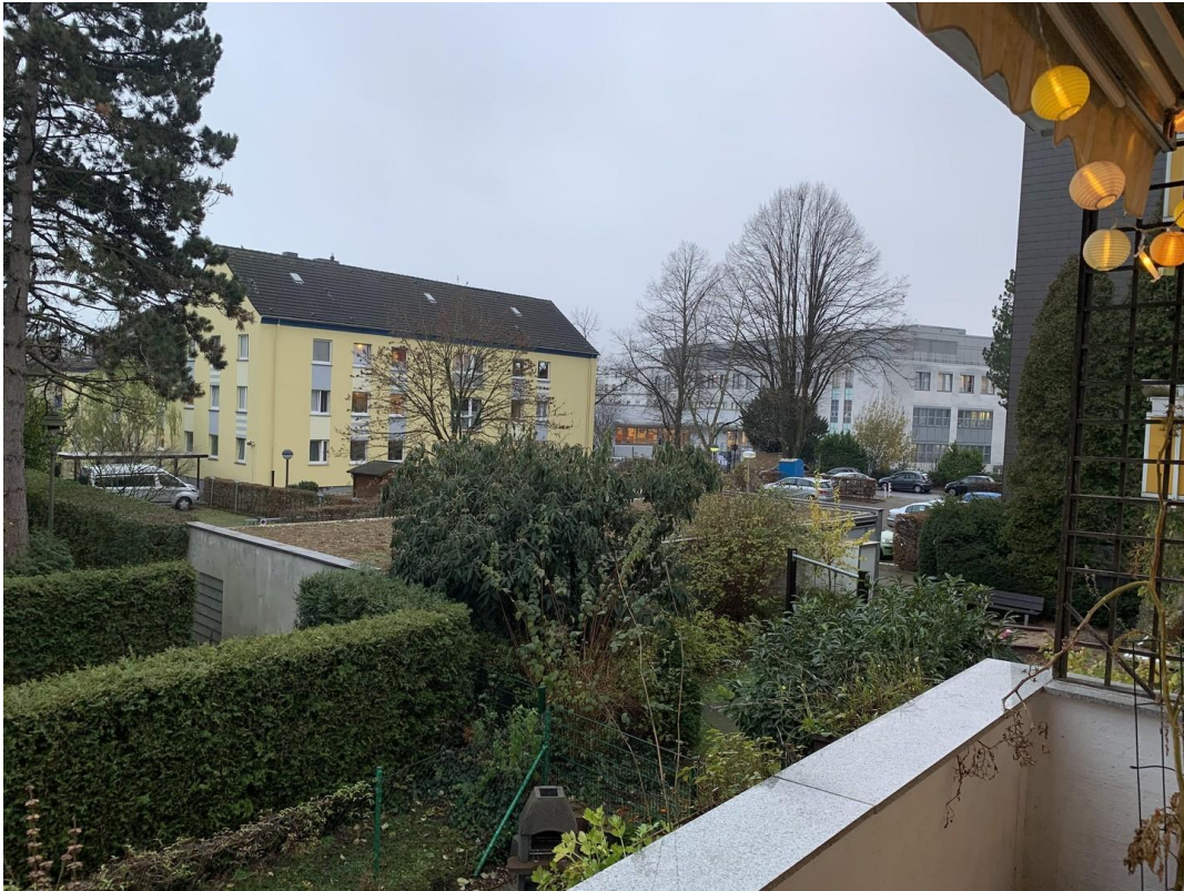
Balkon - Ausblick