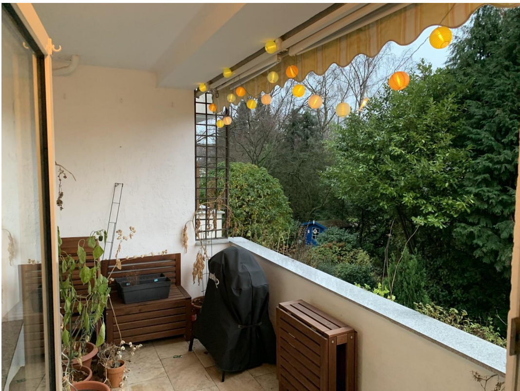
Balkon - Möbel