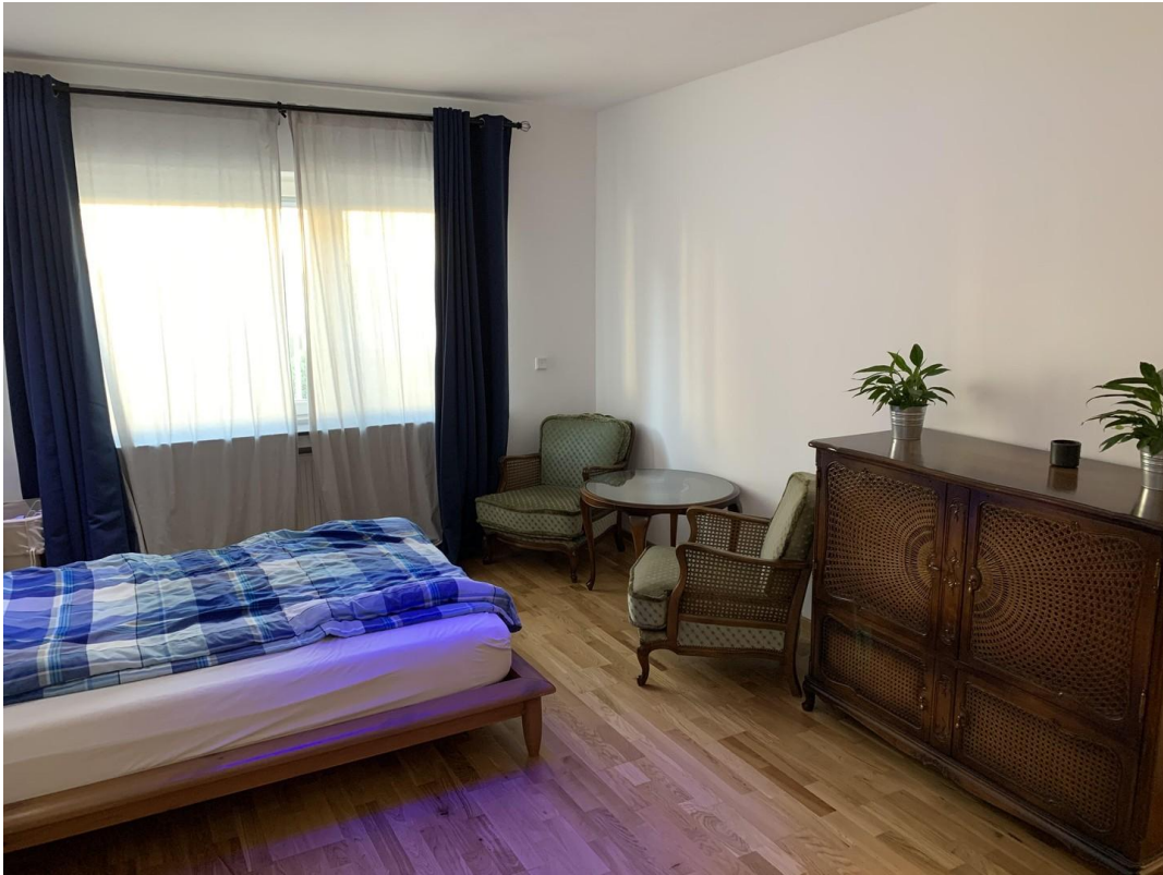
Schlafzimmer - frühere Möbel