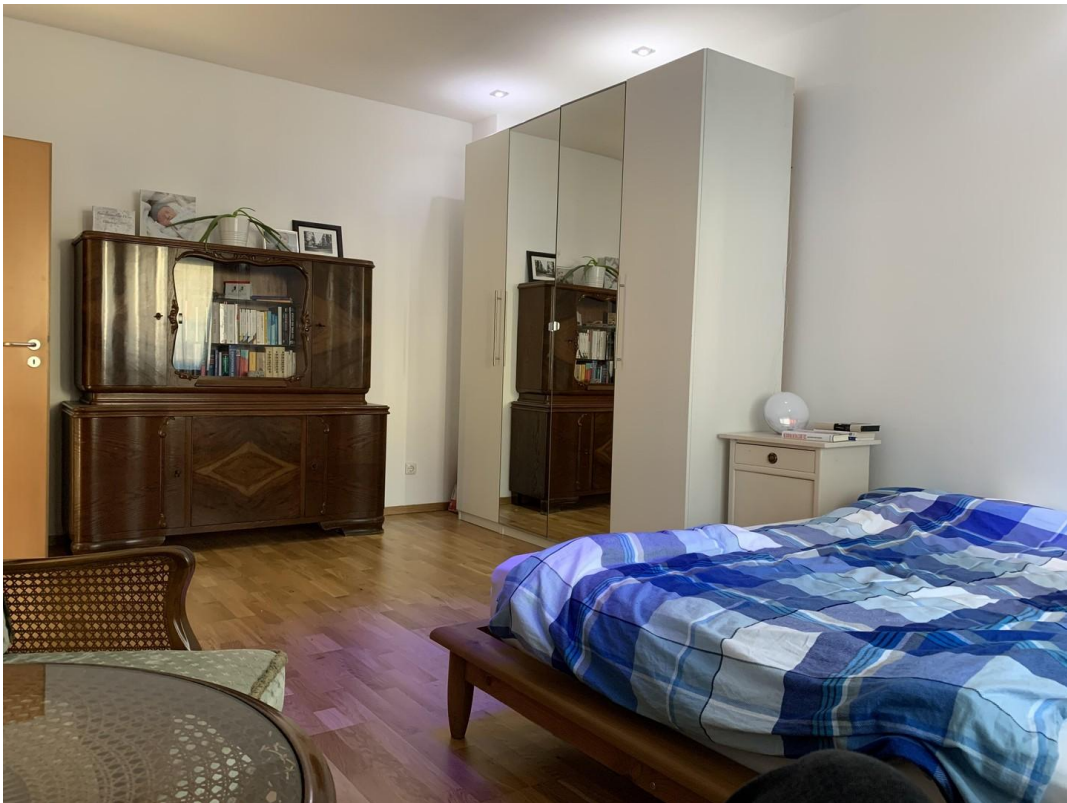
Schlafzimmer - frühere Möbel