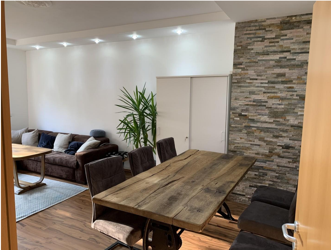
Wohnzimmer - Esstisch