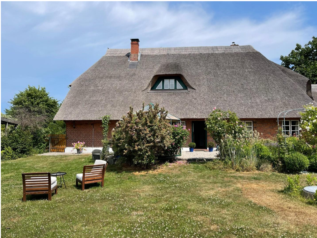
Garten und Haus