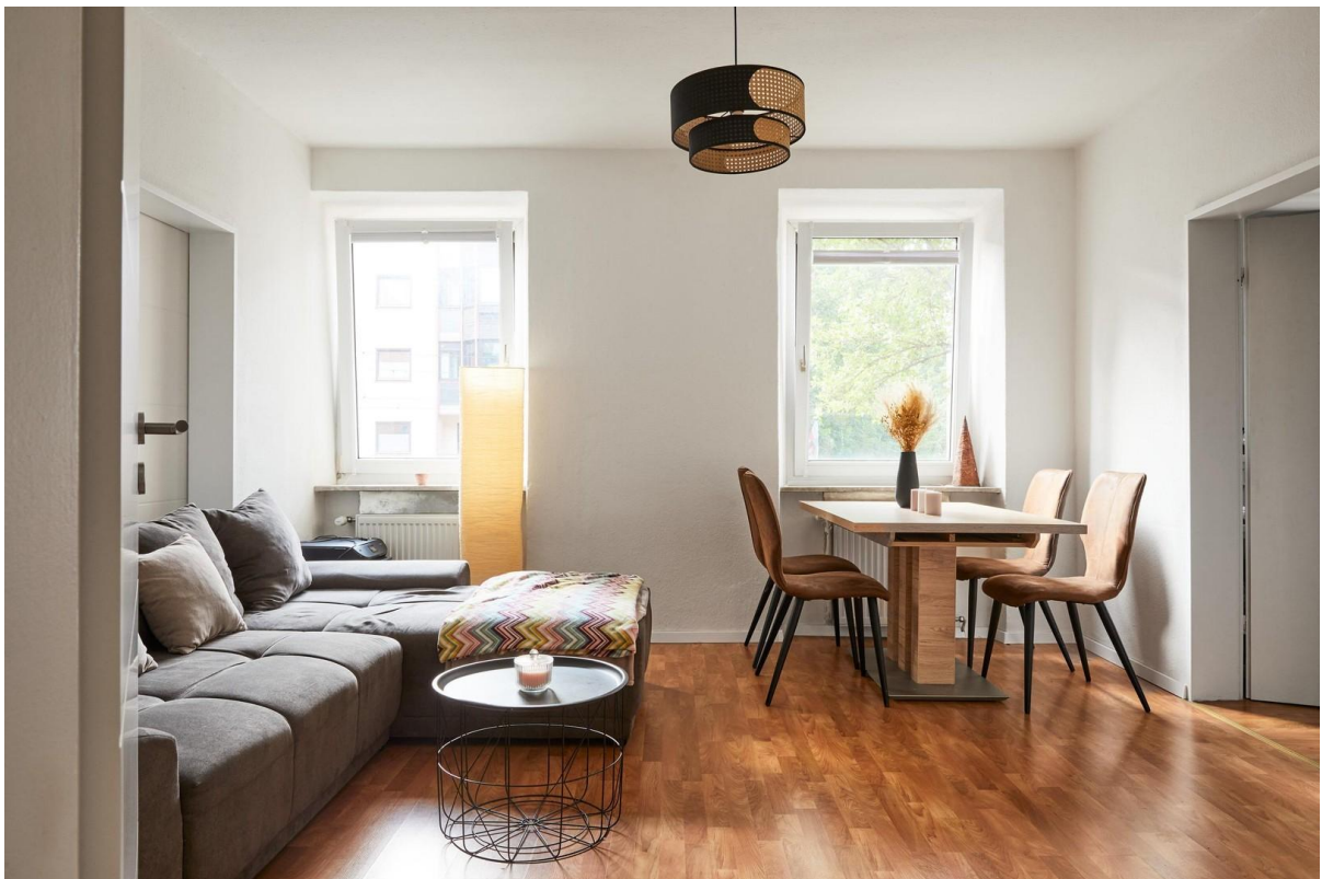
Wohnzimmer - Bild 3