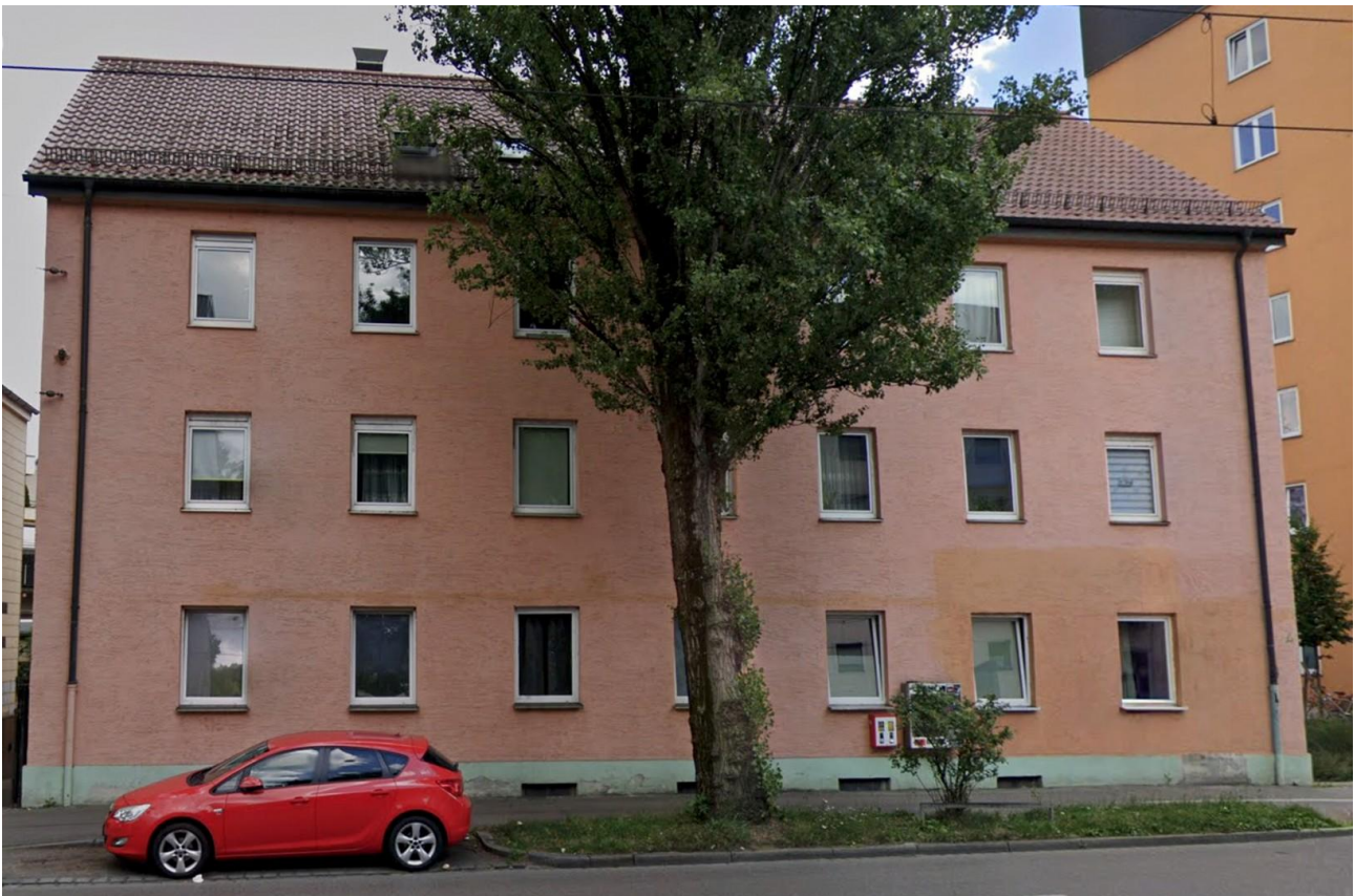
Fassade - Bild 1