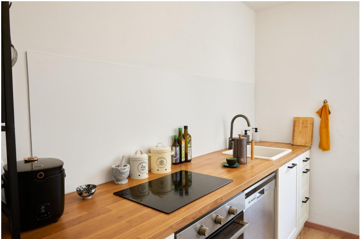
Küche - Bild 2