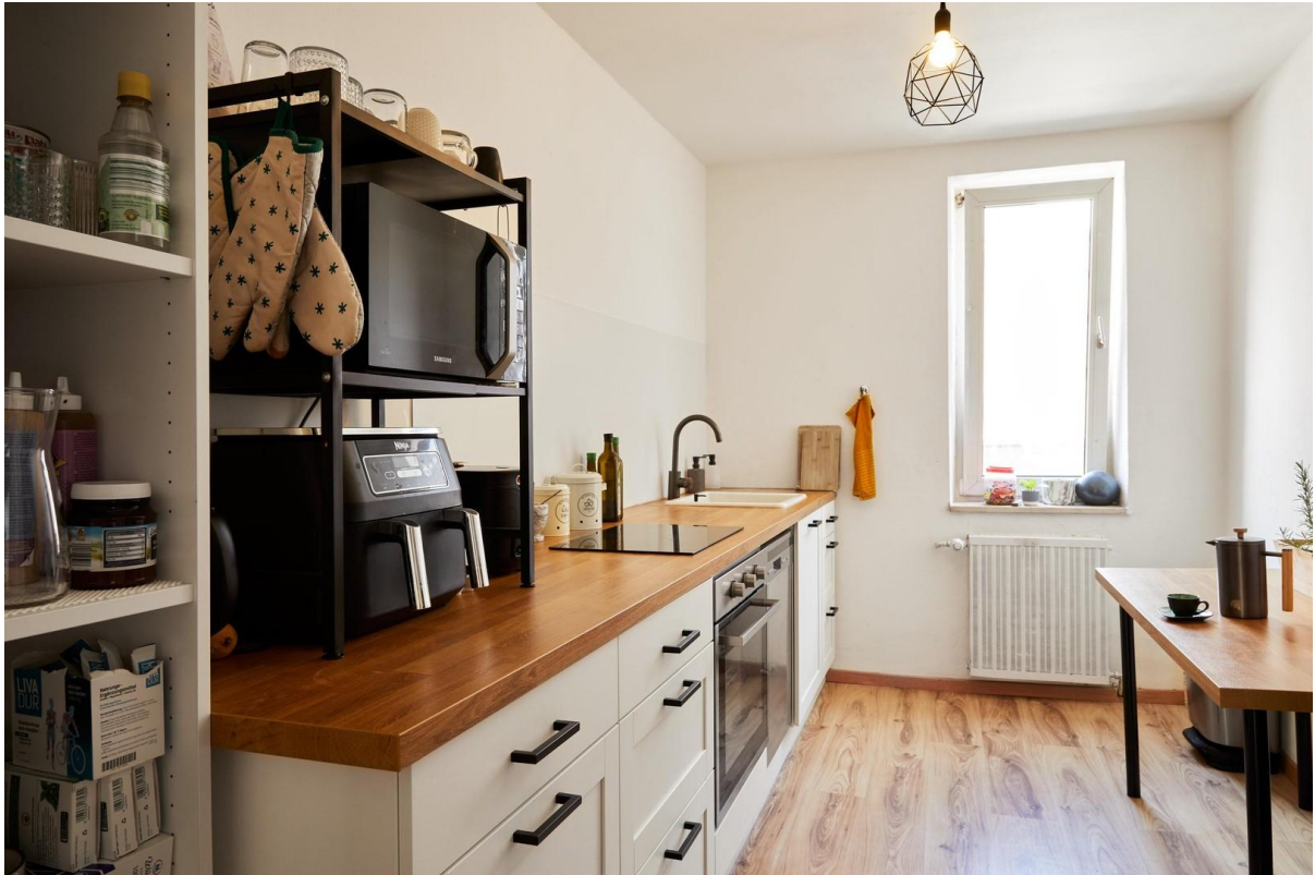
Küche - Bild 1