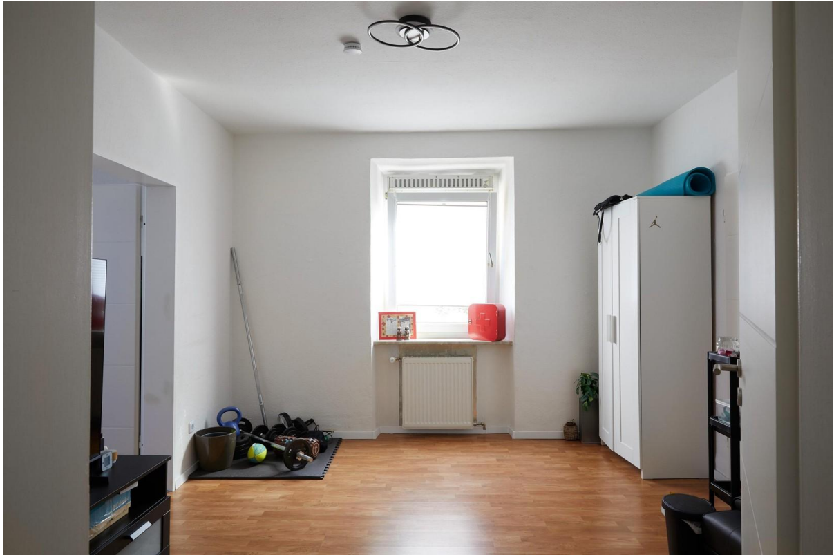
Esszimmer / Büro