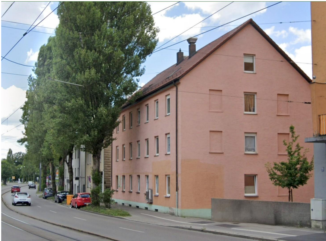
Fassade - Bild 2