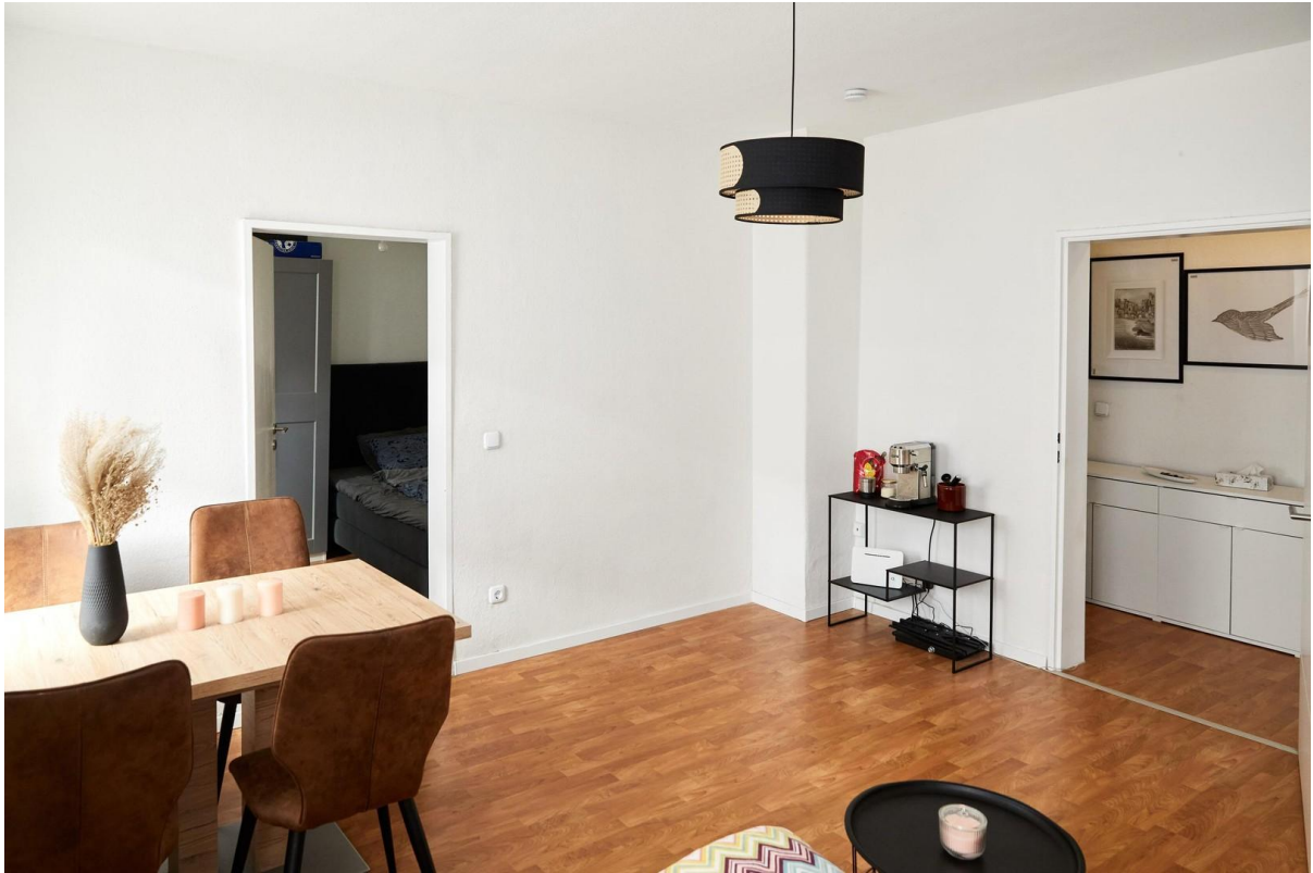
Wohnzimmer - Bild 2