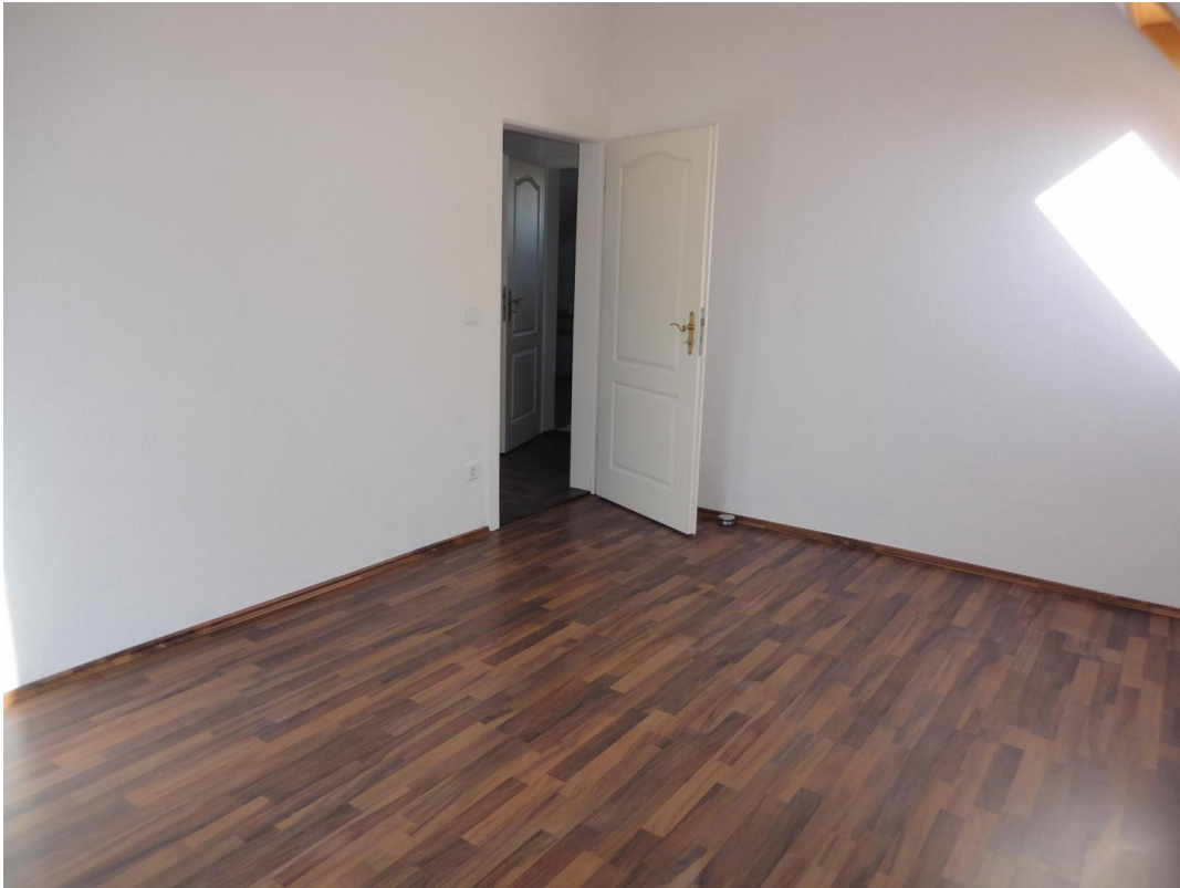
OG - Zimmer 2