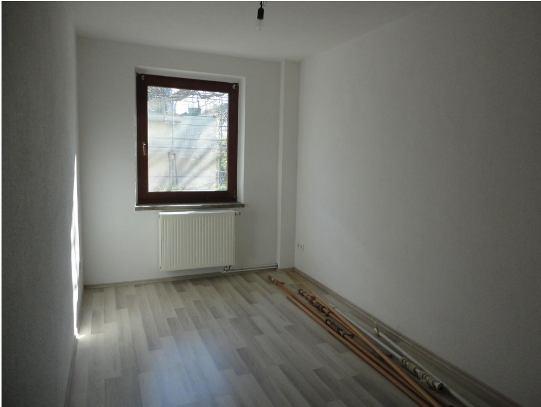
EG - Gäste-/Arbeitszimmer