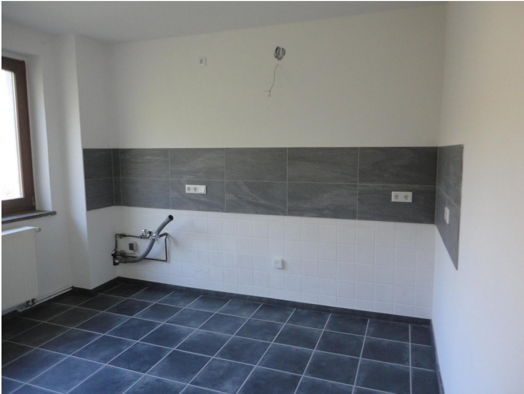
EG - Küche