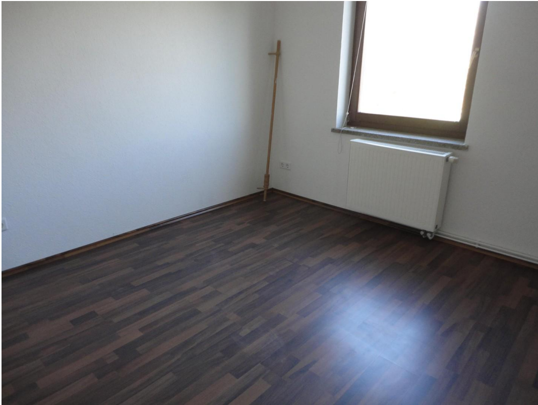
OG - Zimmer 1