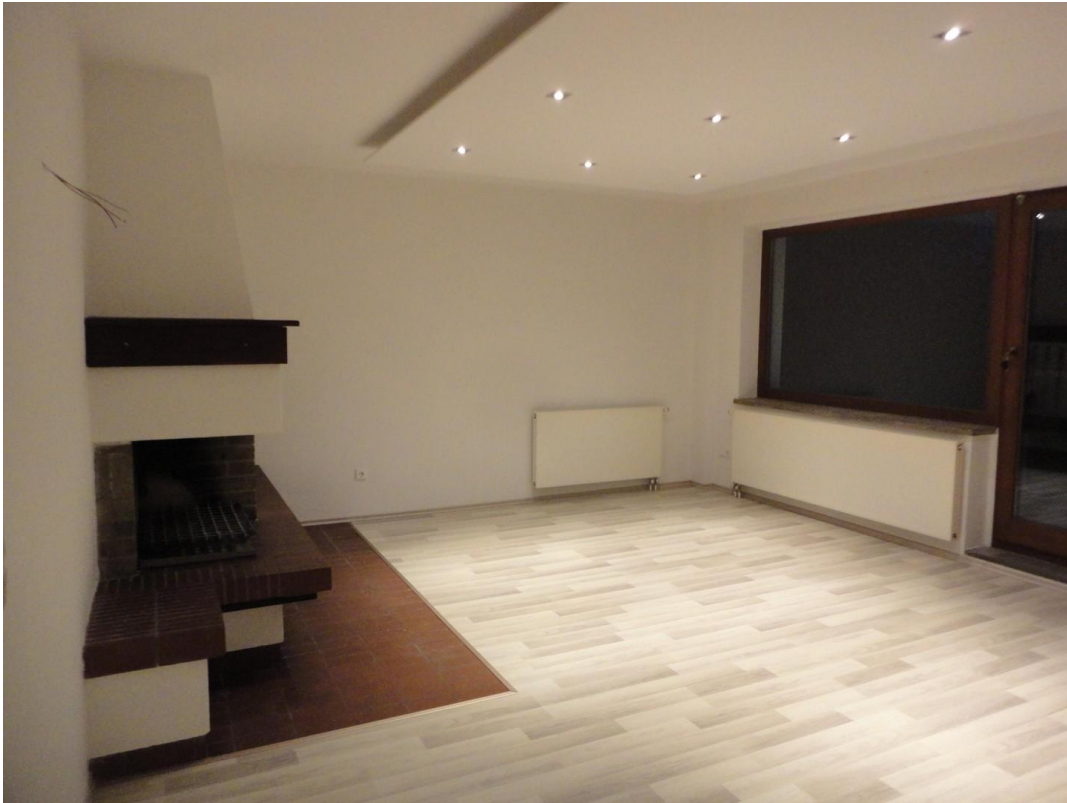
EG - WZ mit Zugang Terrasse