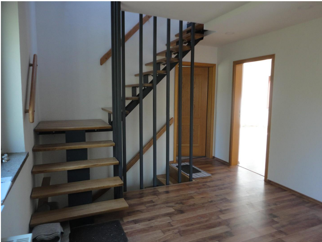
EG - Eingangsbereich