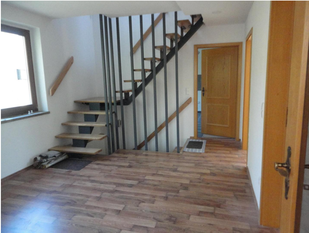
EG - Eingangsbereich