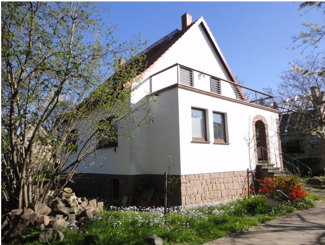
Ansicht Haus mit Privatweg