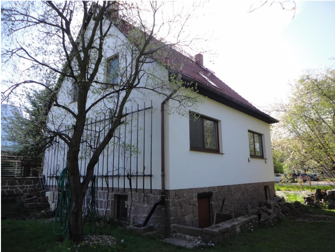
Ansicht Haus vom Garten