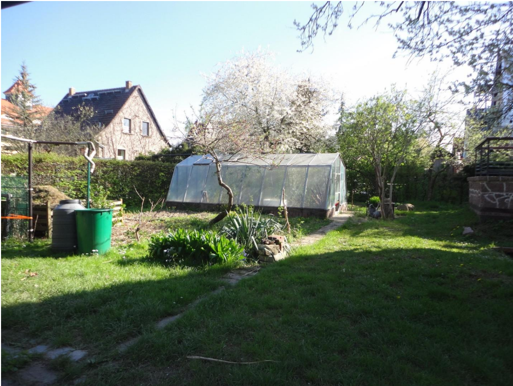
Garten mit Gewächshaus