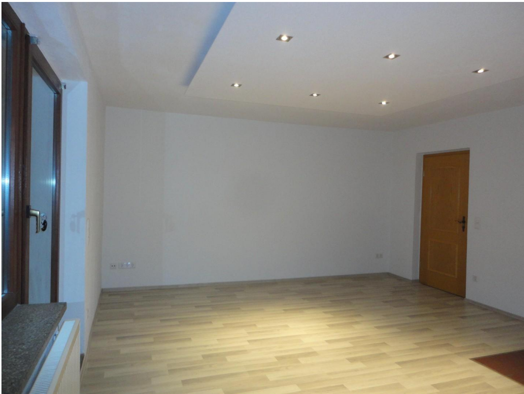
EG - WZ