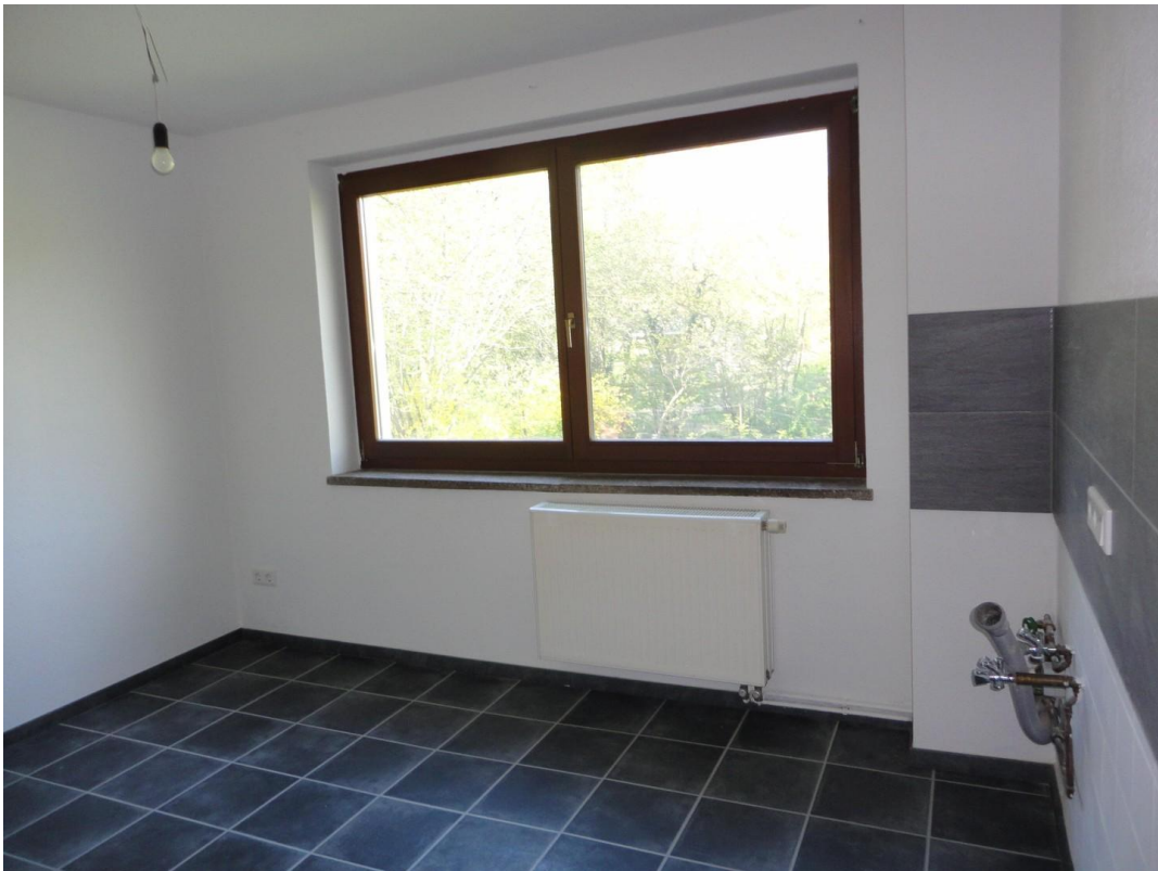
EG - Küche