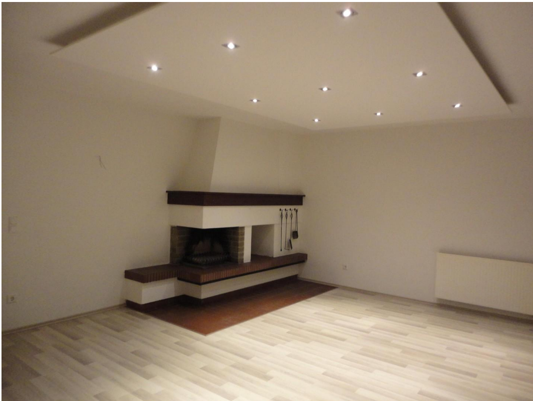
EG - Wohnzimmer mit Kamin