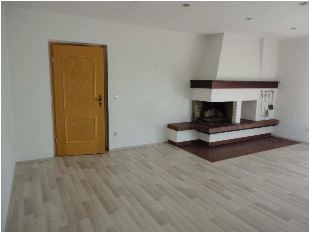
EG - WZ mit Kamin