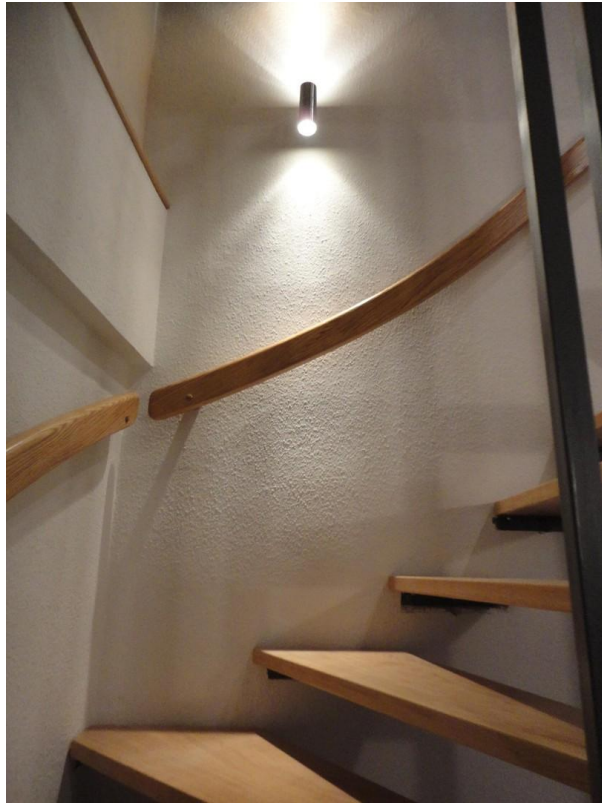
Keller - Treppe ins EG