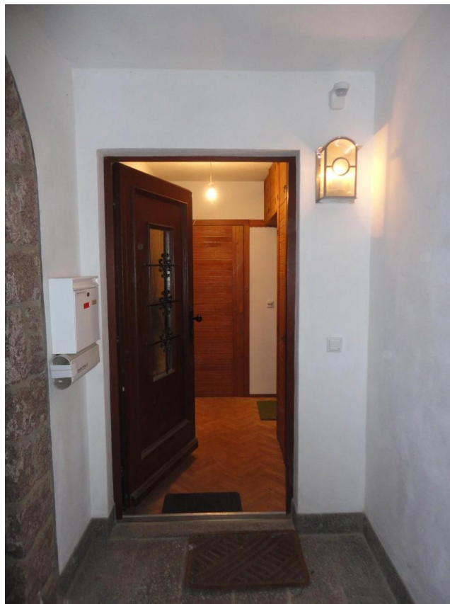
EG - Eingang mit Windfang