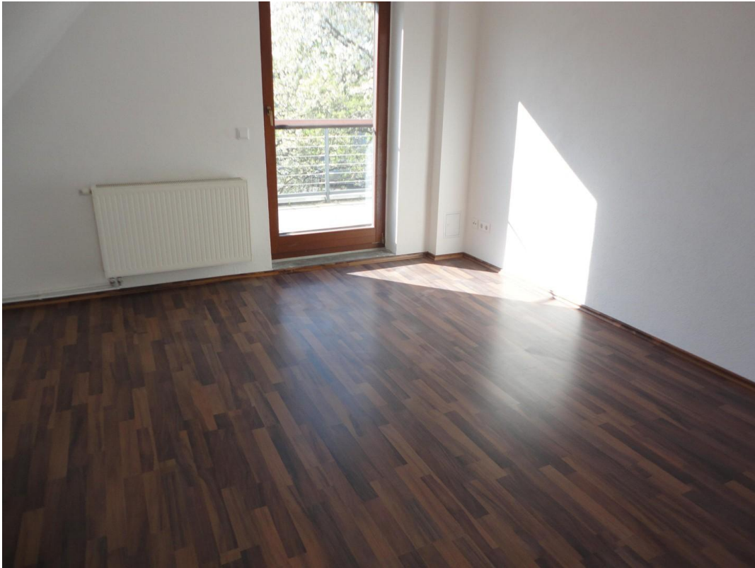
OG - Zimmer 2, mit Balkon