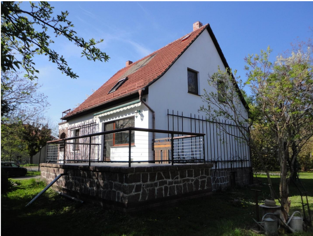
Ansicht Haus zur Terrasse