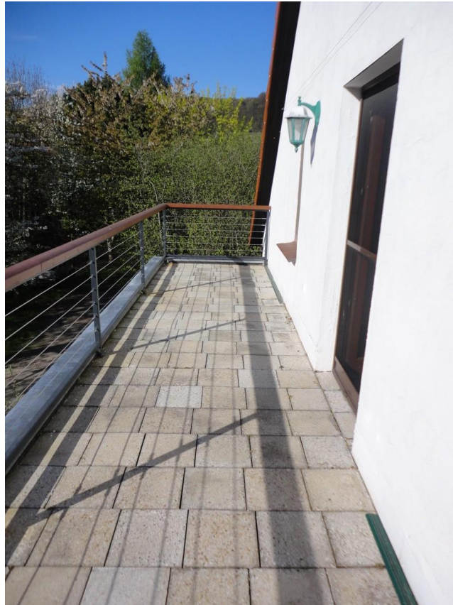
OG - Balkon von Zimmer 2