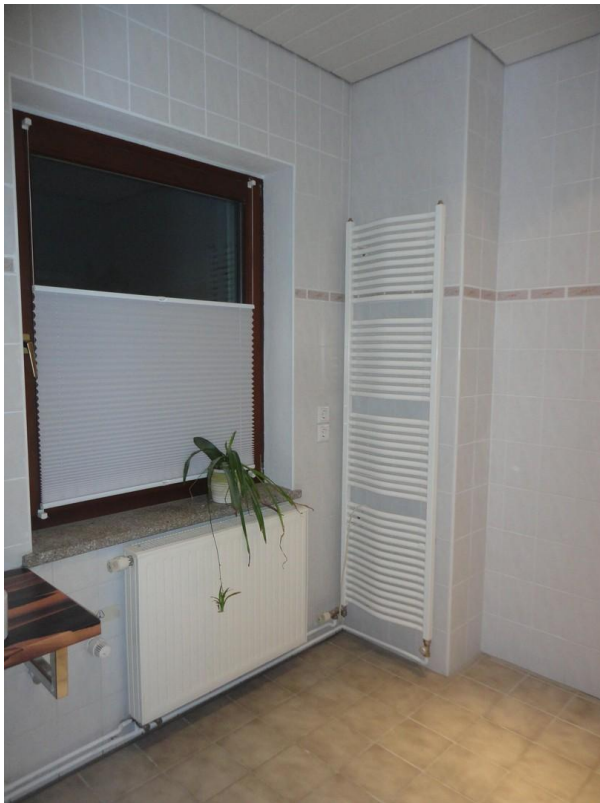
OG - Bad