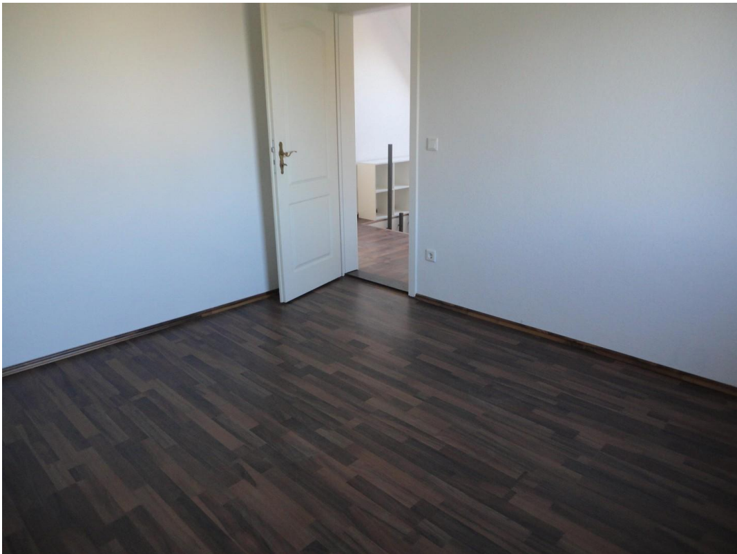
OG - Zimmer 1