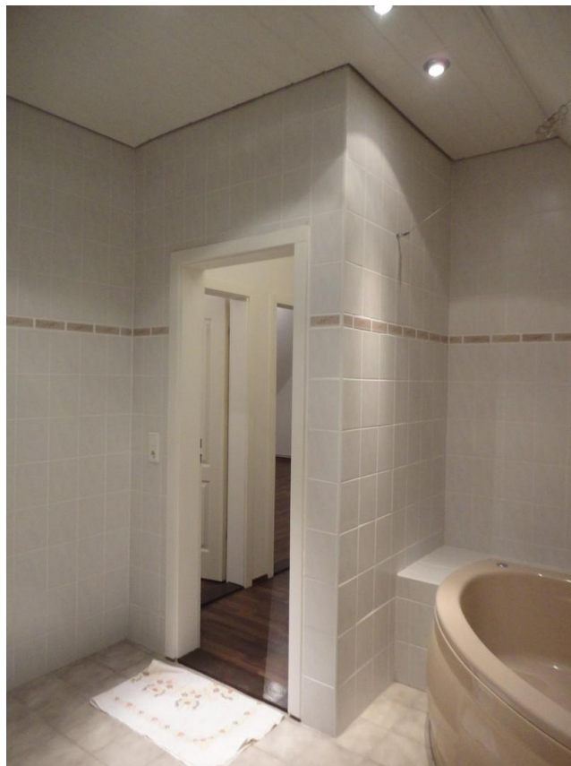
OG - Bad