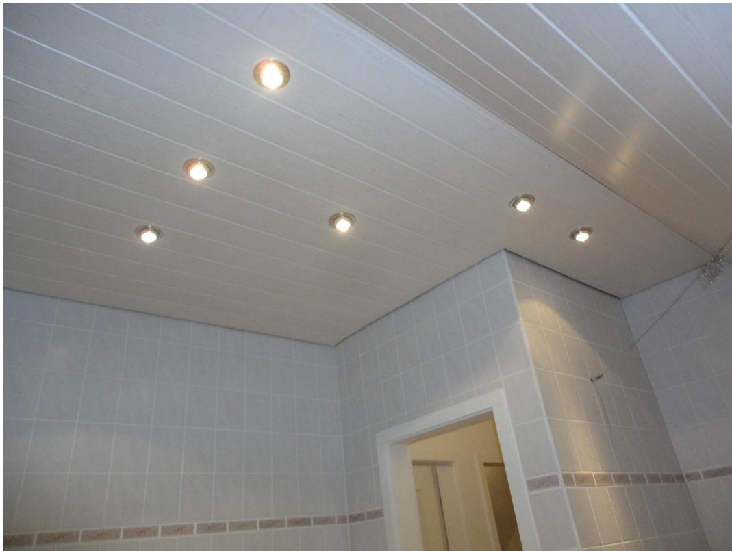
OG - Bad