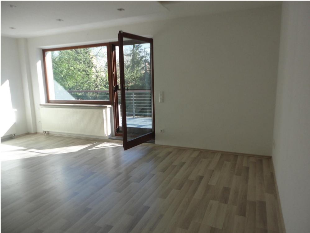
EG - WZ, Tür zur Terrasse