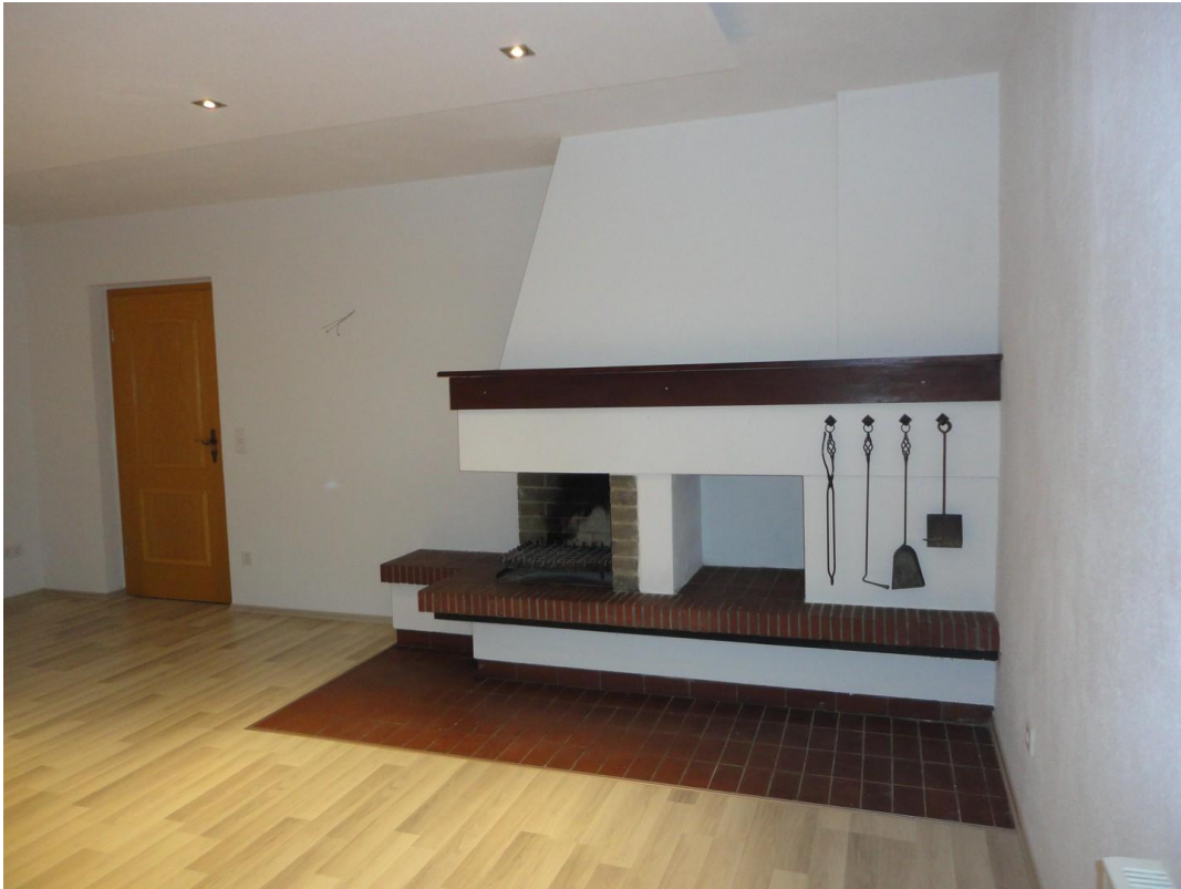
EG - Kamin im WZ