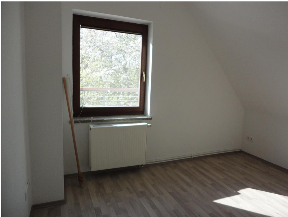
OG - Zimmer 3