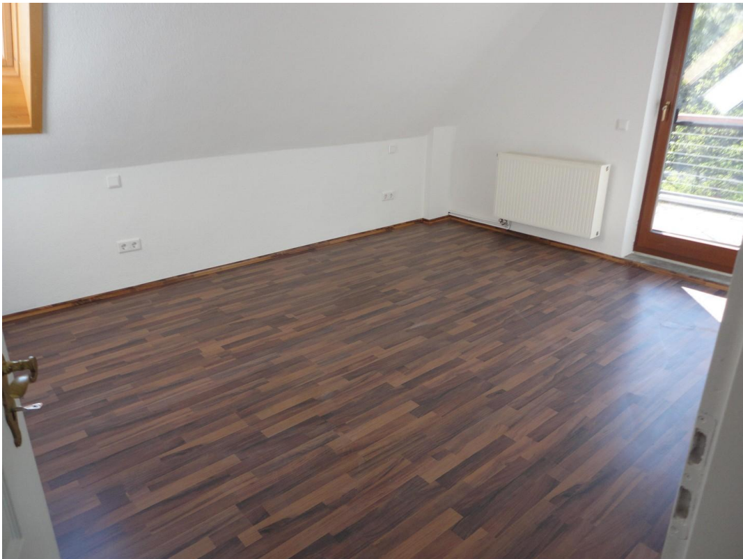
OG - Zimmer 2, mit Balkon