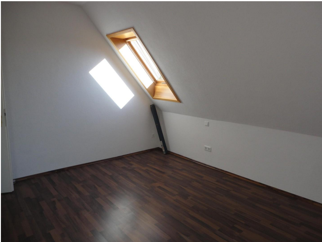
OG - Zimmer 2