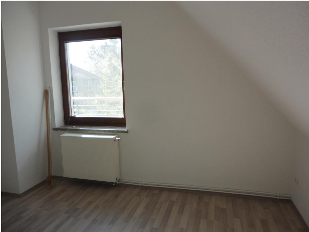
OG - Zimmer 3