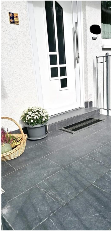
neu gefliester Eingangsbereich