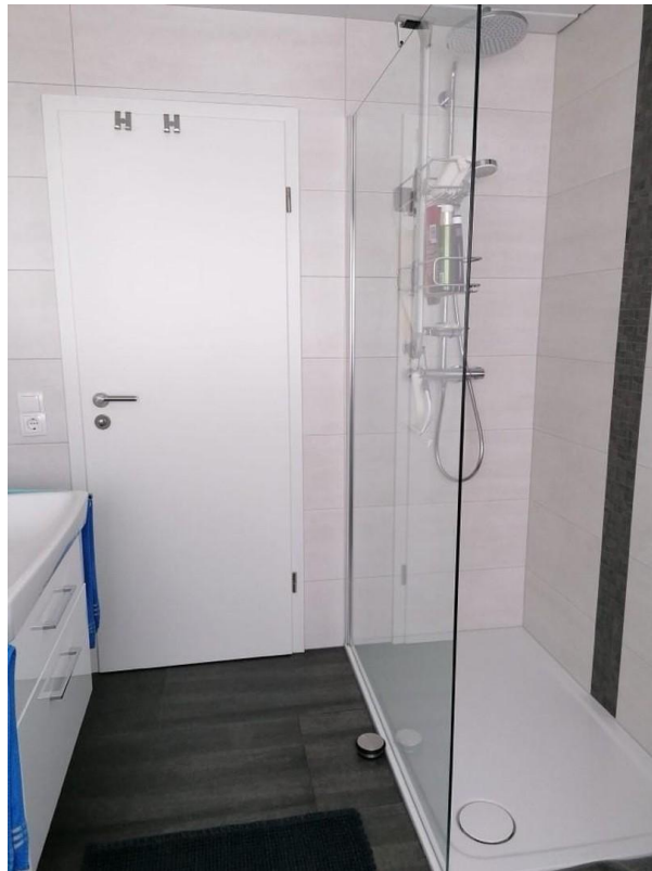
Bad neu saniert