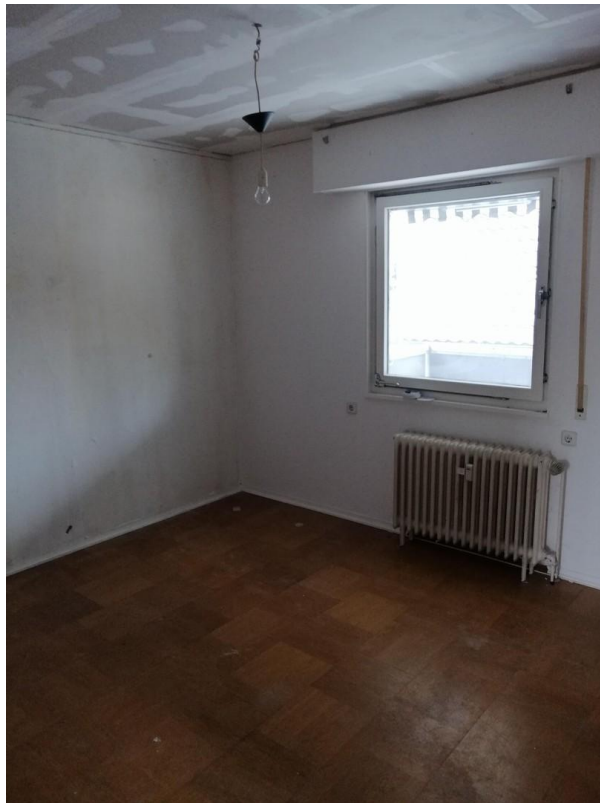
Schlafen / Renovierung