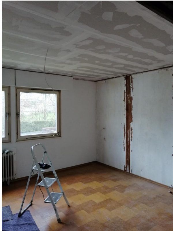
Schlafen / Renovierung