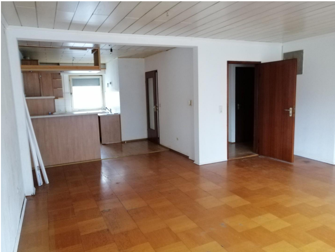
Wohnen / offene Küche