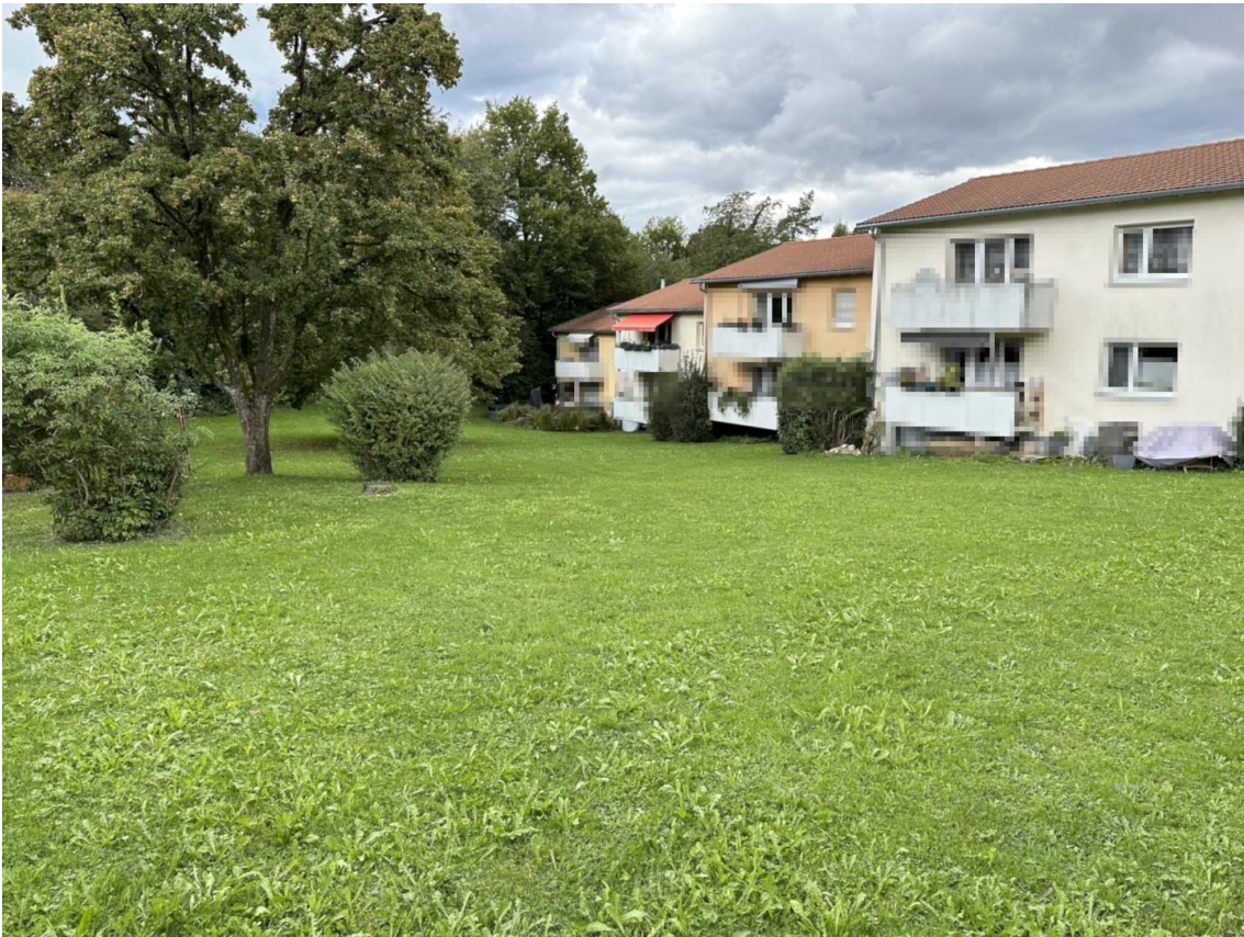
Außenansicht Süd Balkon