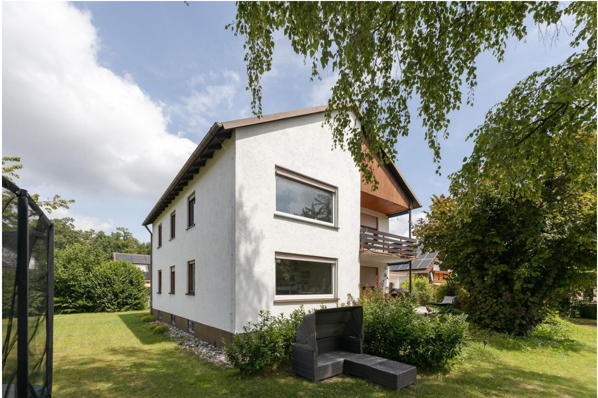
Haus Vorderseite mit Garten