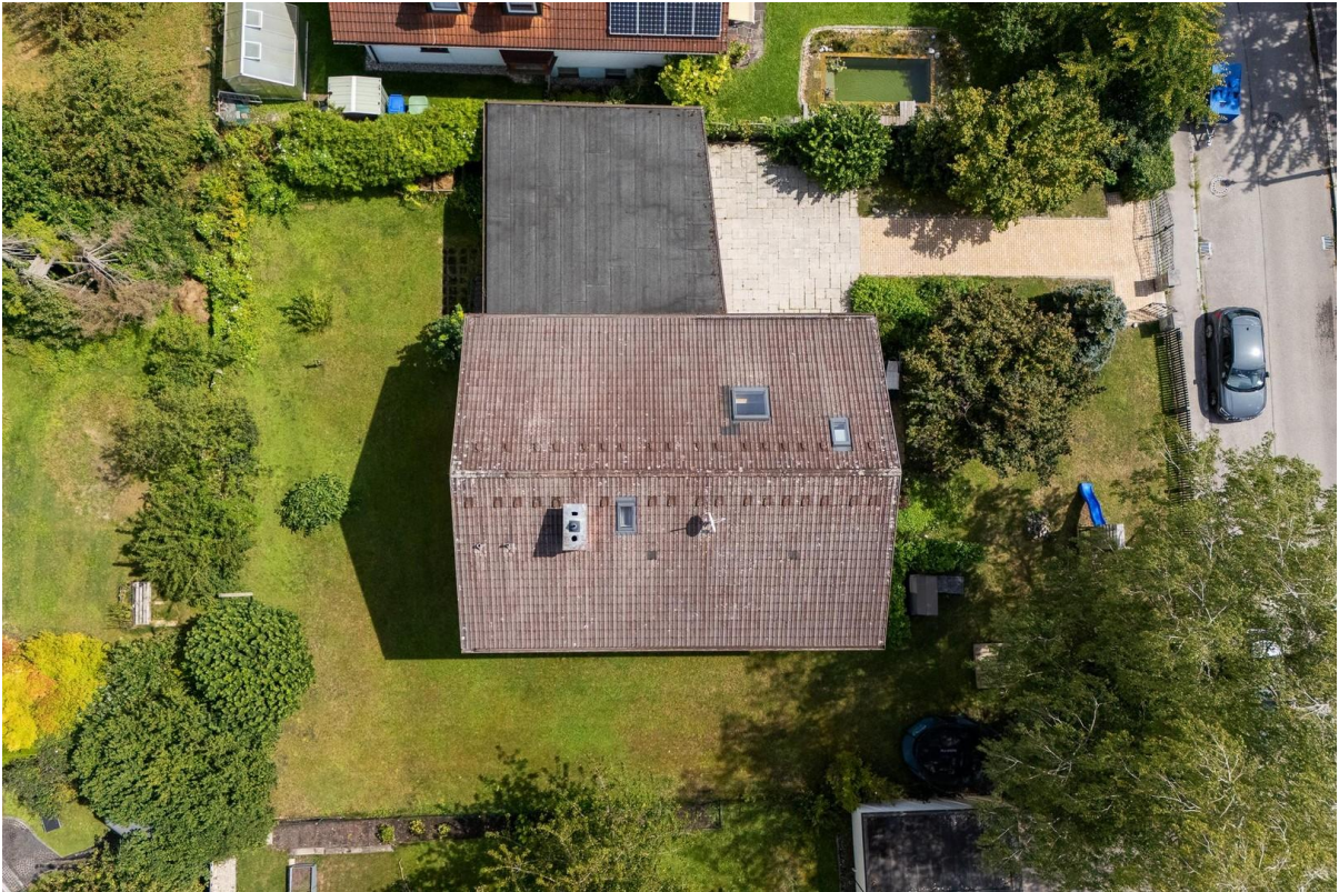
Vogelperspektive Haus + Garten