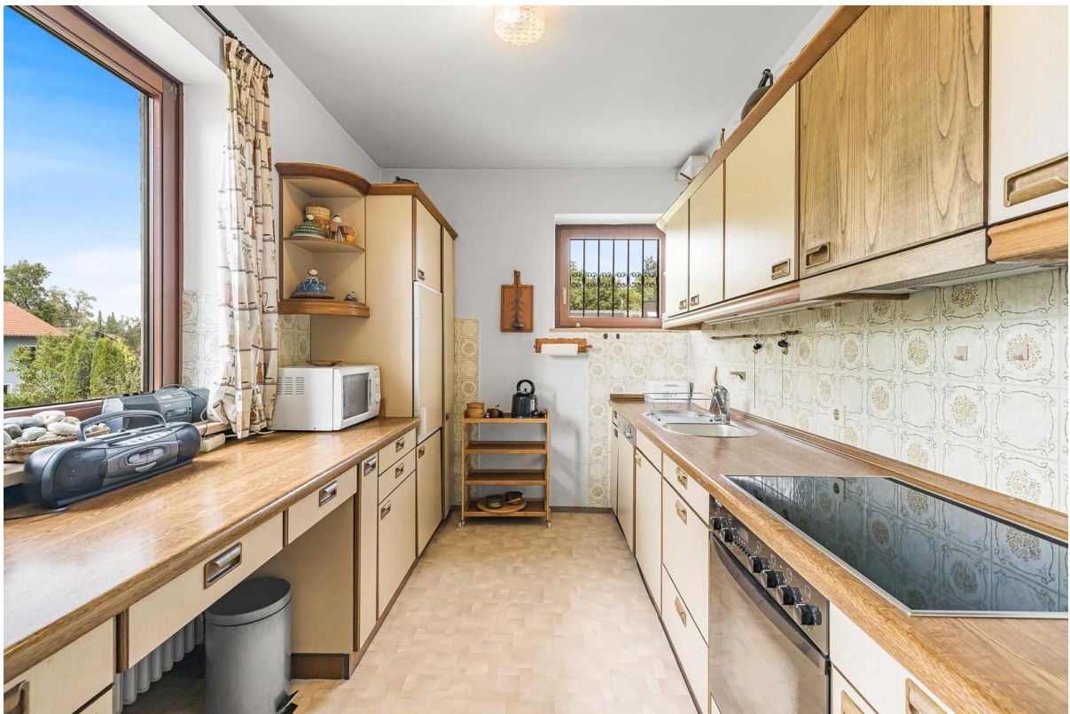
1. OG: Küche