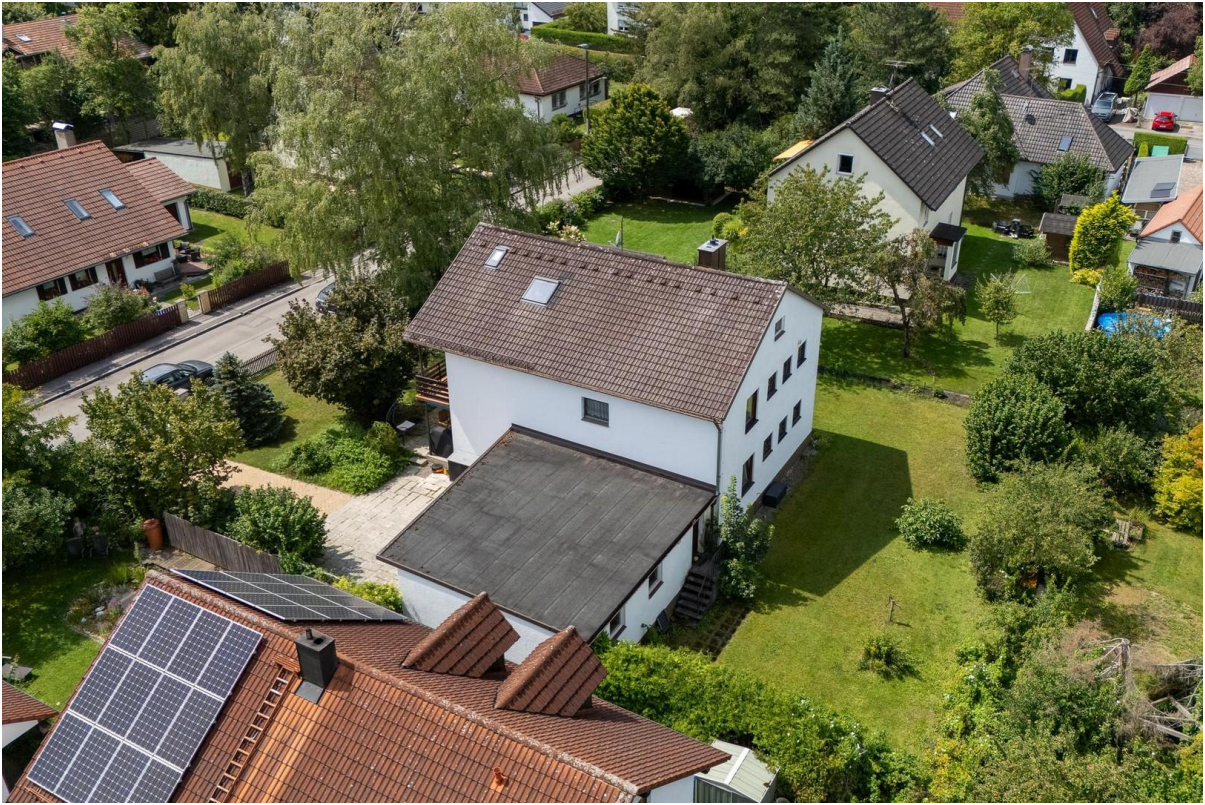
Vogelperspektive Haus + Garten