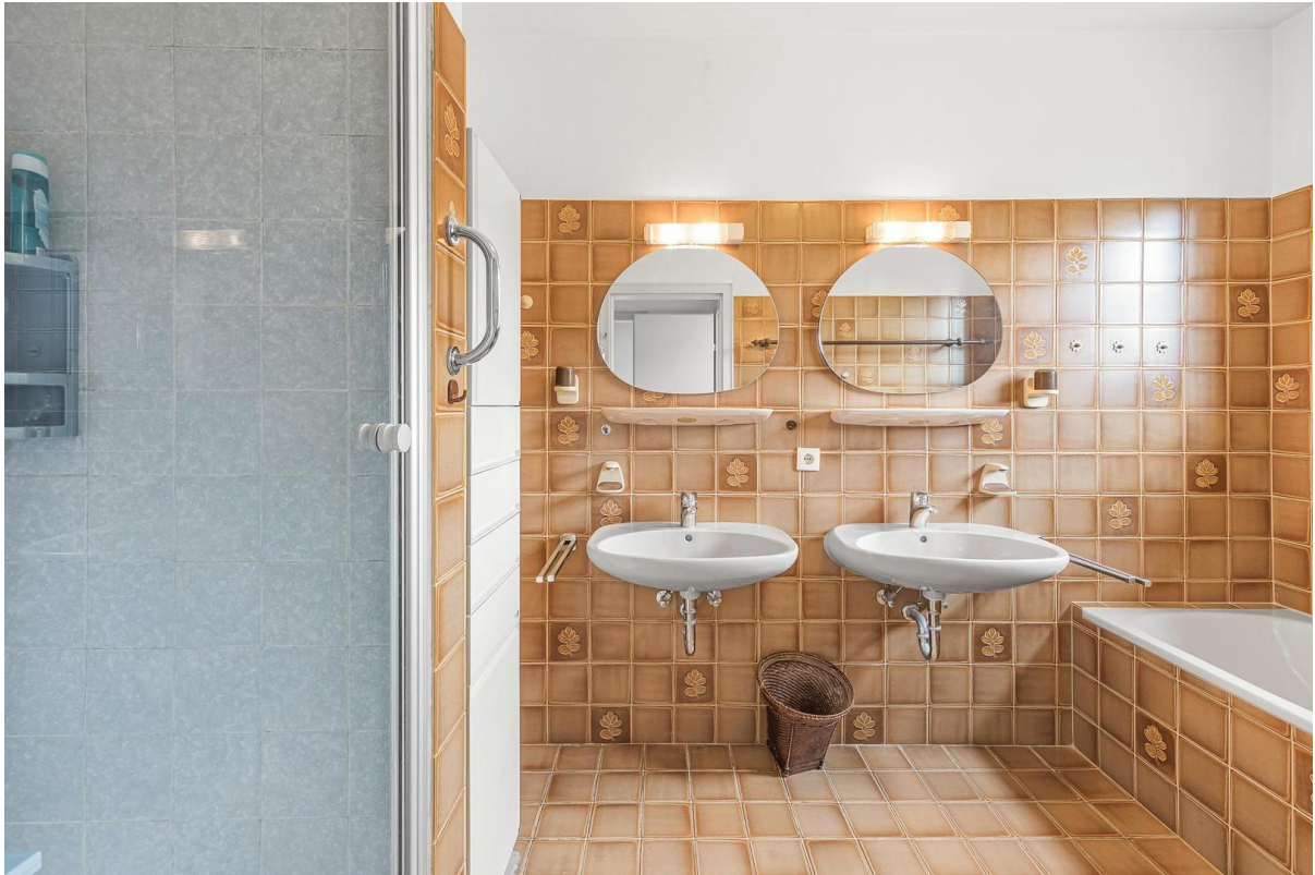
1. OG: Badezimmer