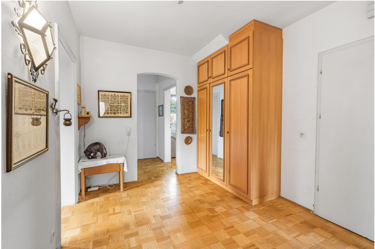
1. OG: Flur