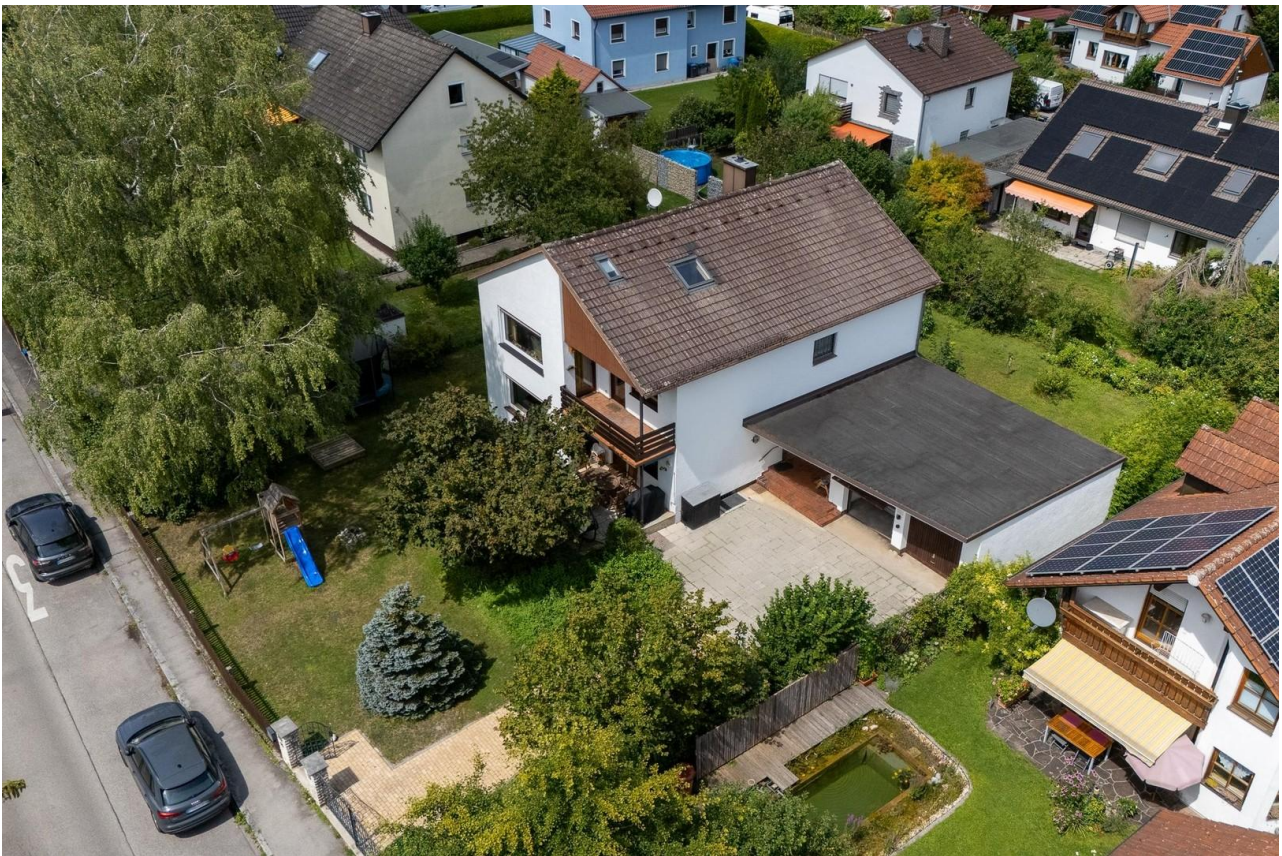
Haus + Garten + Garage