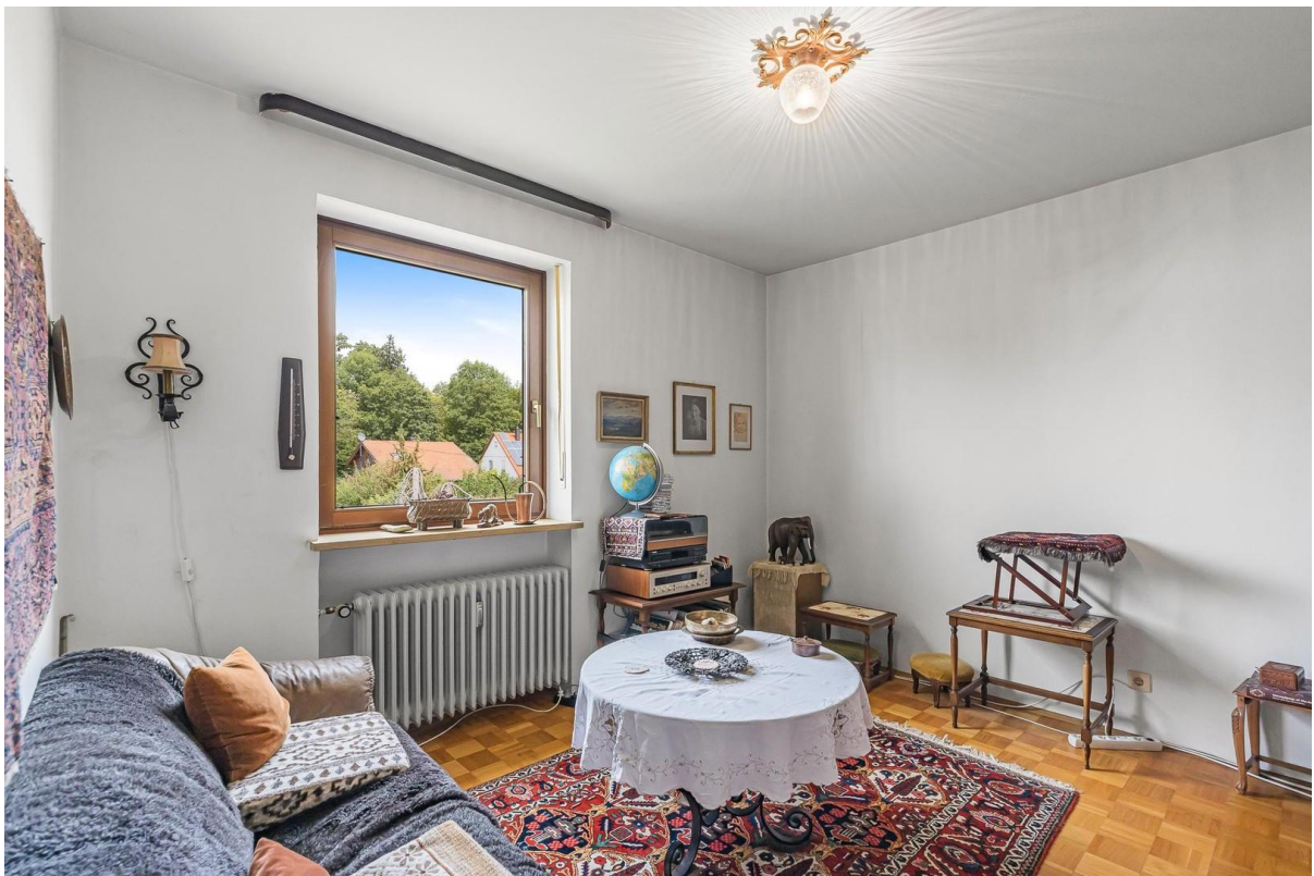
1. OG: Gästezimmer