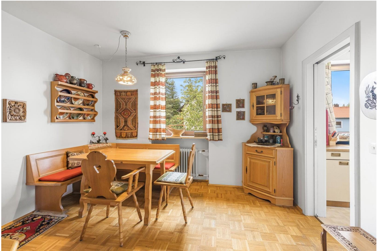
1. OG: Esszimmer