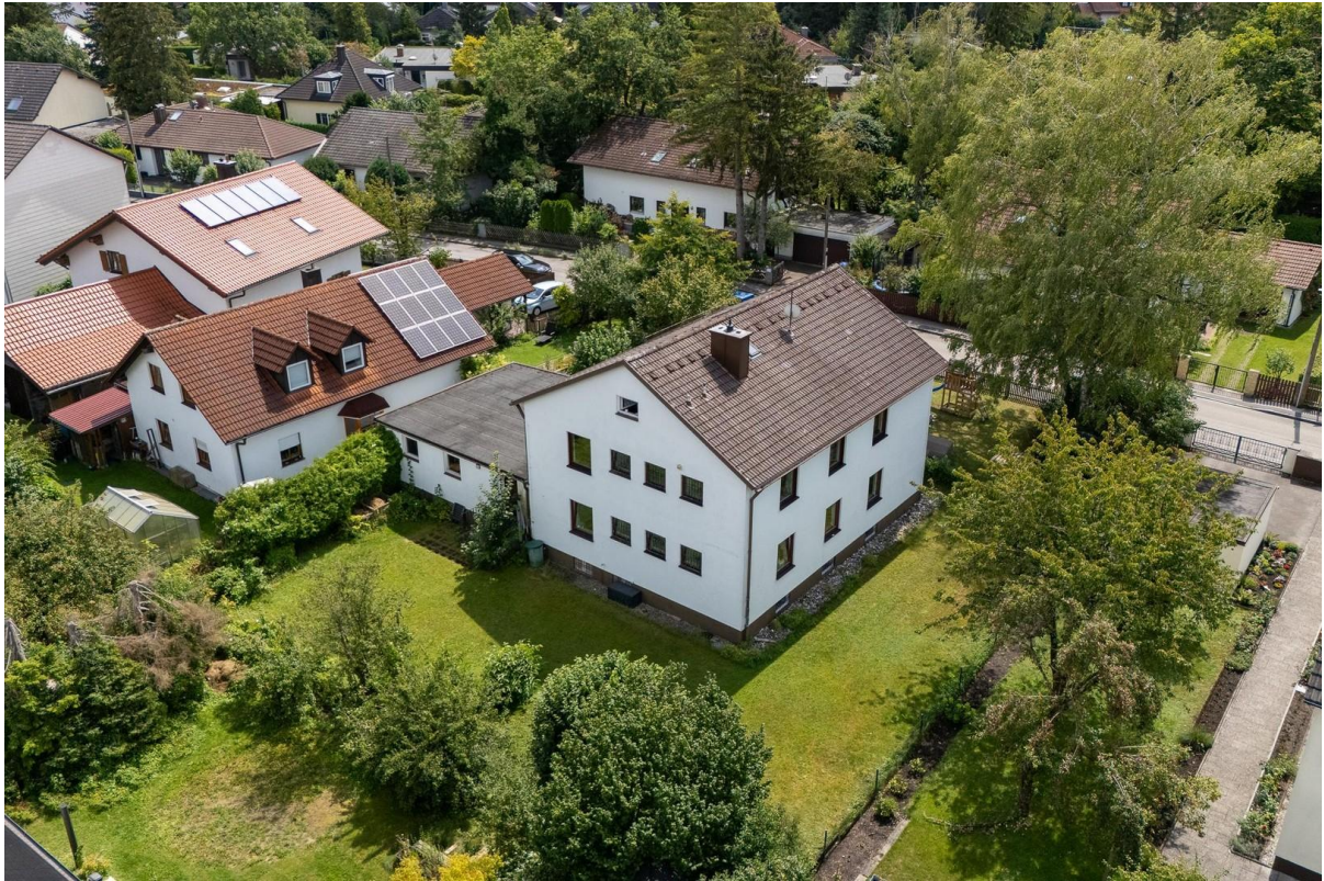
Vogelperspektive Haus + Garten