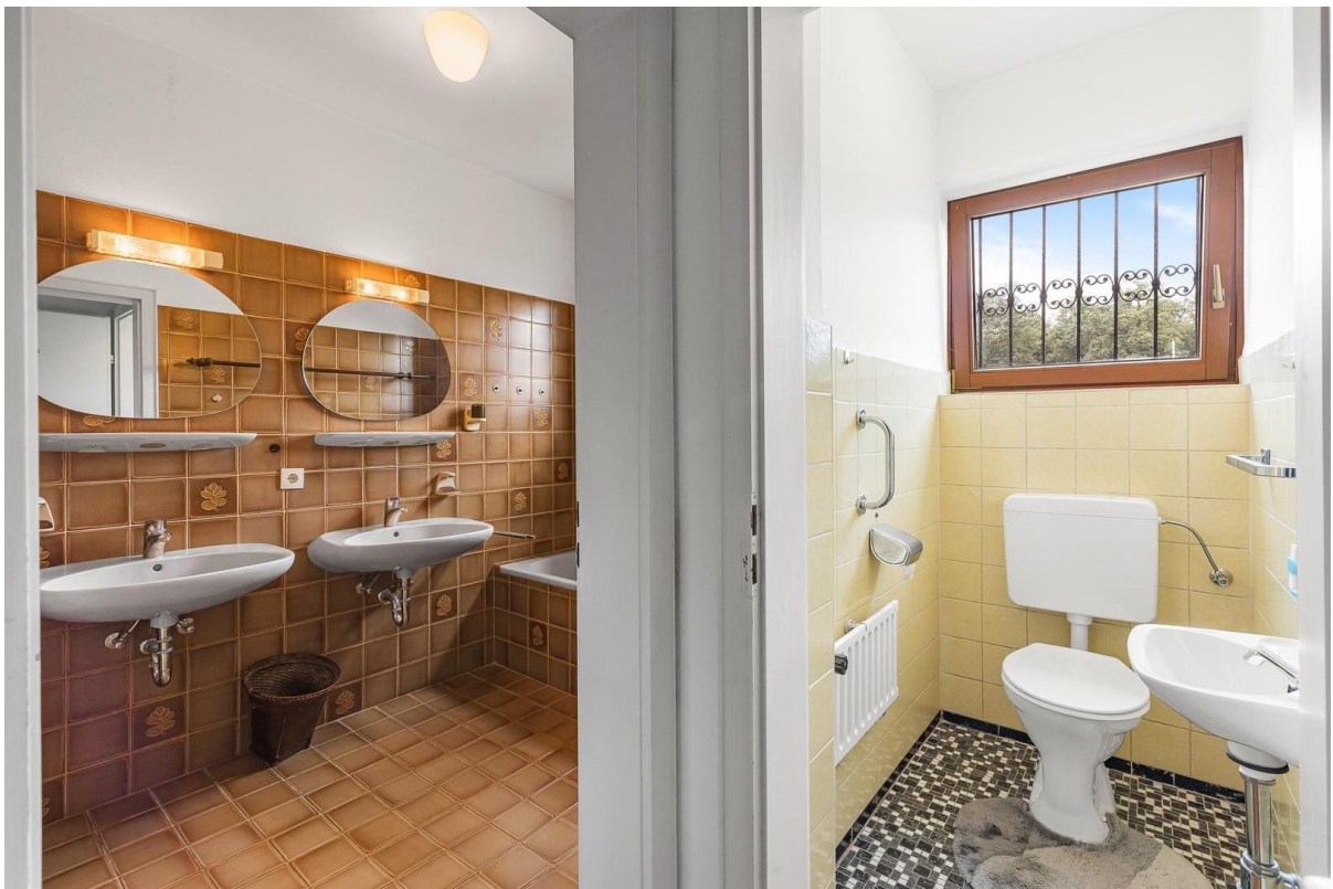
1. OG: Badezimmer + WC