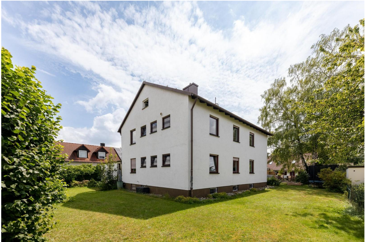
Haus Rückseite mit Garten