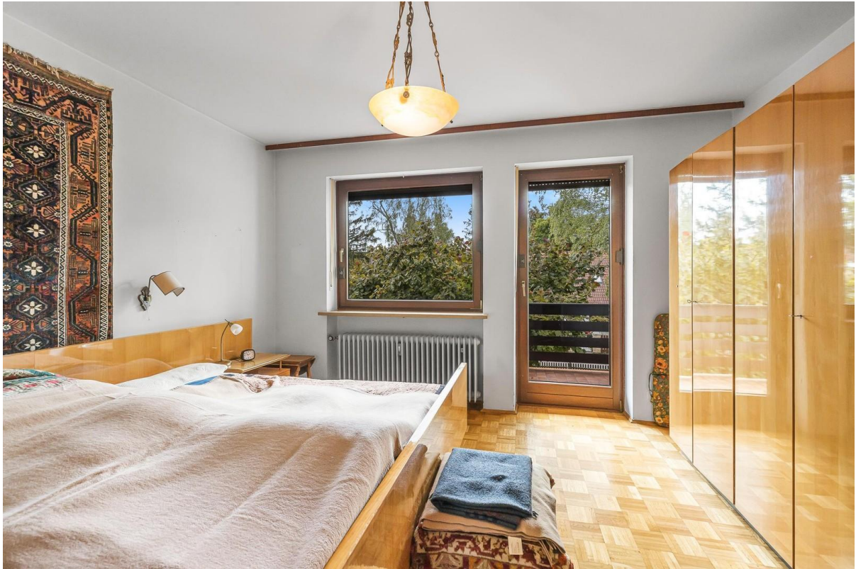
1. OG: Schlafzimmer