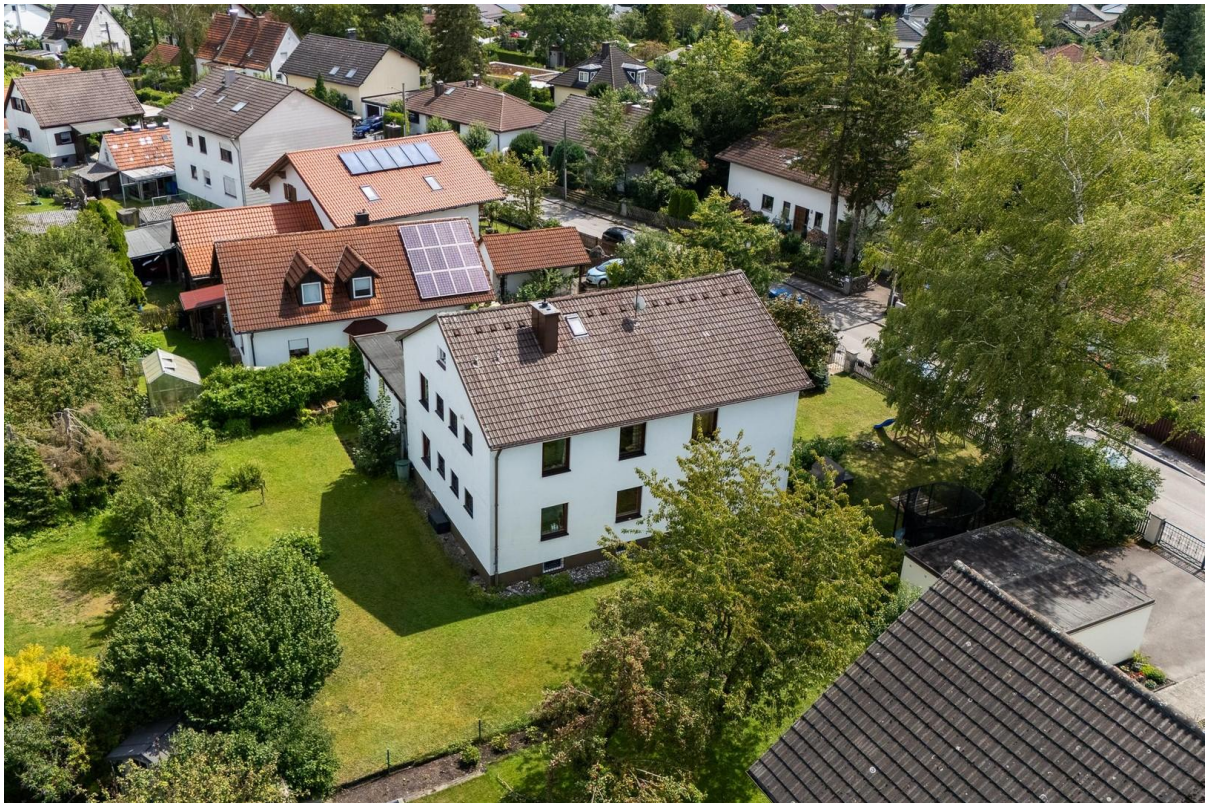
Vogelperspektive Haus + Garten