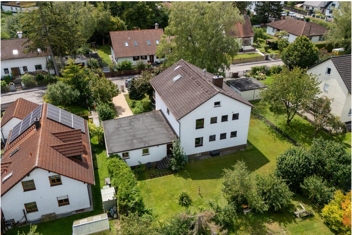
Vogelperspektive Haus + Garten