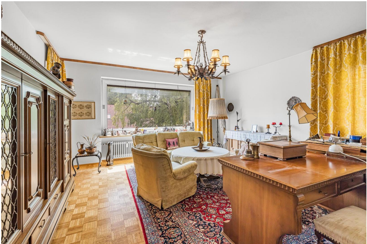
1. OG: Wohnzimmer