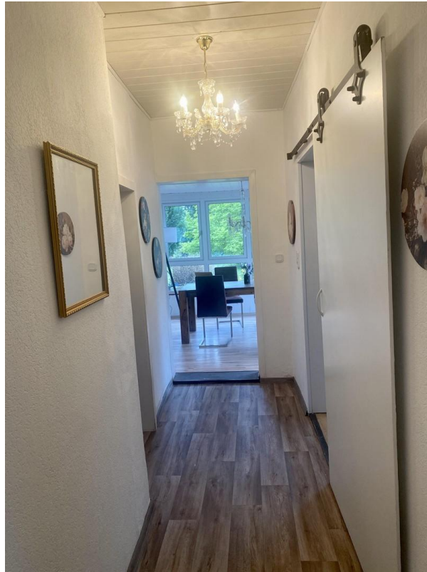
Blick in den Wintergarten