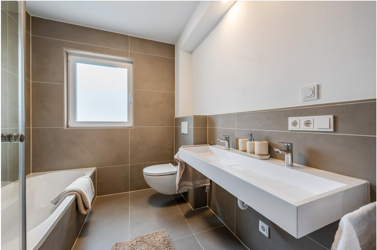
Bad im Obergeschoss