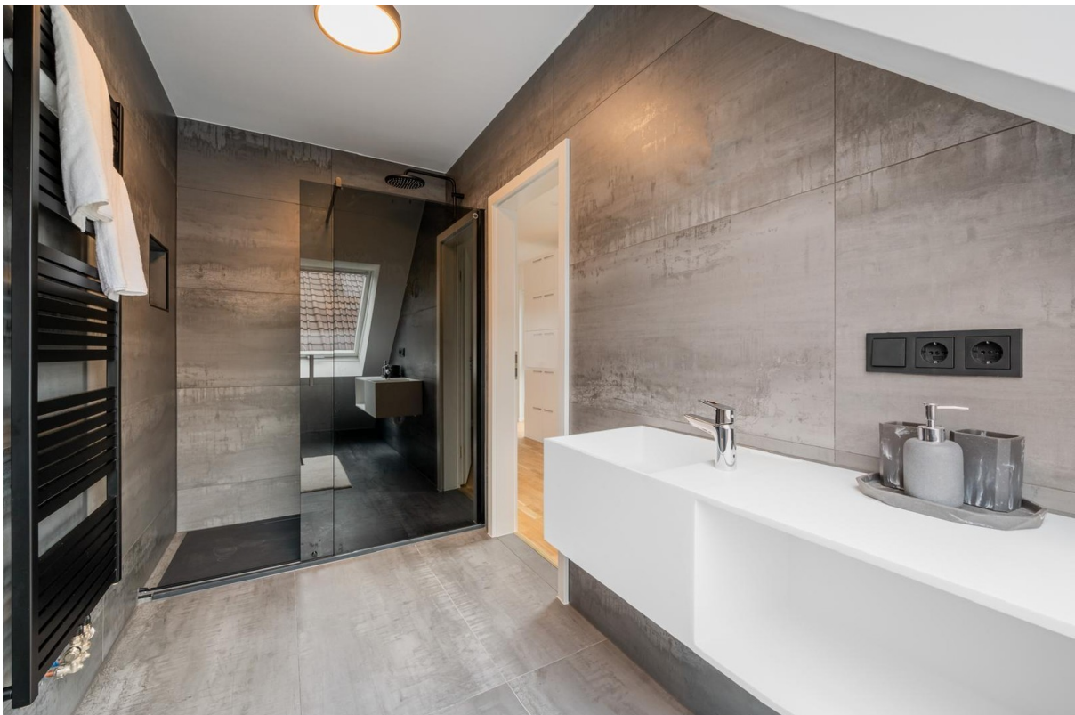
Bad mit Dusche im Dachgeschoss