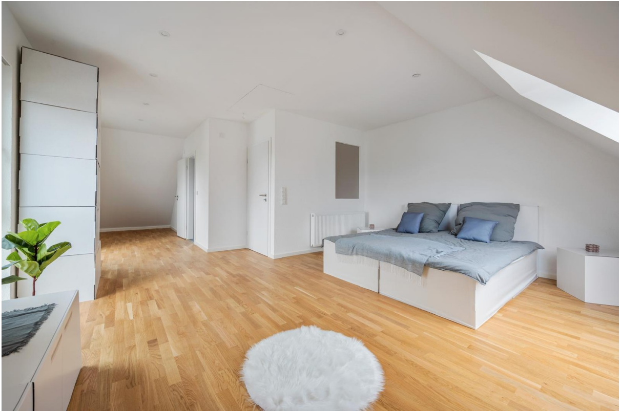
Schlafzimmer im Dachgeschoss