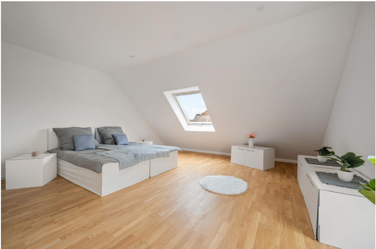
Schlafzimmer im Dachgeschoss