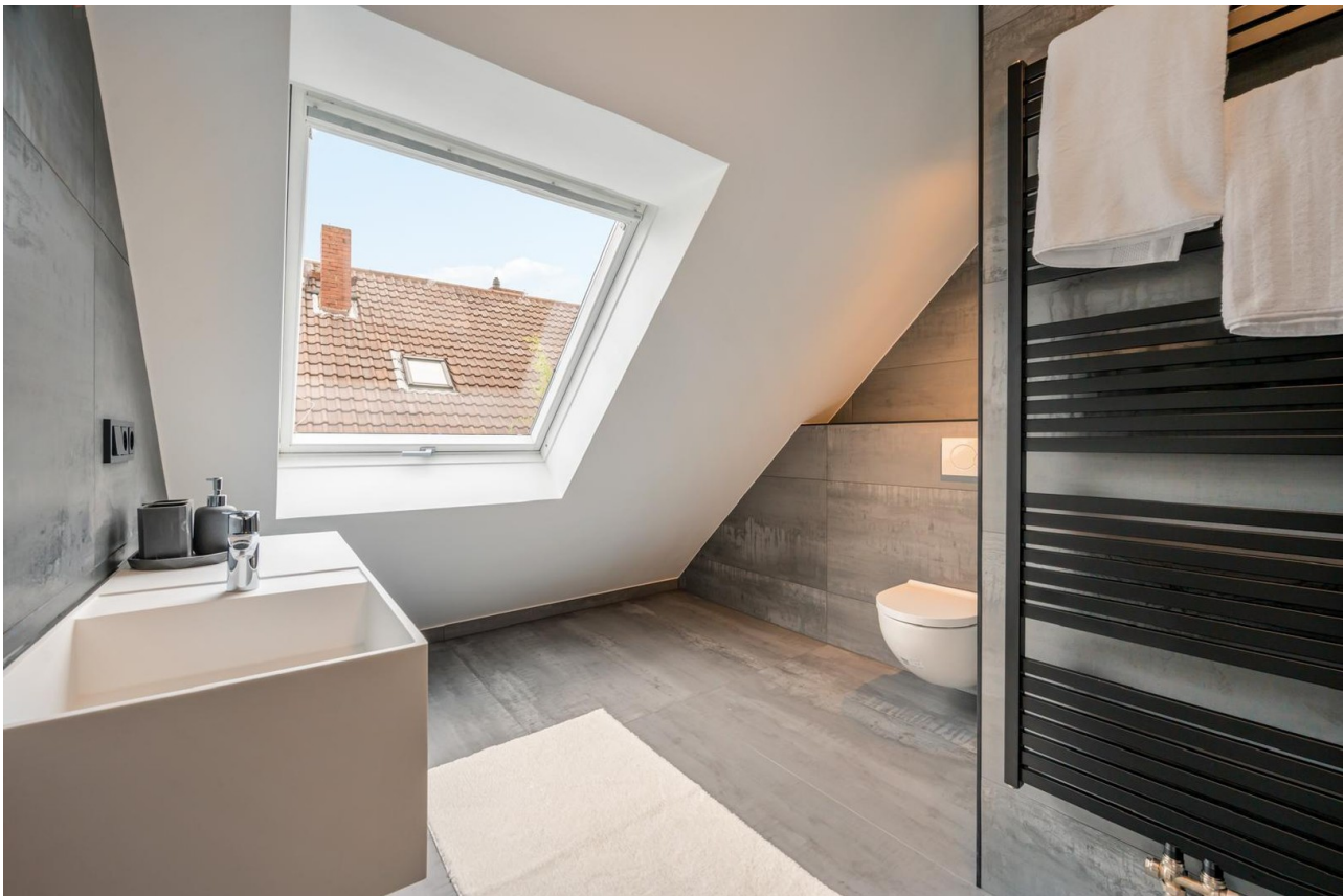
Bad im Dachgeschoss