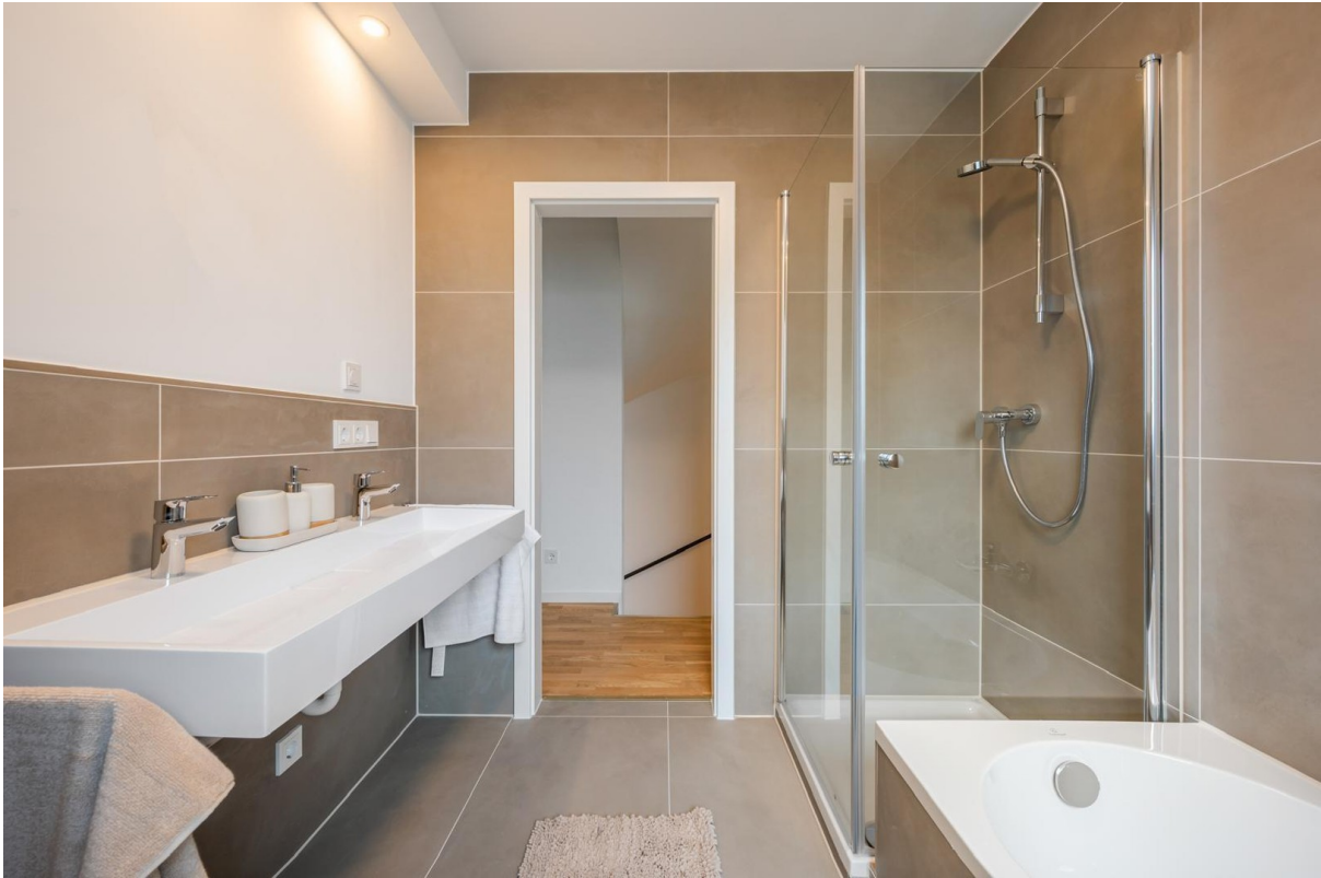
Bad mit Dusche & Badewanne