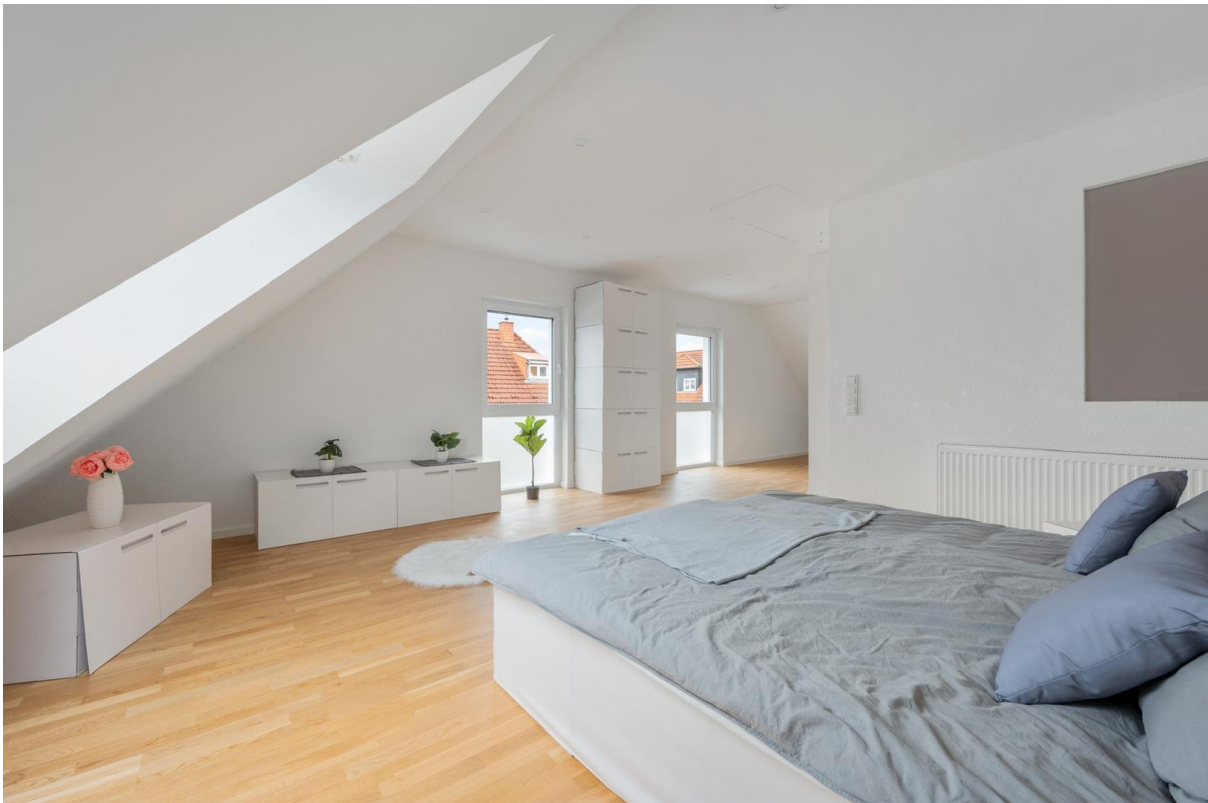
Schlafzimmer im Dachgeschoss