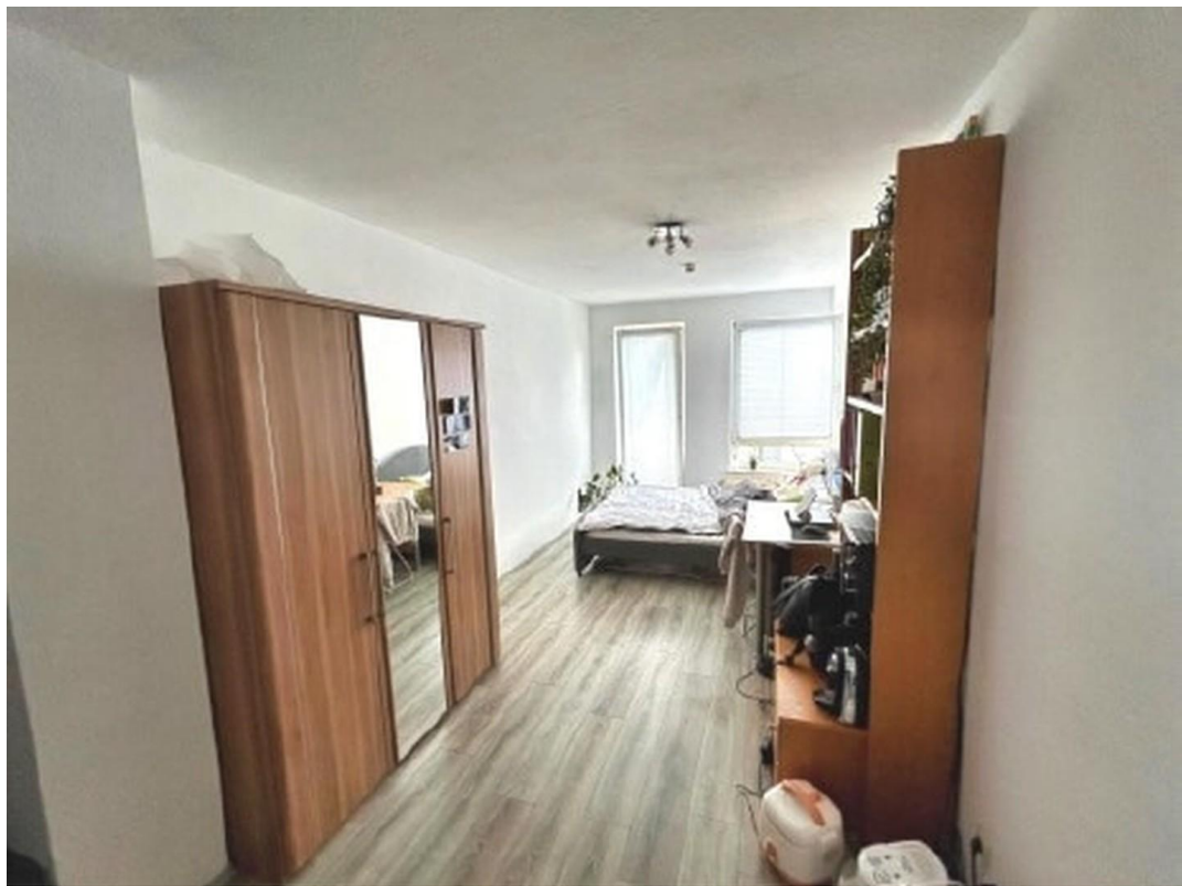
Zimmer (Blick aus der Küche)