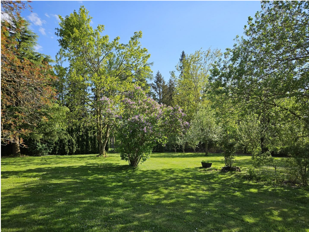
herrlicher duftender Flieder