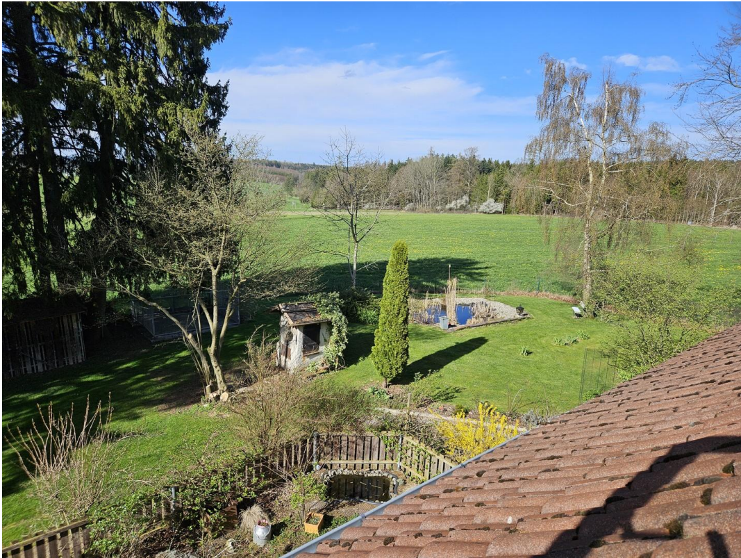
Blick aus einem Zimmer