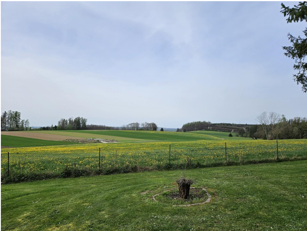
Grillstelle mit mega Weitsicht