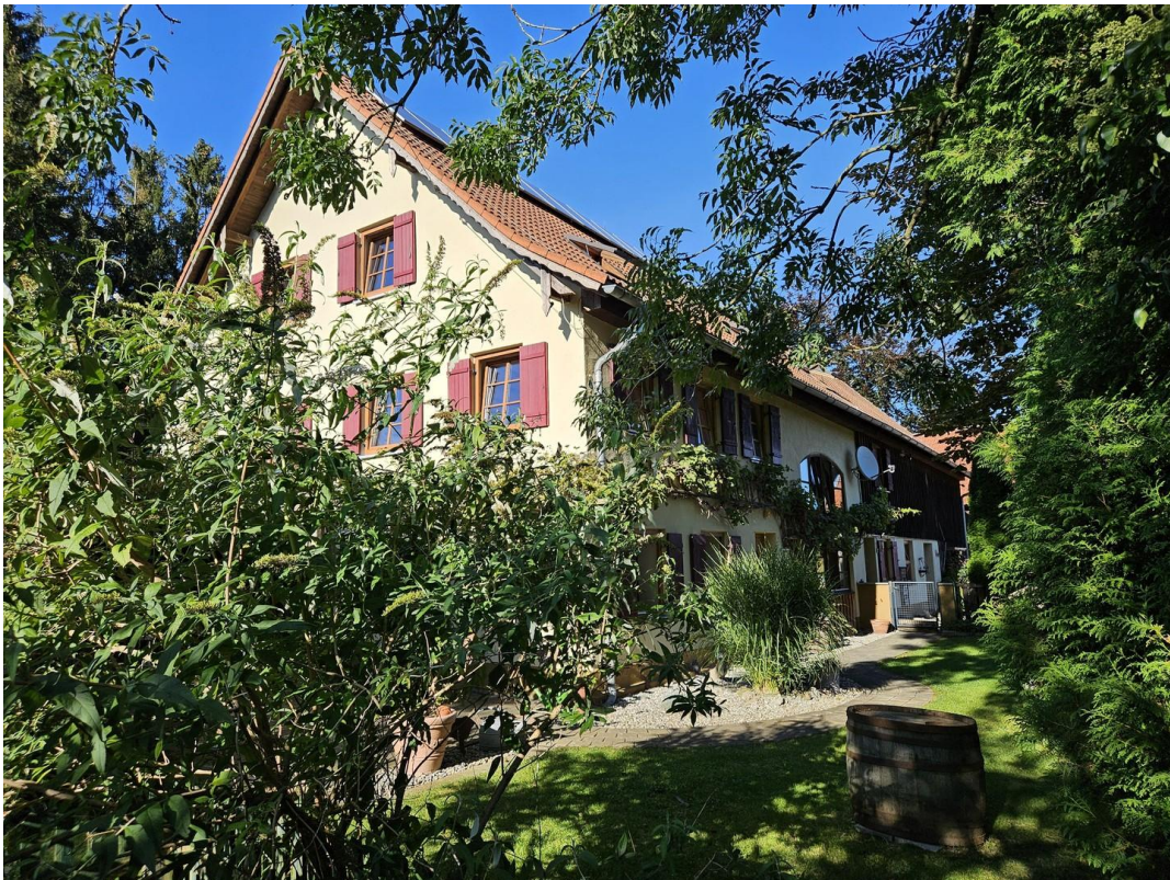
sonnig und auch schattig