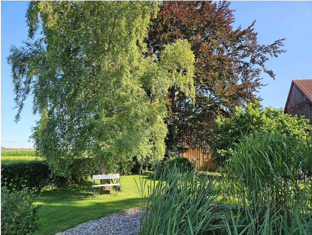
überall traumhaft schön