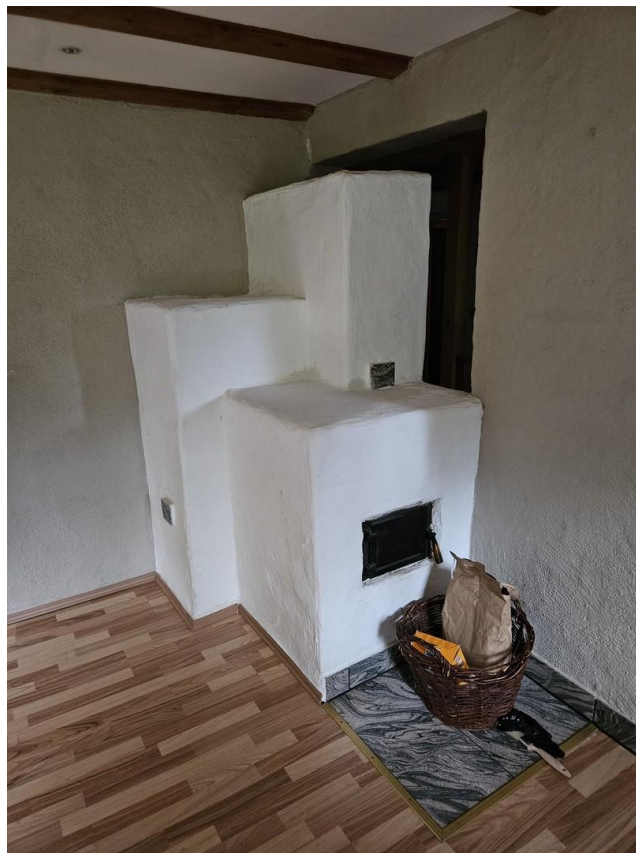
Grundofen Kachelofen Haupthaus