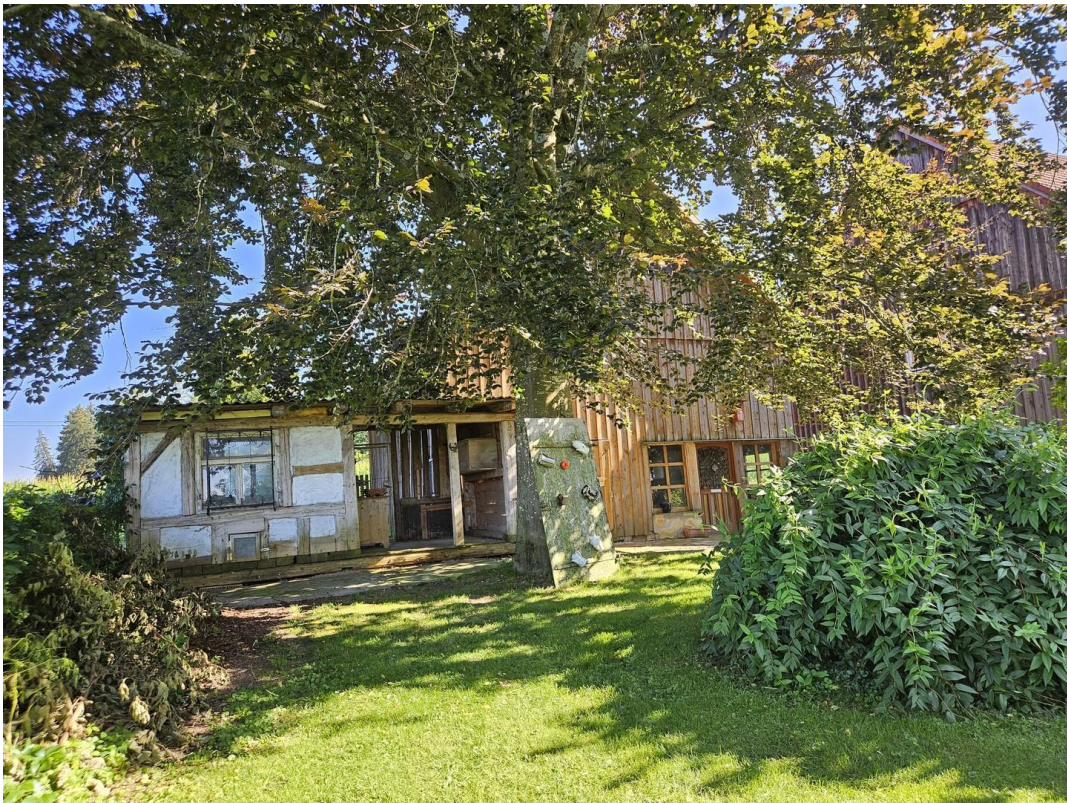
Hühnerstall und Nebengebäude