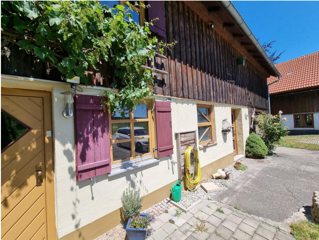
Wasseranschluss und Strom