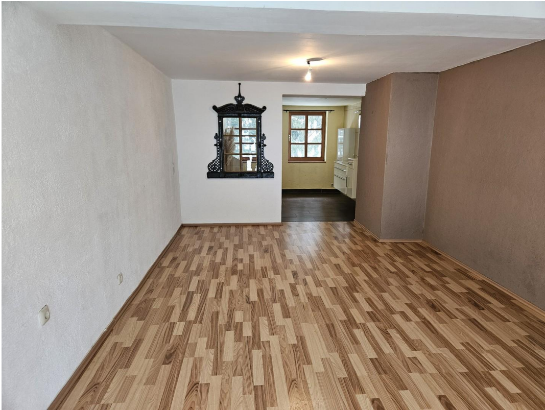
Zimmer Haupthaus/vor Bad