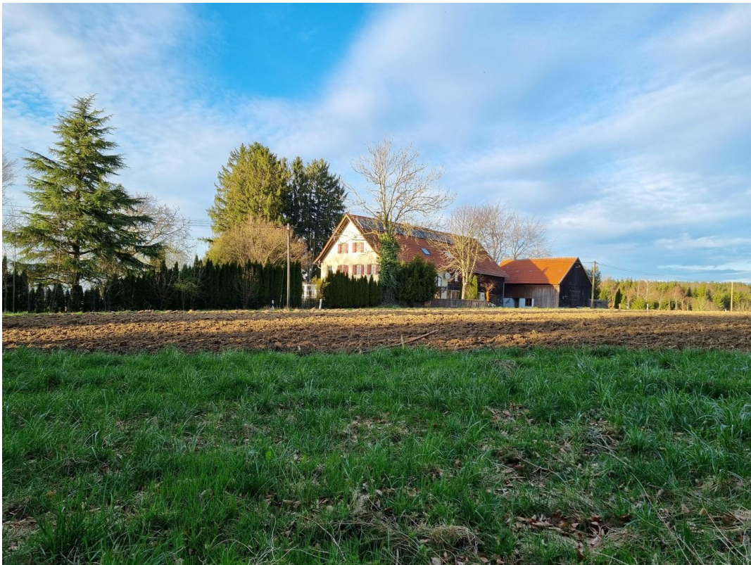
sonnig und hell