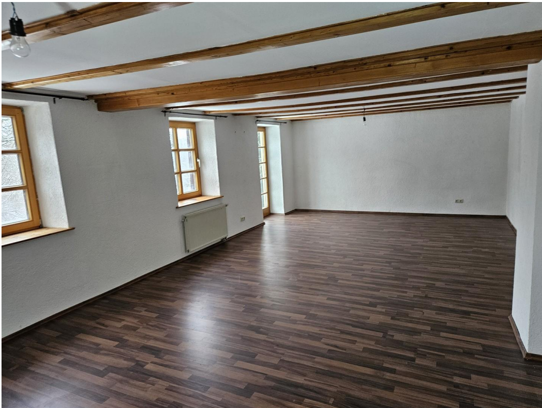
Zimmer Haupthaus OG