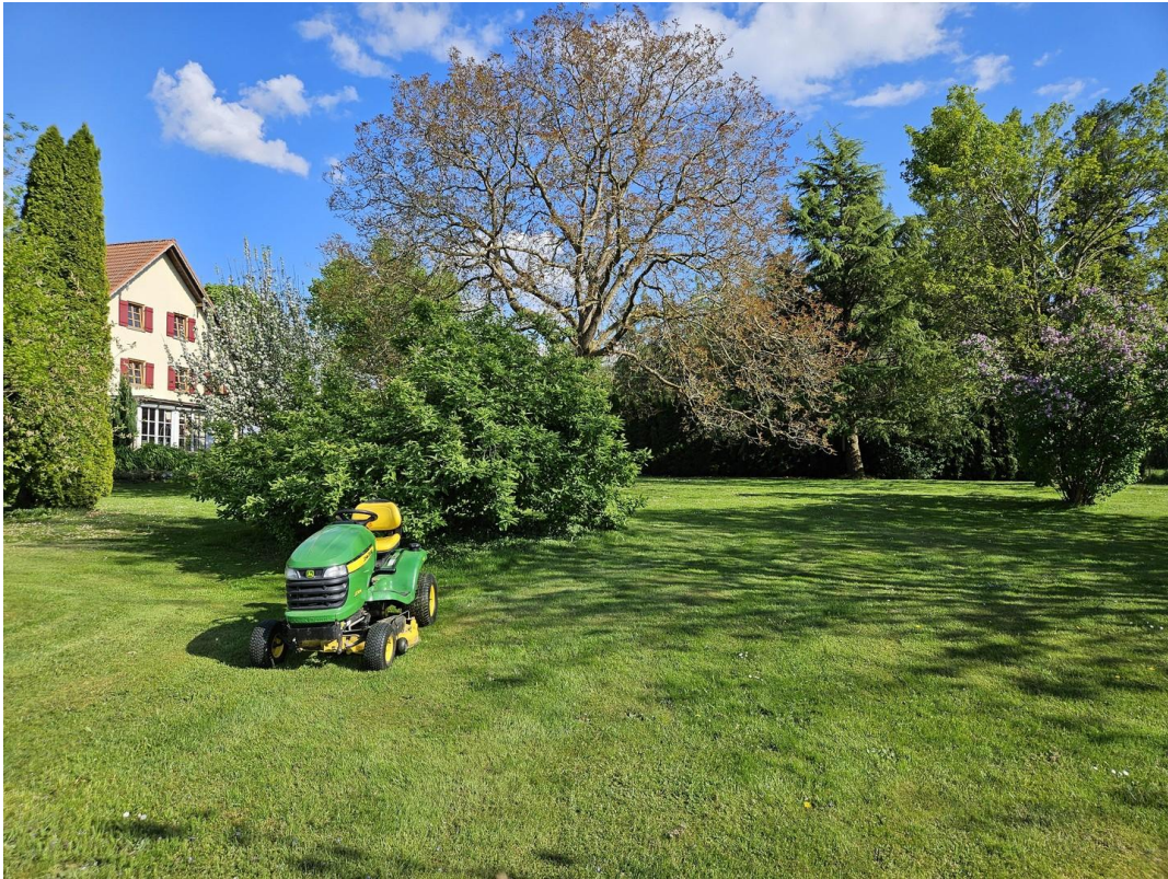
incl. John Deere Mulcher