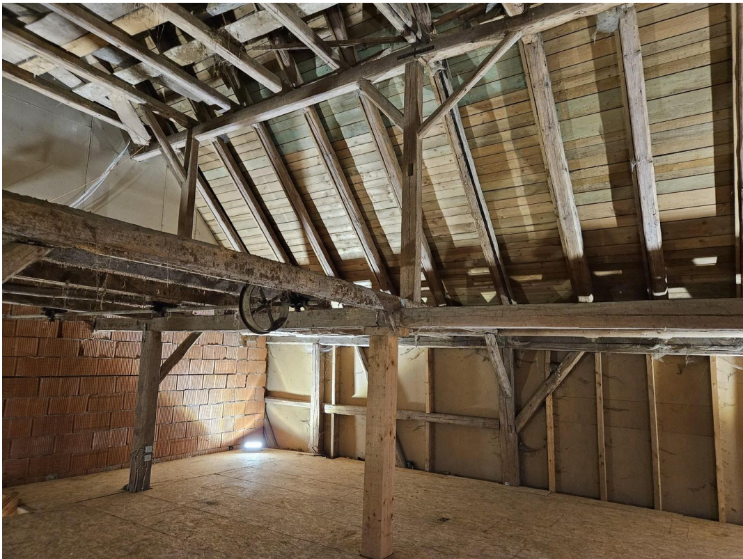
viele Ausbaumöglichkeiten Haus