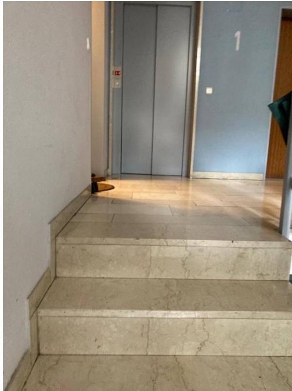
Treppenhaus mit Lift