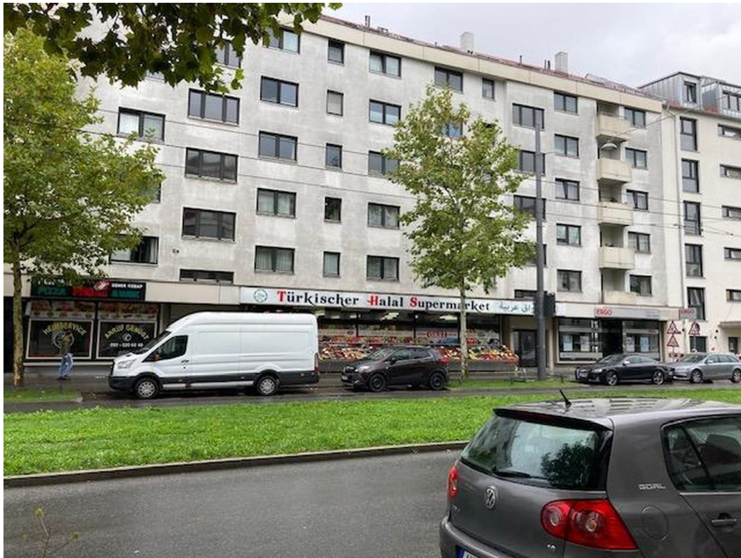
Ansicht Haus Vorderseite