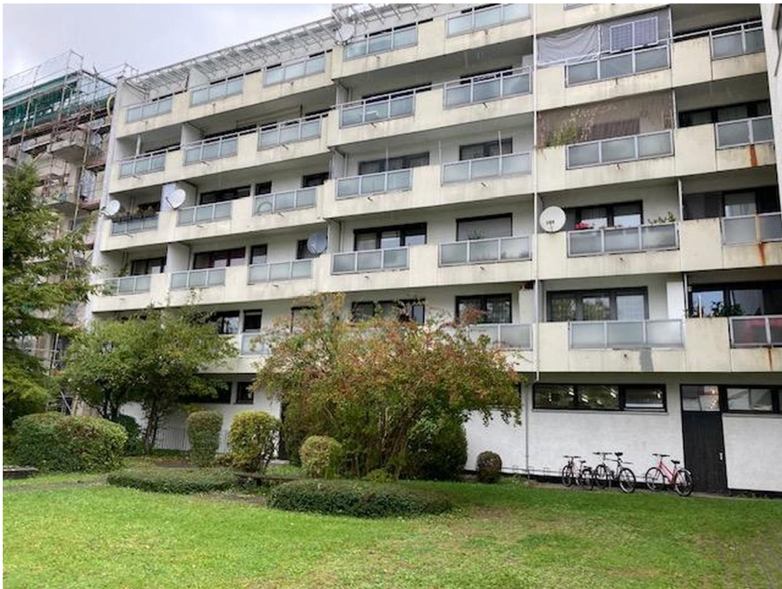
Ansicht Haus Rückseite