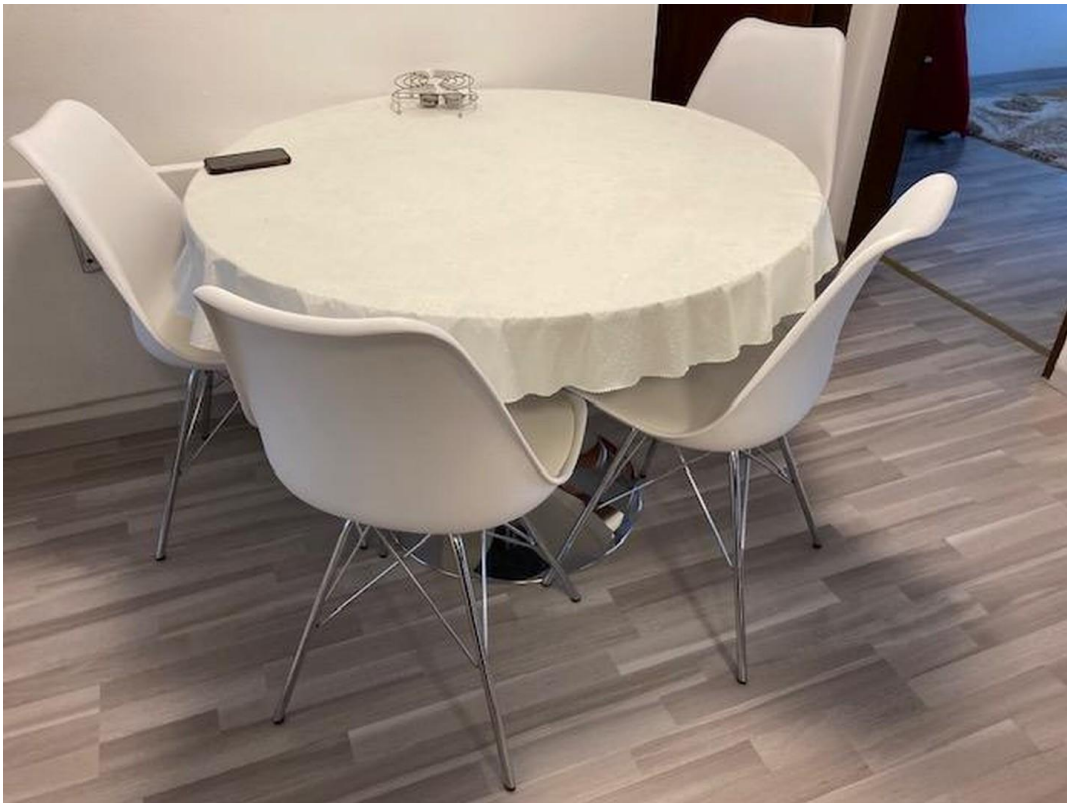
Eßplatz in der Diele