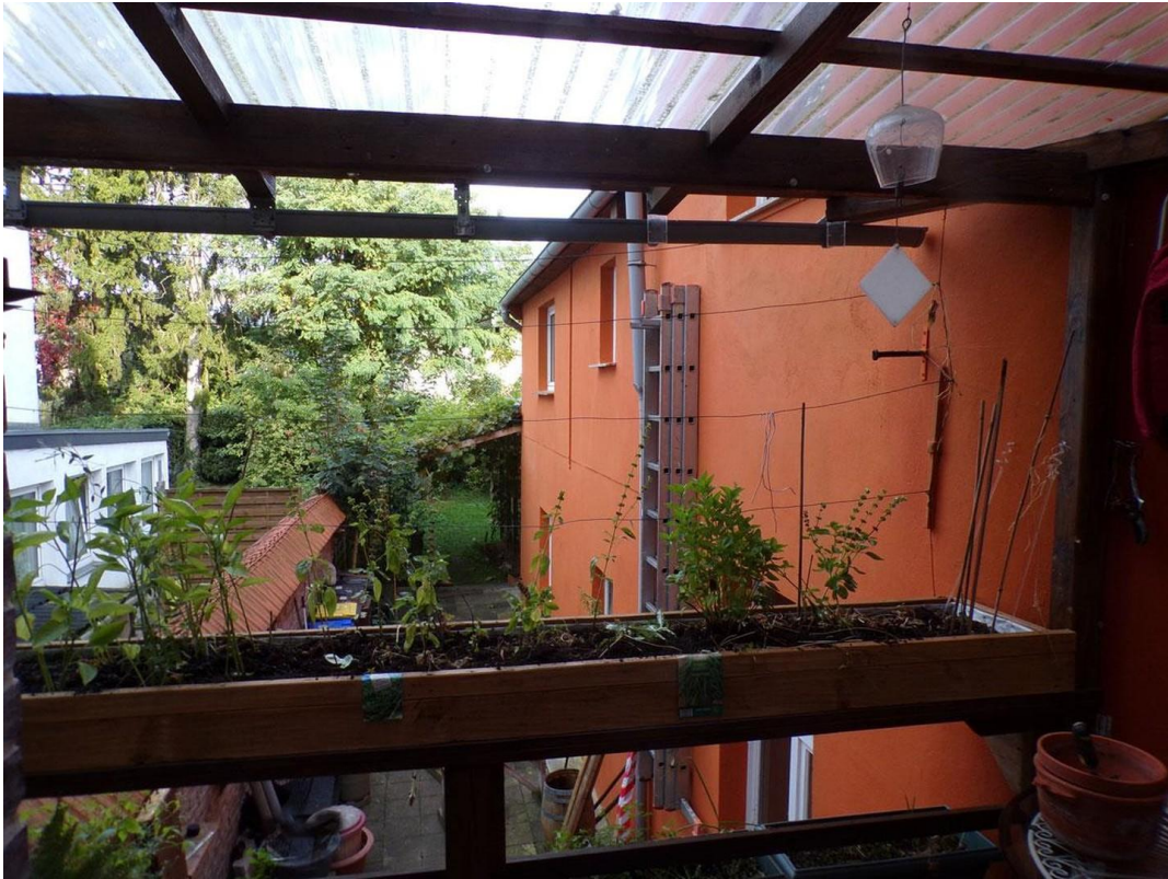
Blick zum Hof und Garaten