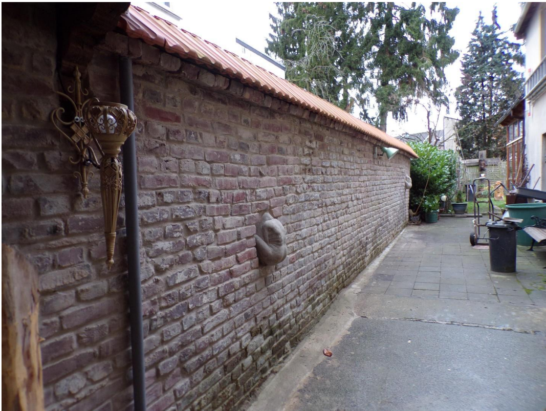
alte sanierte Mauer