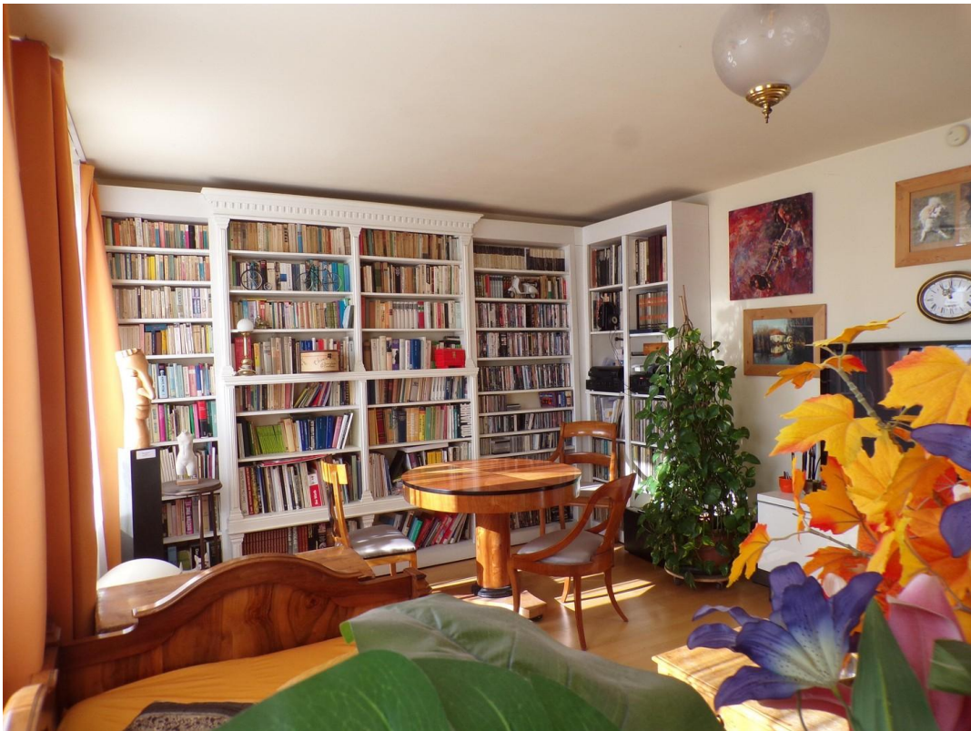
Wohnzimmer im I. Stock