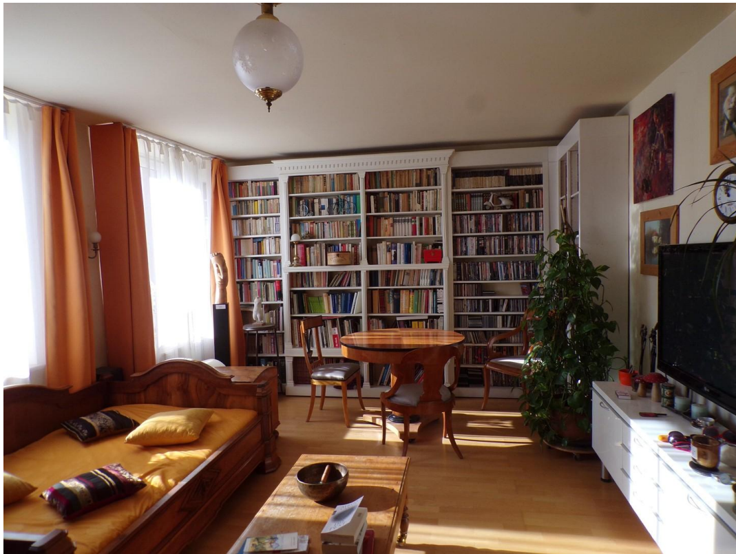
Wohnzimmer im I. Stock