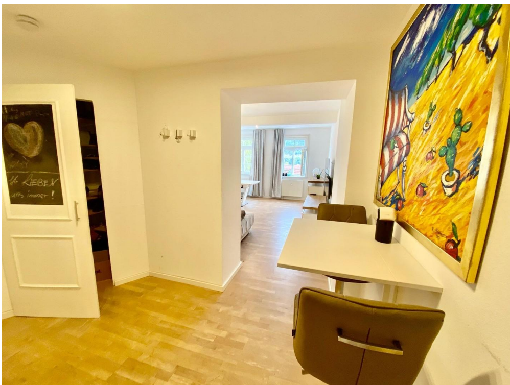
Flur Blick nach Wohnen