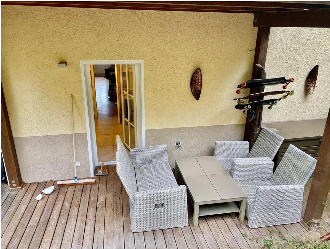
Loungemöbel, überdachte Ter.