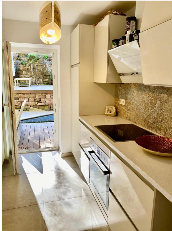
Küche Blick zur Terrasse 1