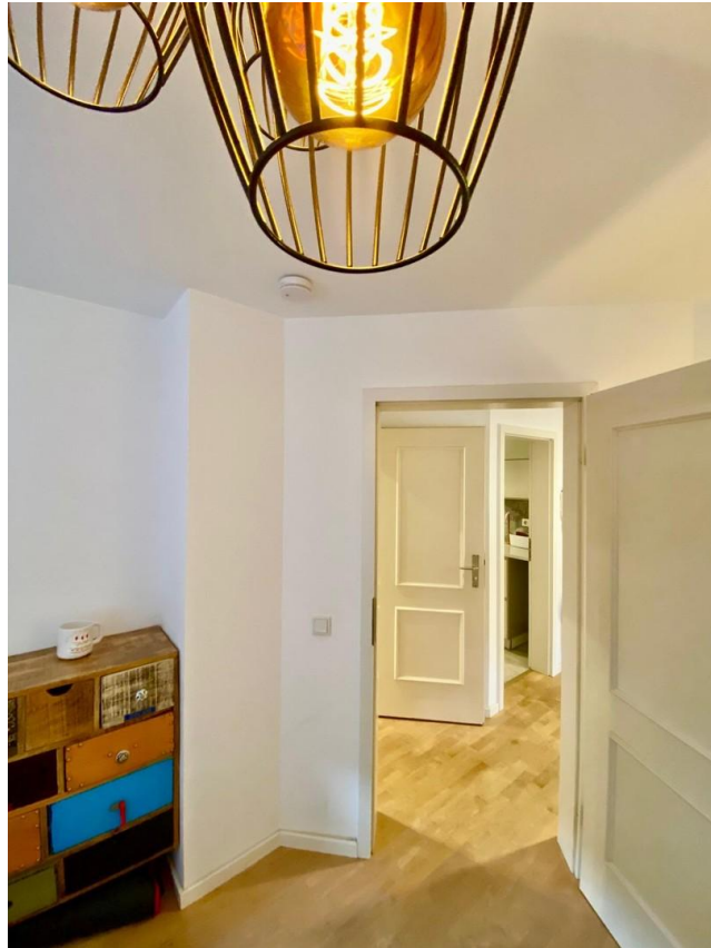
Blick von Lounge zu Flur