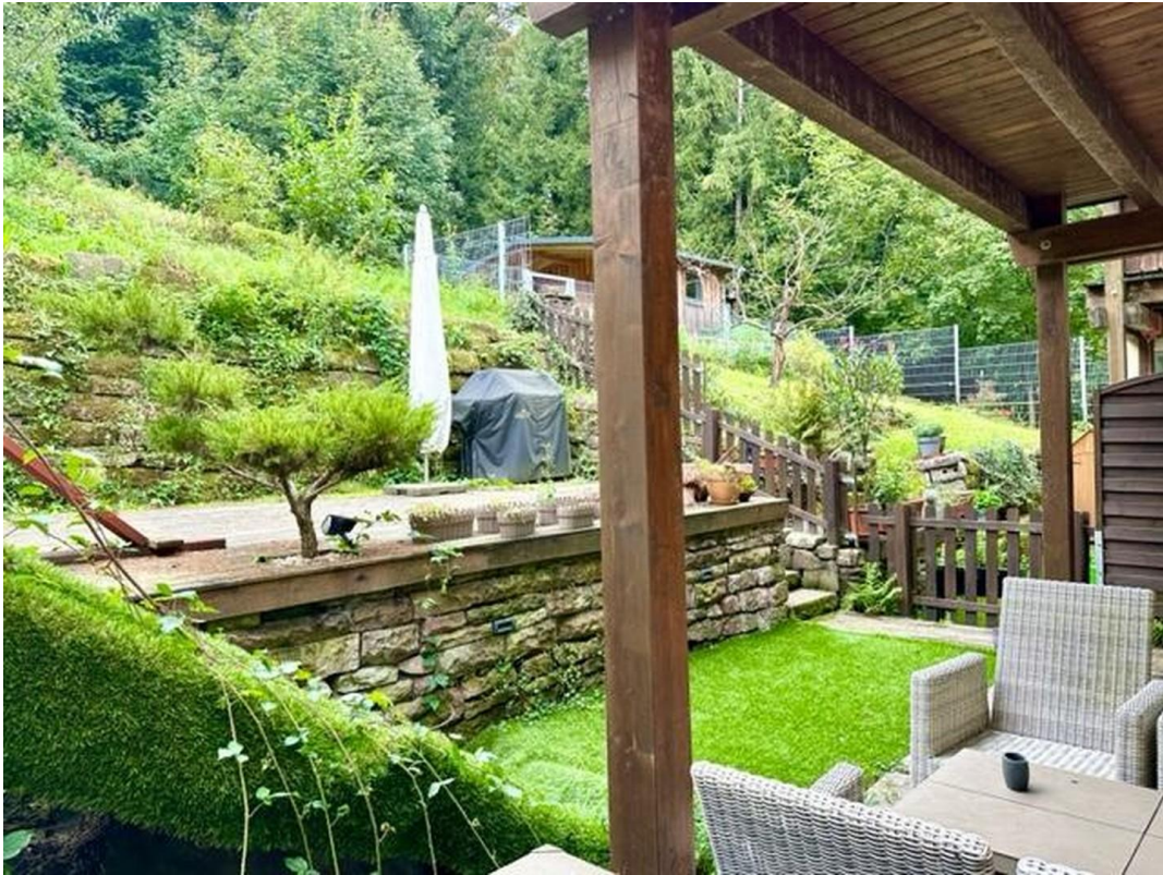
Aussenbereich im Grünen