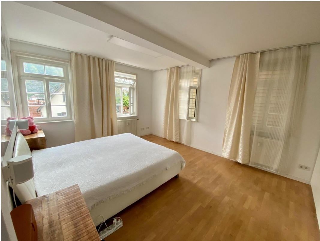
großer, sonniger Schlafraum