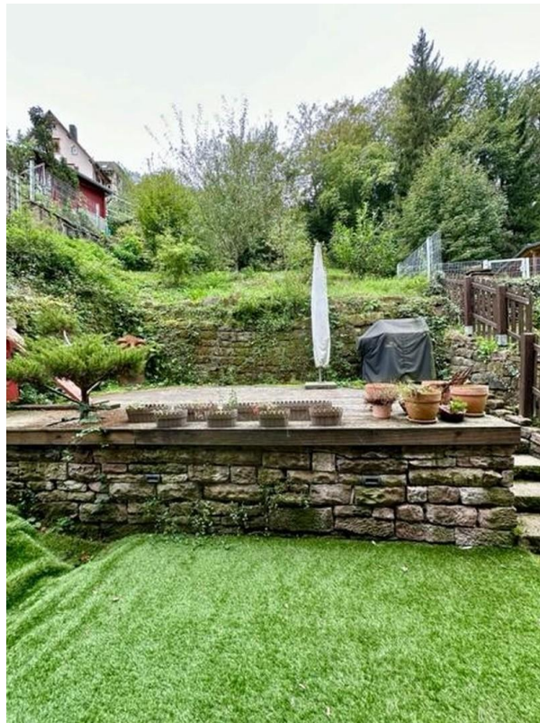
Terrasse auf 2 Ebenen