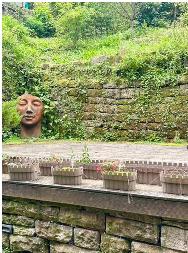
Freisitz 2. Ebene