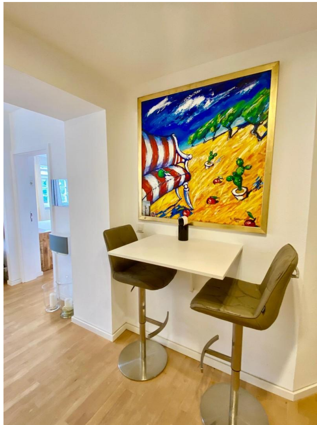
Flur mit Hochtisch