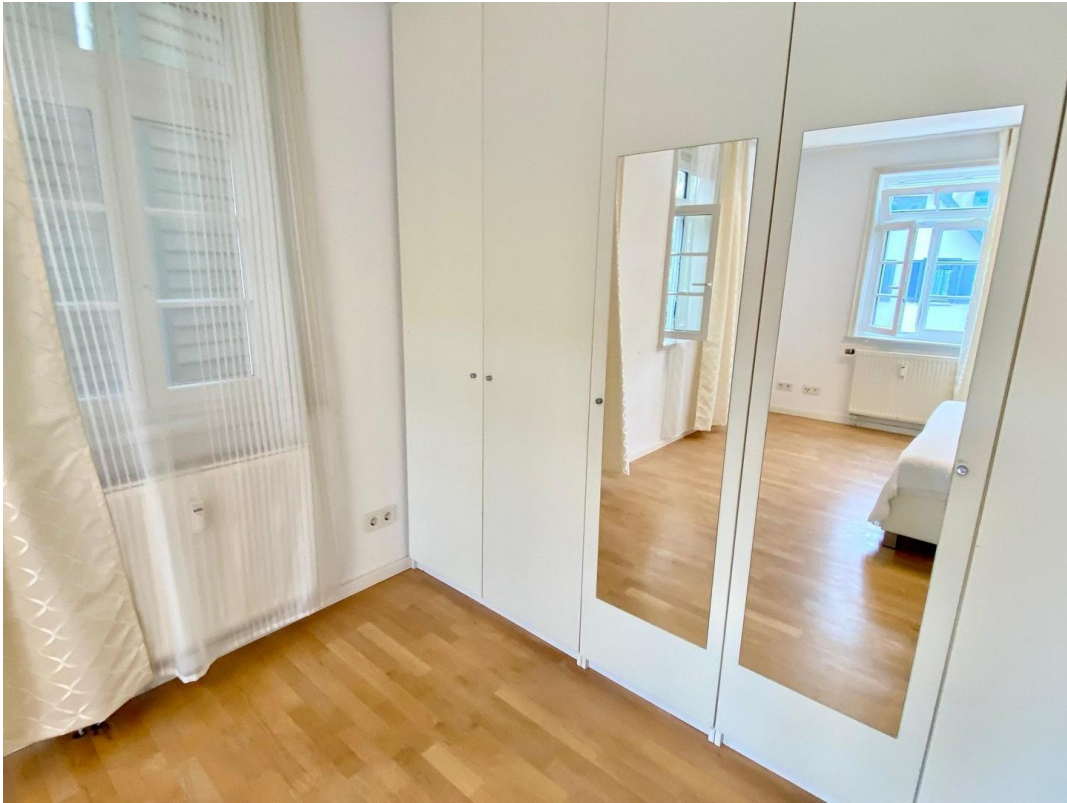
Kleiderschrank mit Spiegel