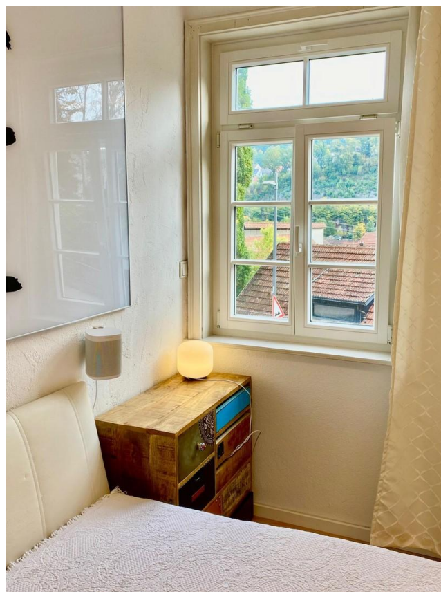
Blick und Morgensonne