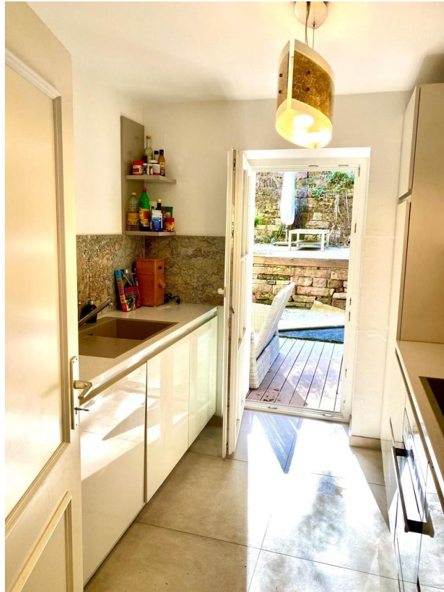
Küche Blick zur Terrasse 2