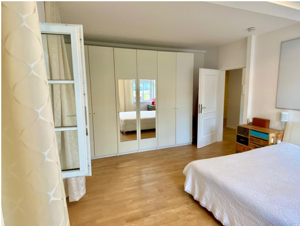
Viel Platz im Schlafrum