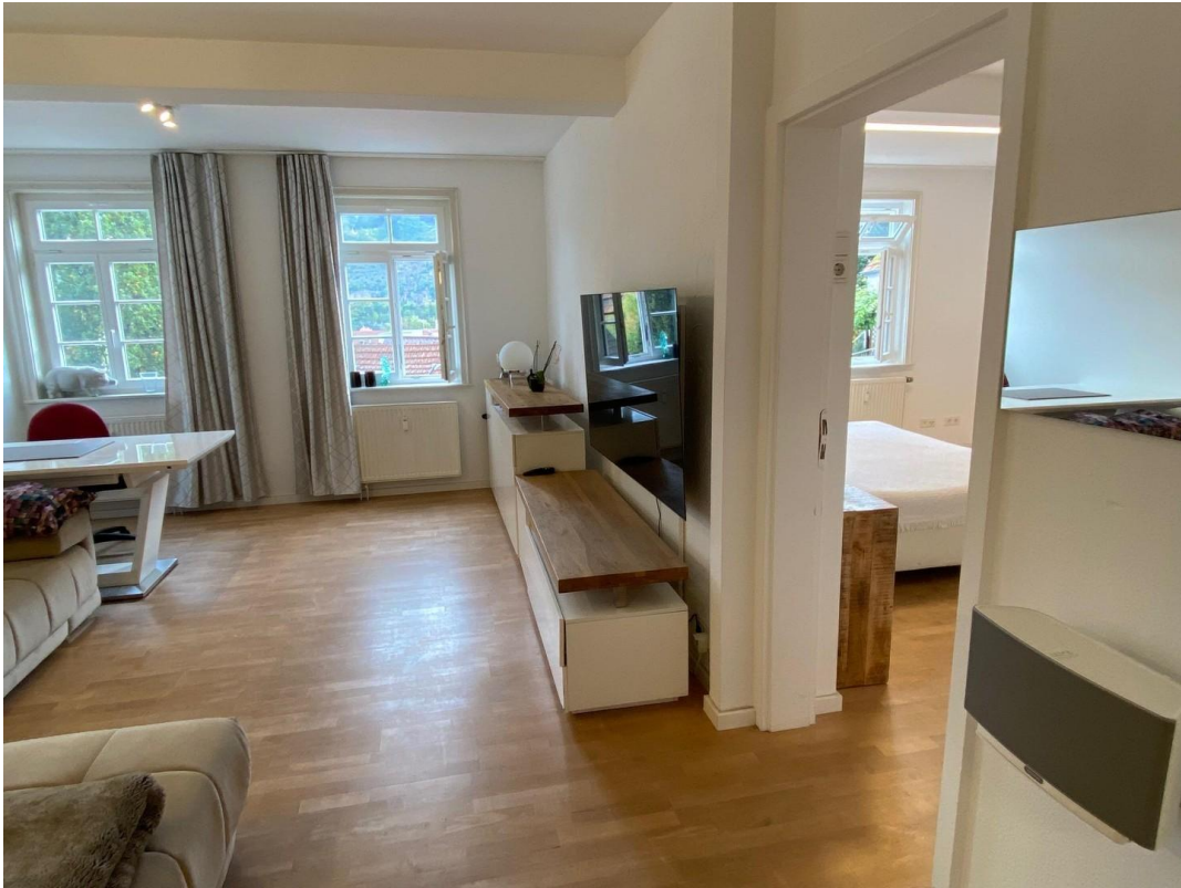
Wohnen mit Blick zu Schlafen