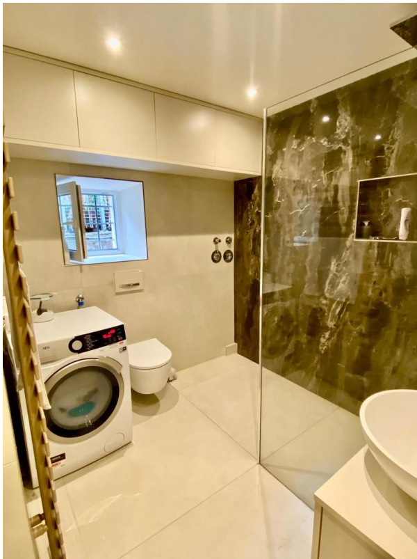
Luxusbad mit XXL Dusche