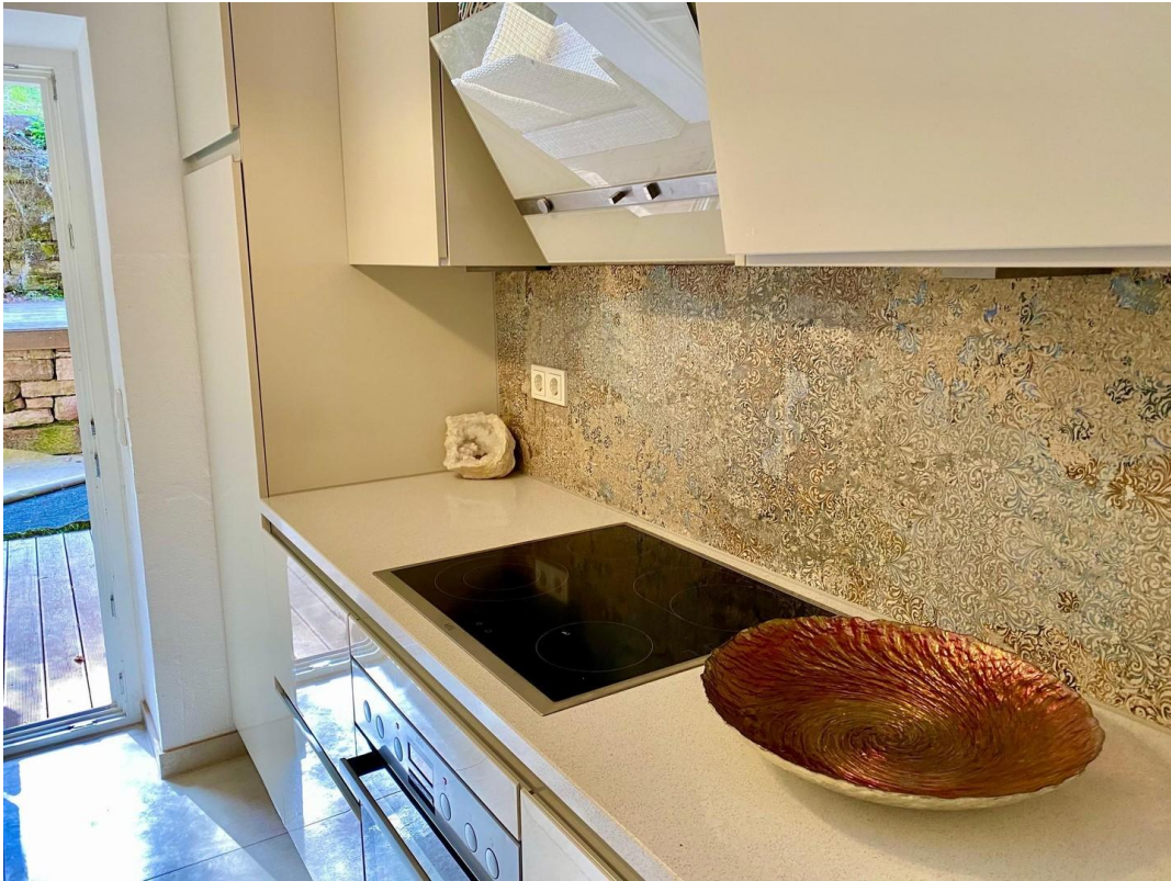
Küche Arbeitsbereich rechts