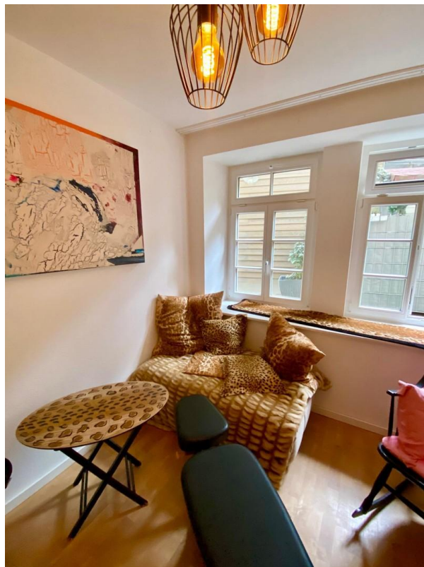
gemütlicher 2. Wohnbereich