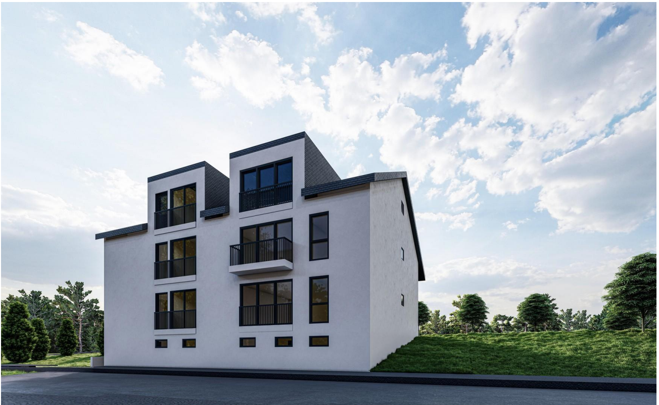
Ansicht Straße II