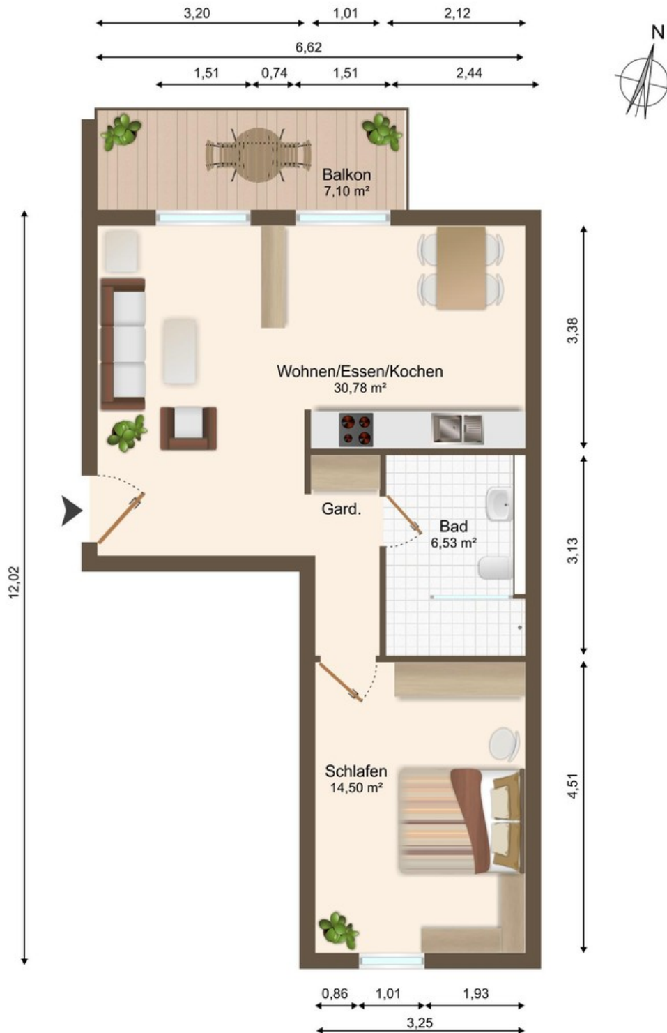
Grundriss WG 4