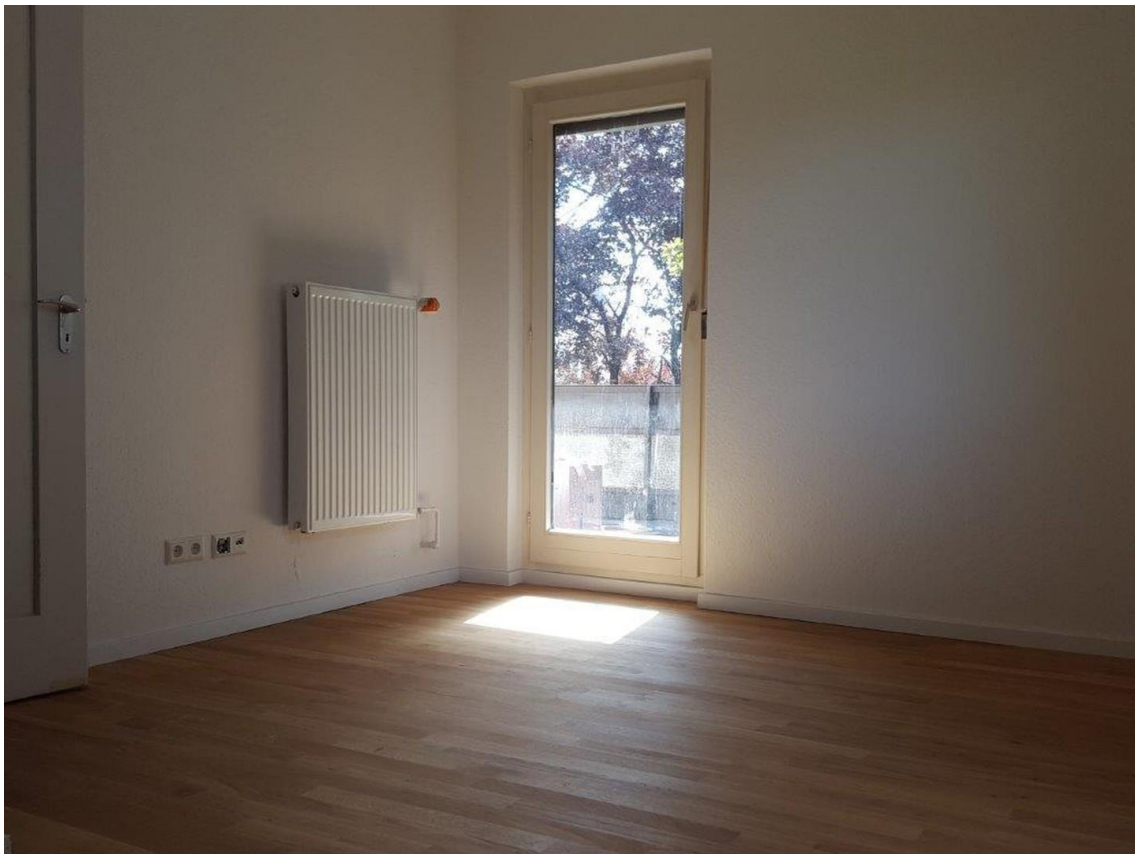
Zimmer mit Zugang zum Balkon