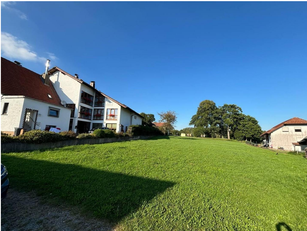
Blick auf Grundstück