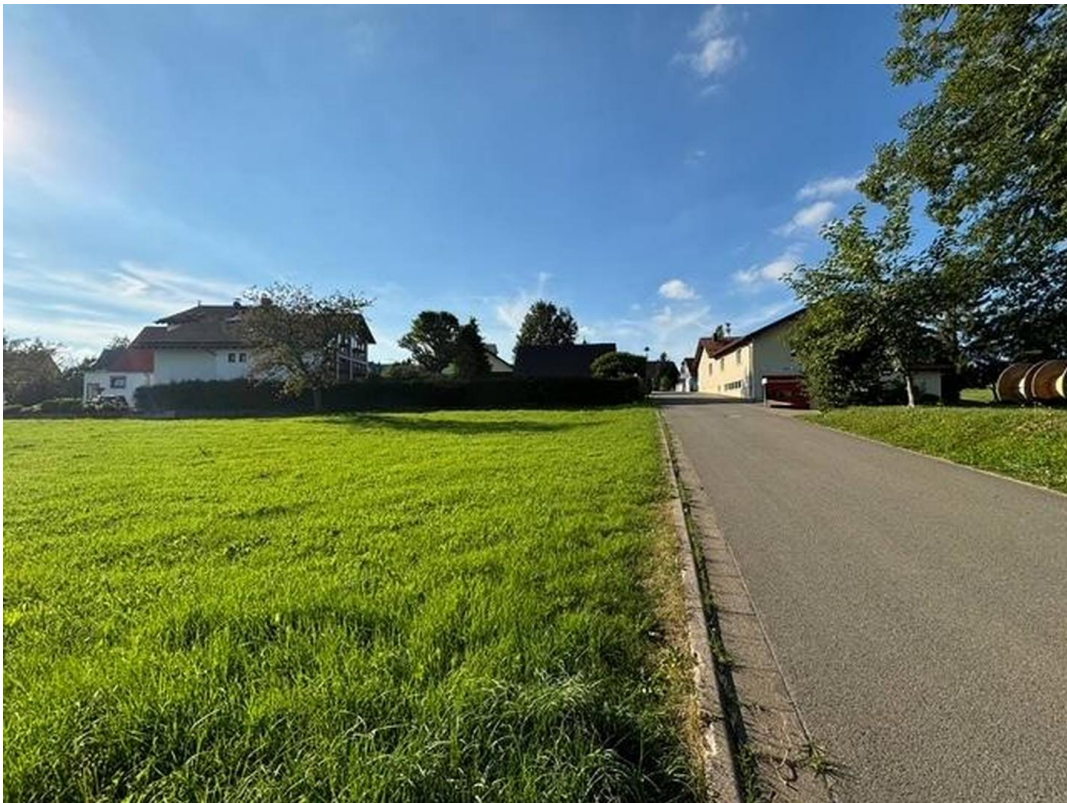
Blick auf Grundstück