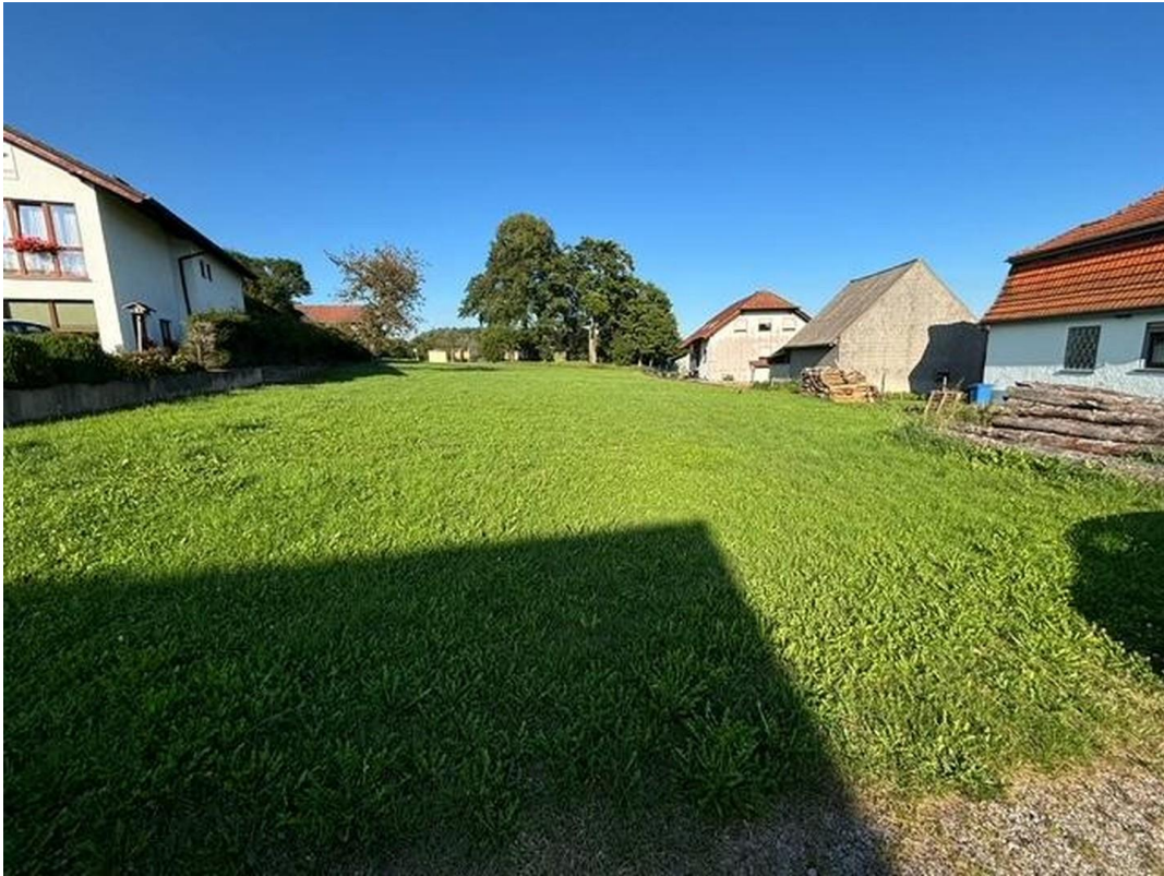
Blick auf Grundstück