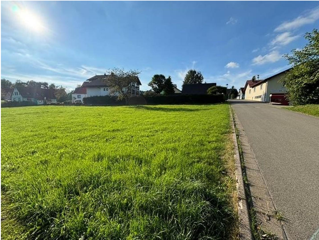
Blick auf Grundstück