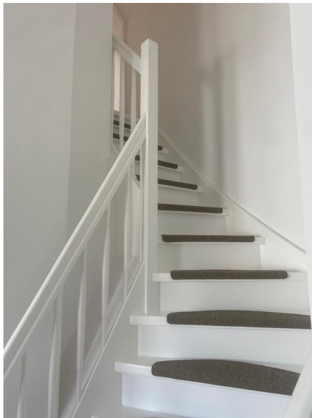
Treppe zum Schlafzimmer