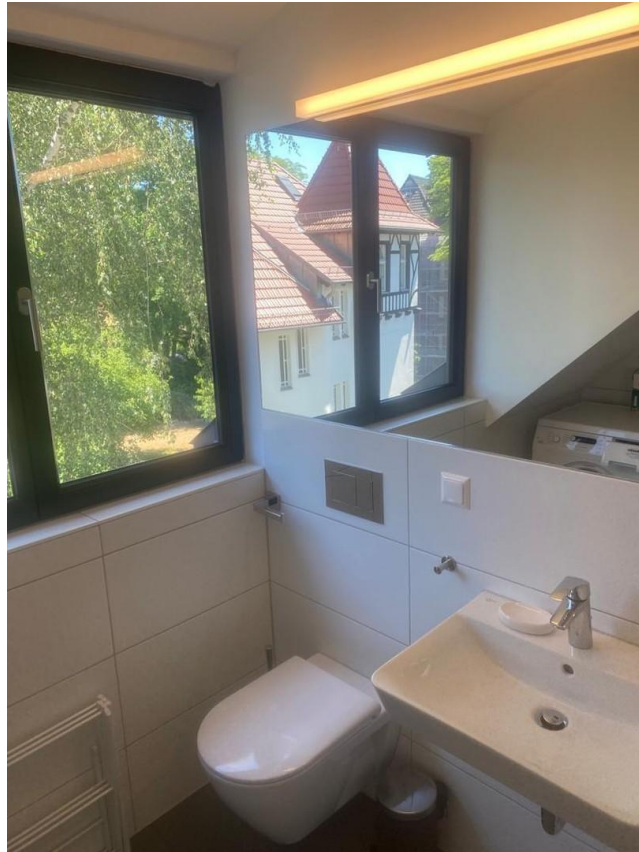
Bad und Blick in den Garten