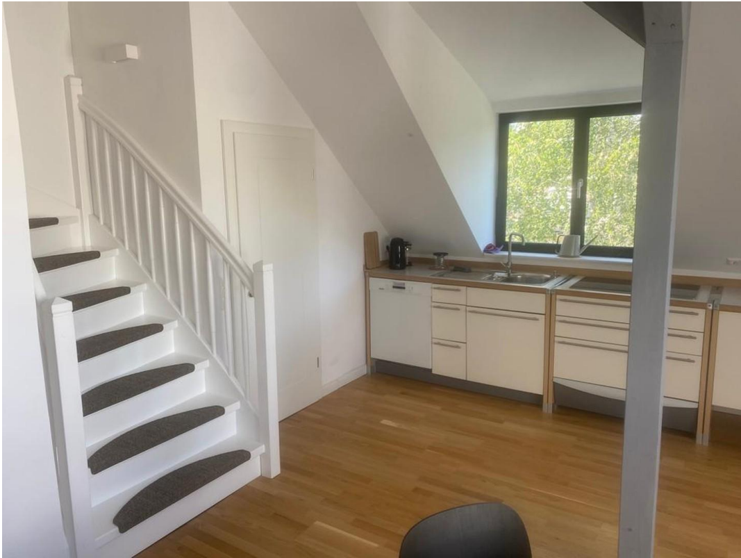
Blick auf die Küchenzeile