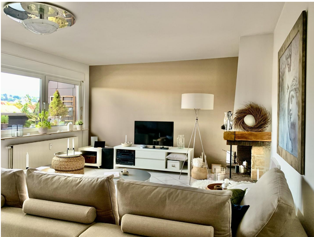
Wohnzimmer + Kamin