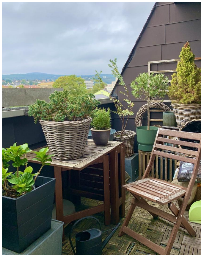
Balkon Blick zur Hard