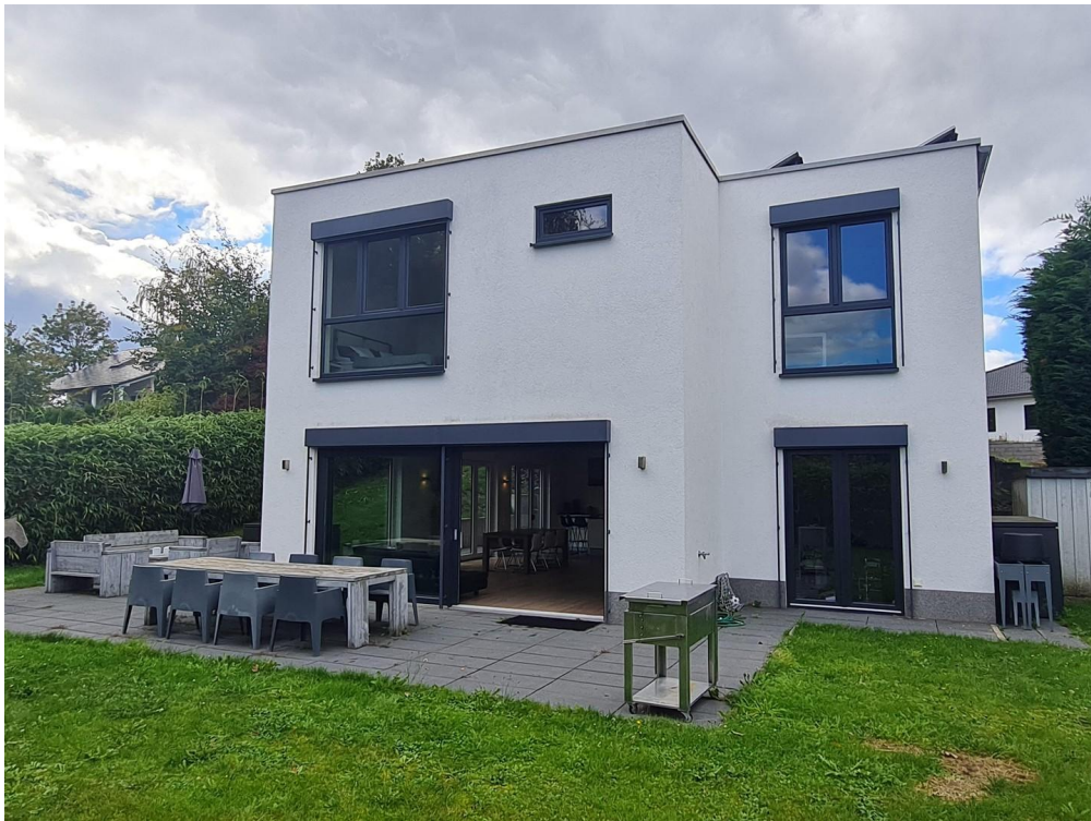
Rückansicht & Terrasse