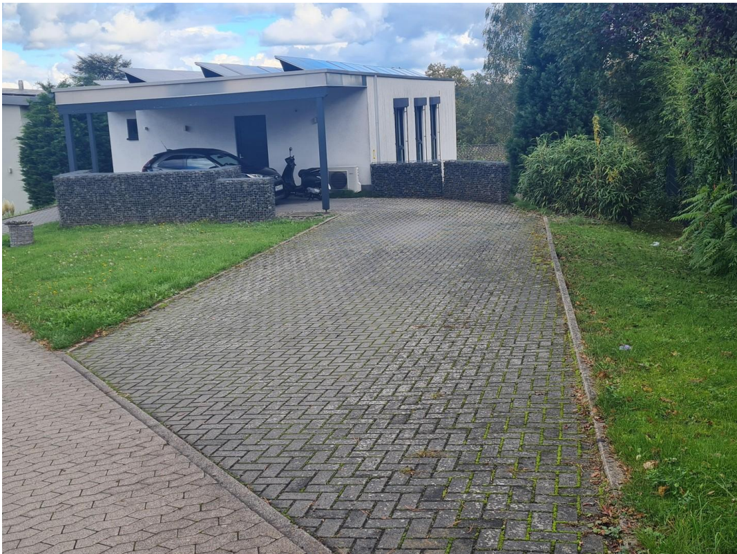
Straßenansicht & Stellplätze