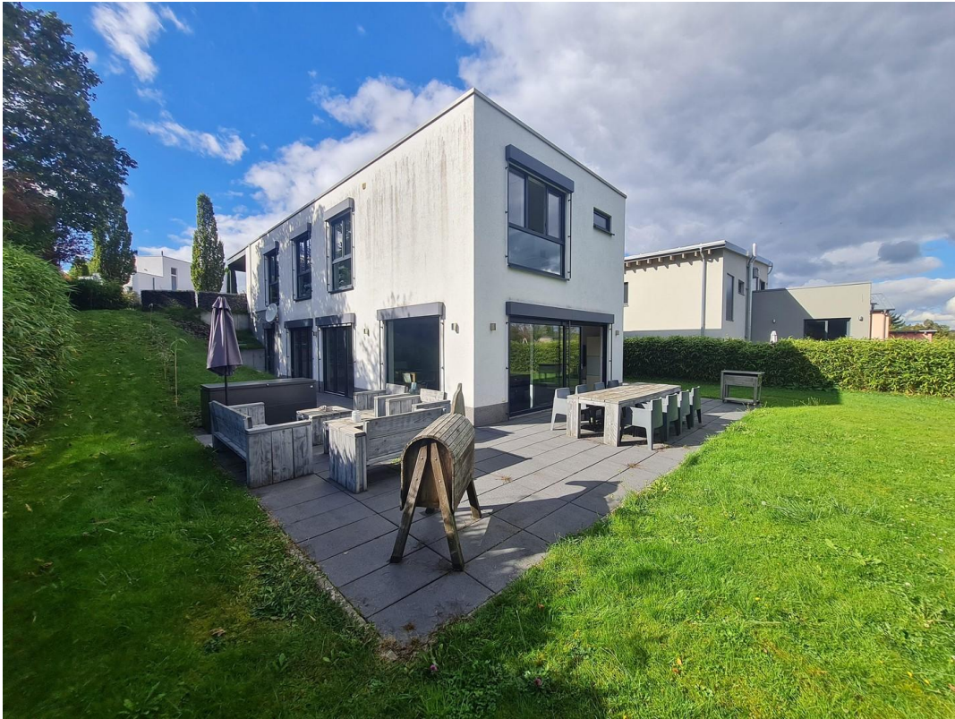
Rückansicht & Terrasse