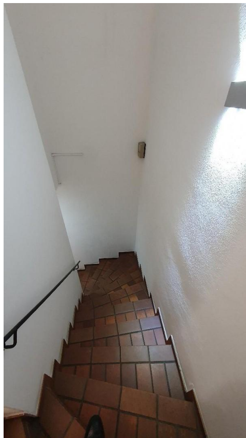
Innen liegende Treppe