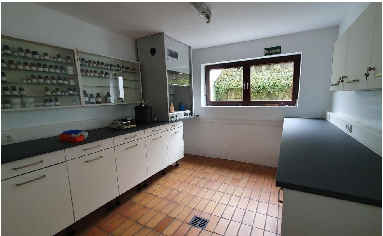
Kellerraum mit Tageslicht