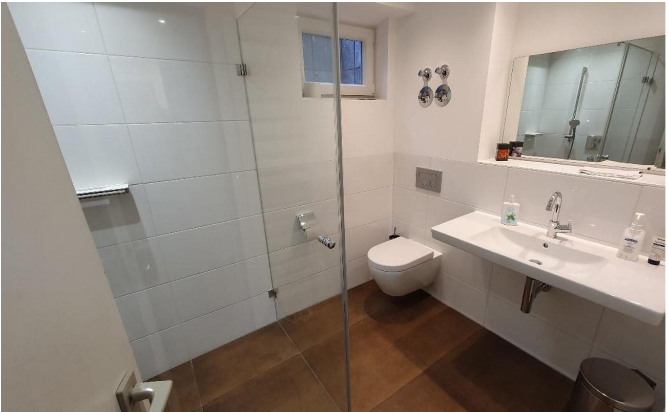
Duschbad im Keller