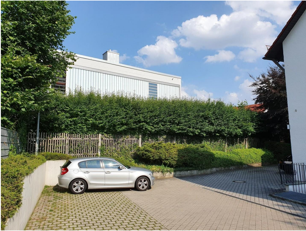
Parkplatz am Haus