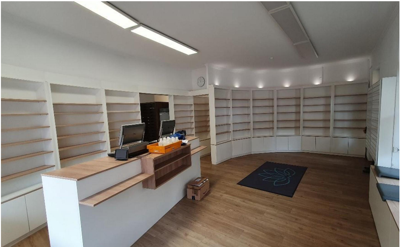
Laden vom Fenster