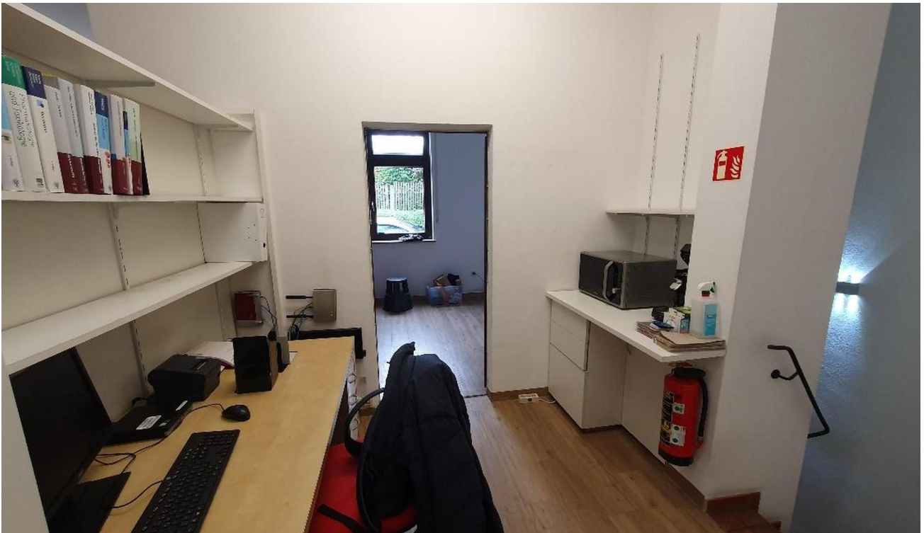
Laden mit Kellerabgang