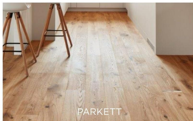
Parkett & Fliesen