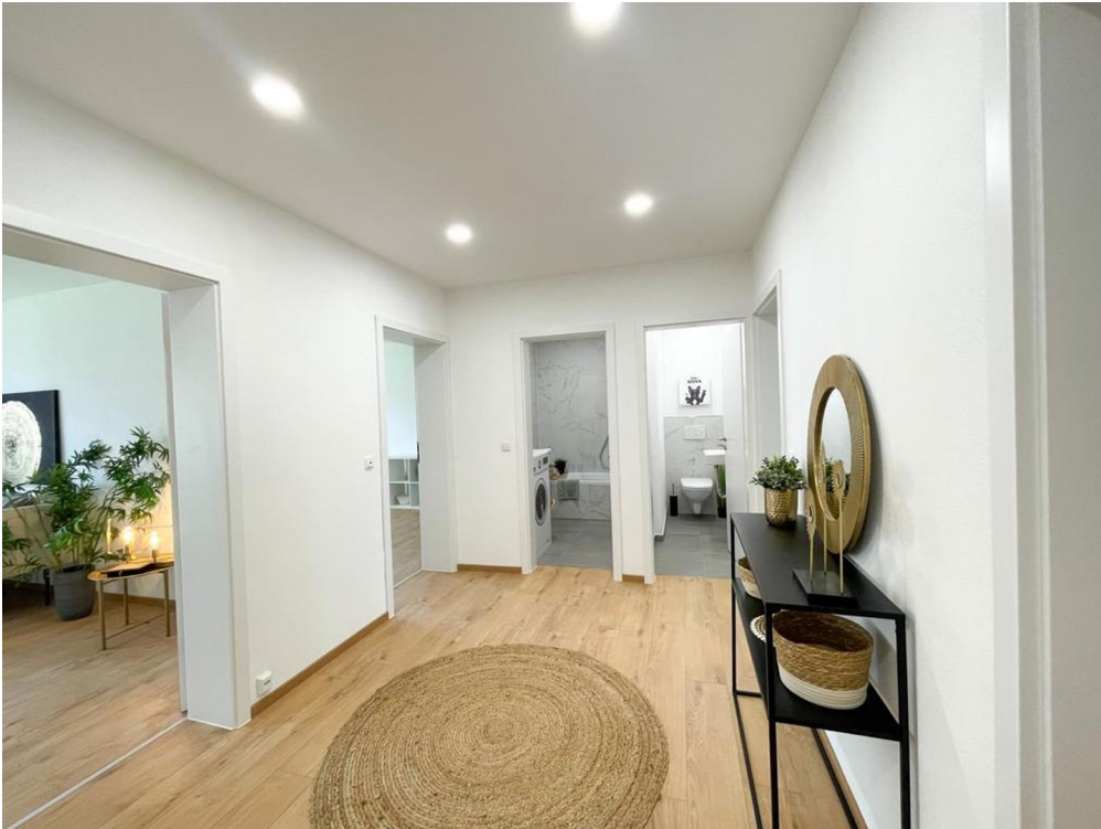
Flur / Eingangsbereich