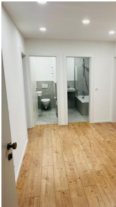
Flur / Eingangsbereich