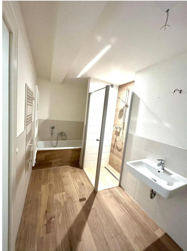
Bad mit Wanne & Dusche