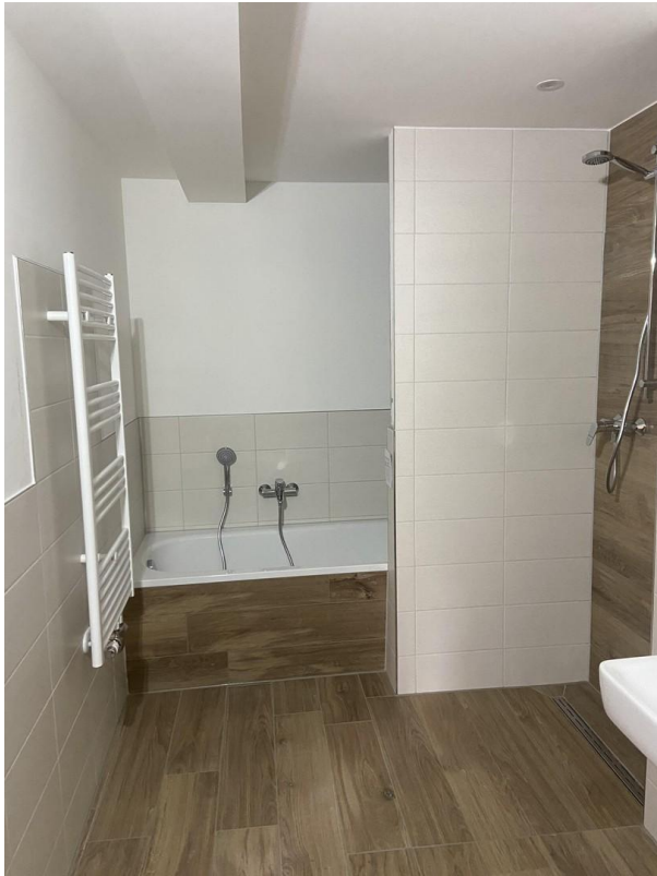
Bad mit Dusche & Wanne