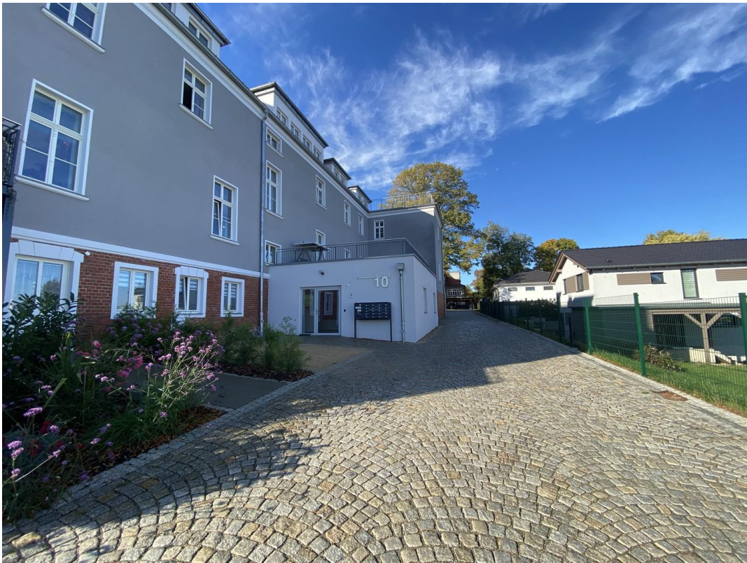
Titelbild - Eingangsbereich