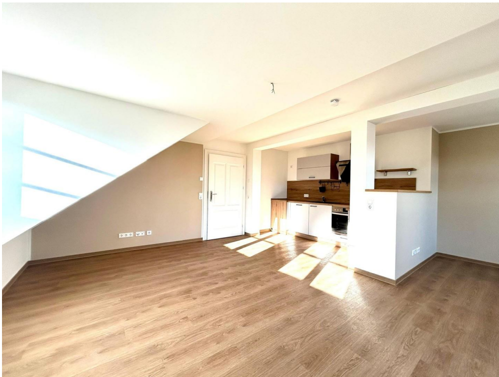
Wohnzimmer & Küche mit EBK