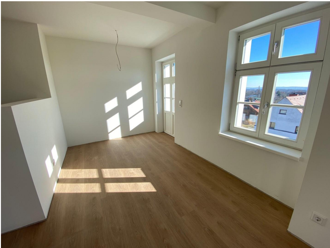
Wohnzimmer mit BLK