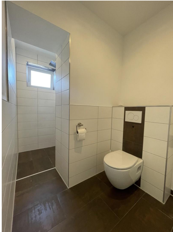
Badezimmer mit Dusche