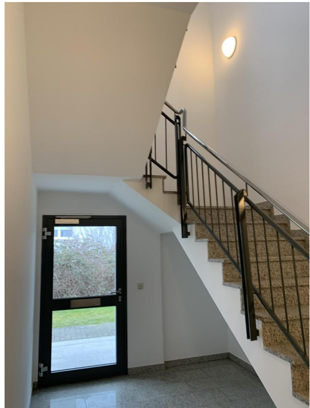
Hauseingang - Treppenhaus