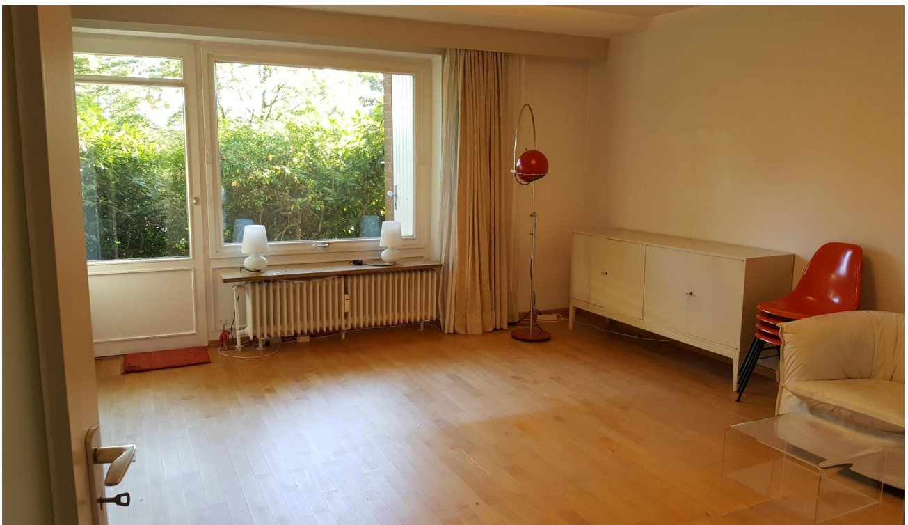
Zimmer im EG