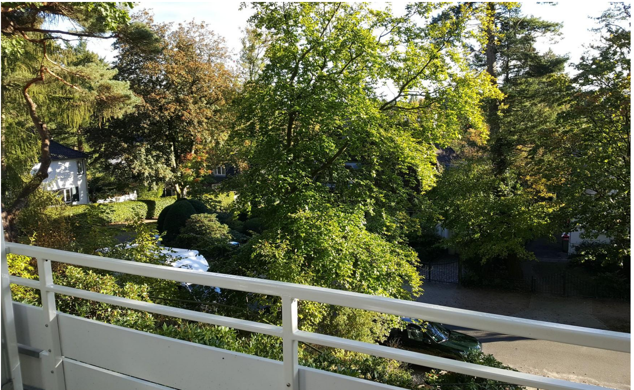
Blick vom Balkon