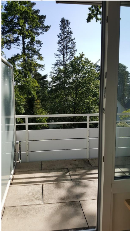
Blick nach Süden