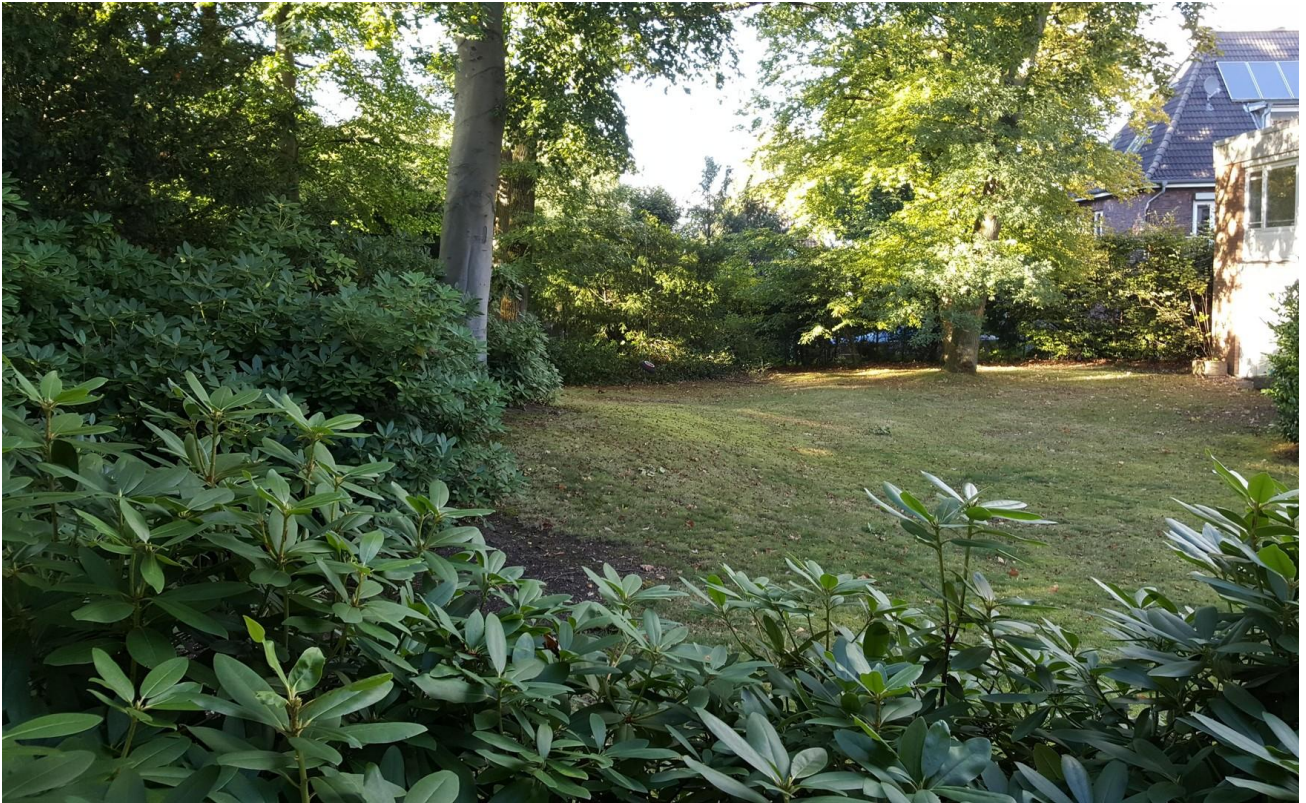
Blick aus dem Arbeitszimmer