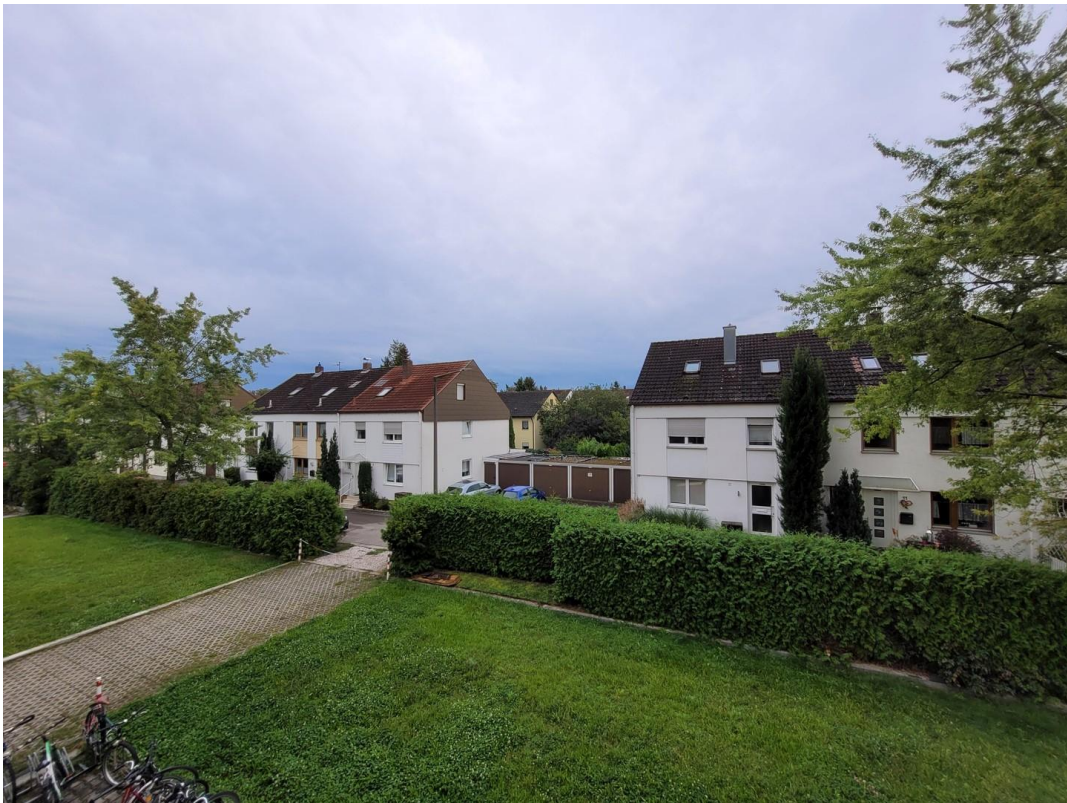
Ausblick vom Südbalkon