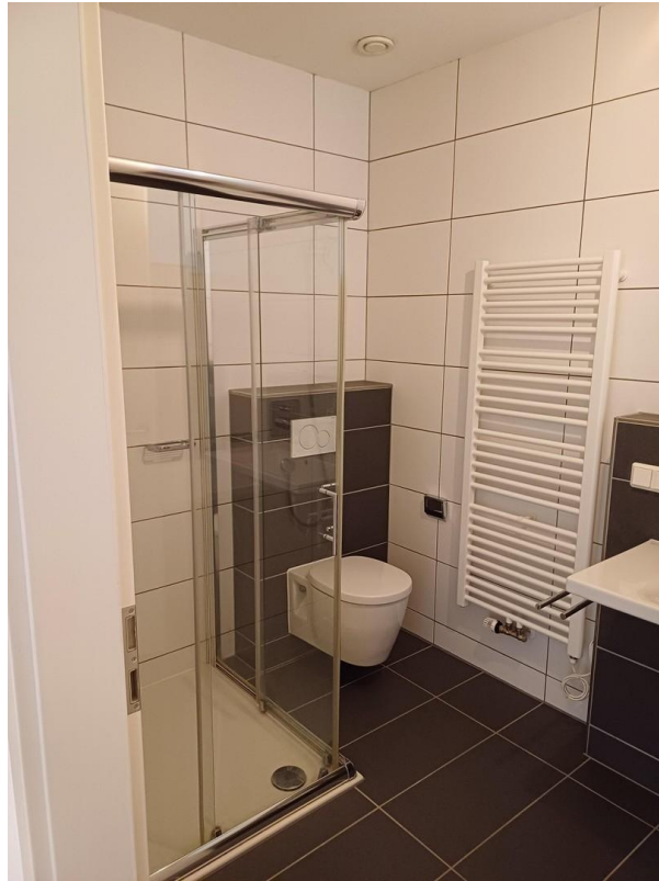
Bad - Dusche