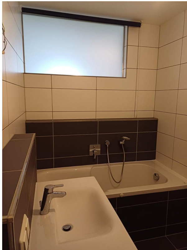
Bad - Wanne