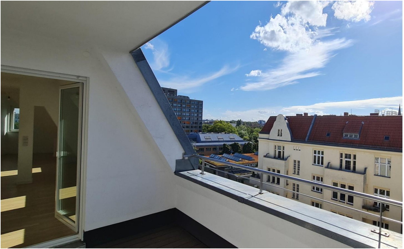
Blick von der Dachterrasse 2