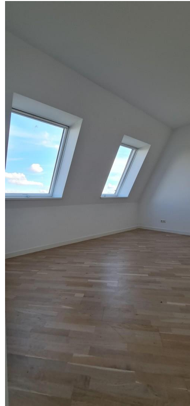
Büro / Kinderzimmer