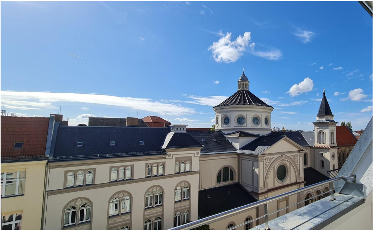
Blick von der Dachterrasse 2