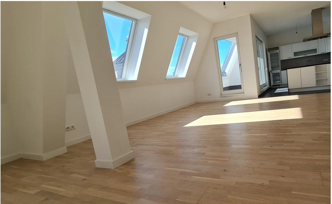
Blick zur Küche