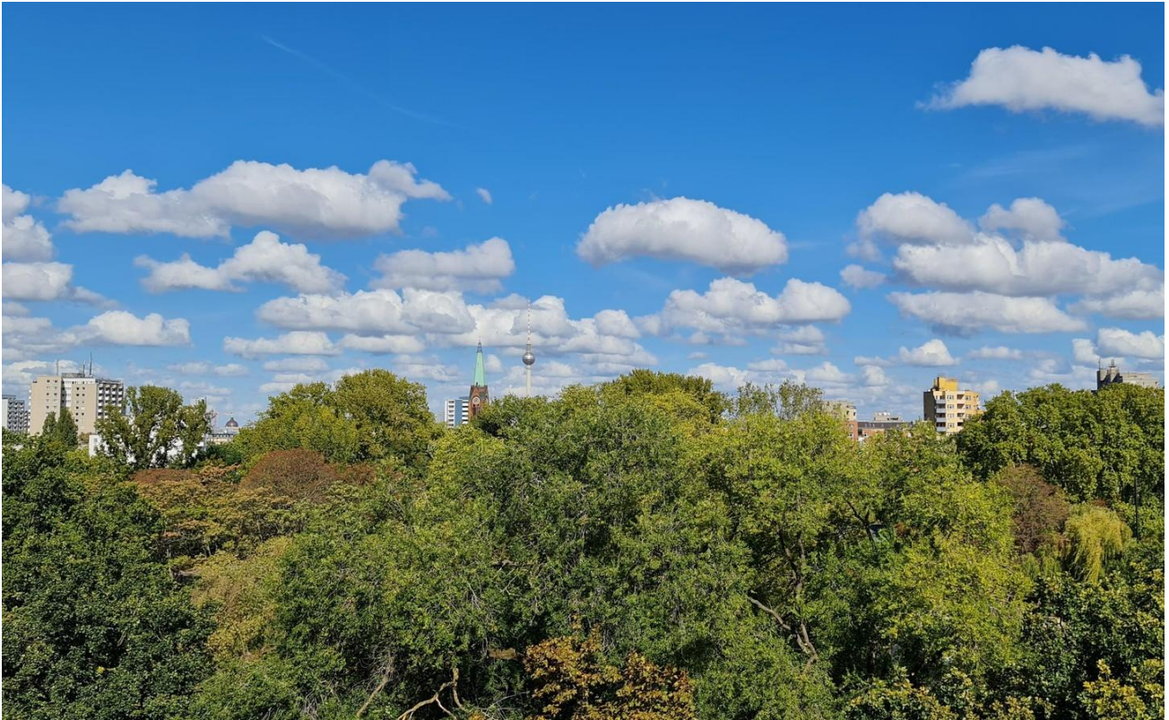
Blick von der Dachterrasse 1