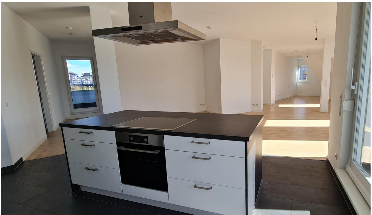
Blick in den Wohnraum