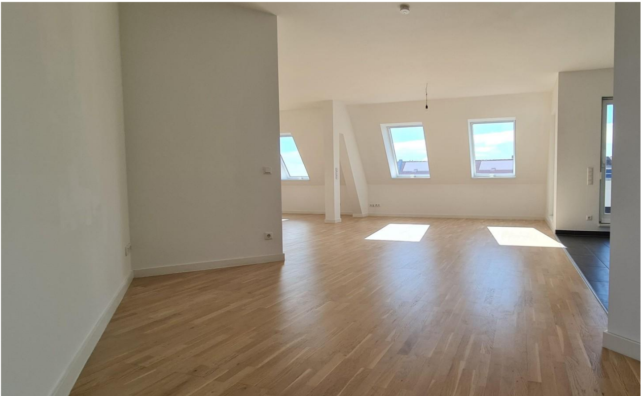
Blick in den Wohnraum