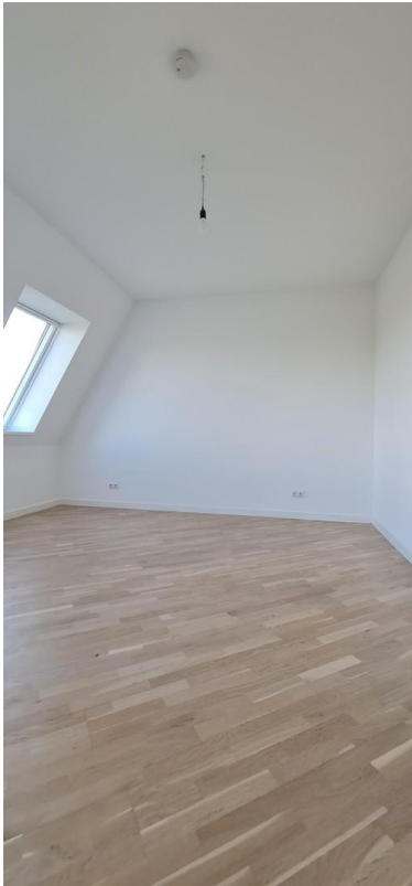
Büro / Kinderzimmer