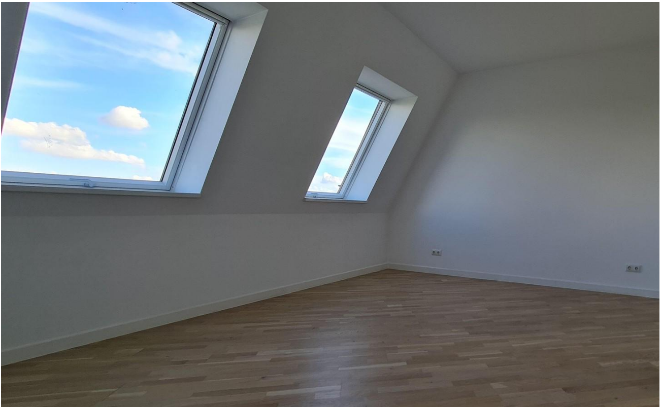
Büro / Kinderzimmer