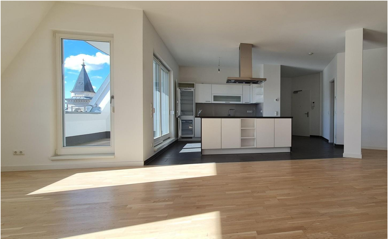
Blick zur Küche