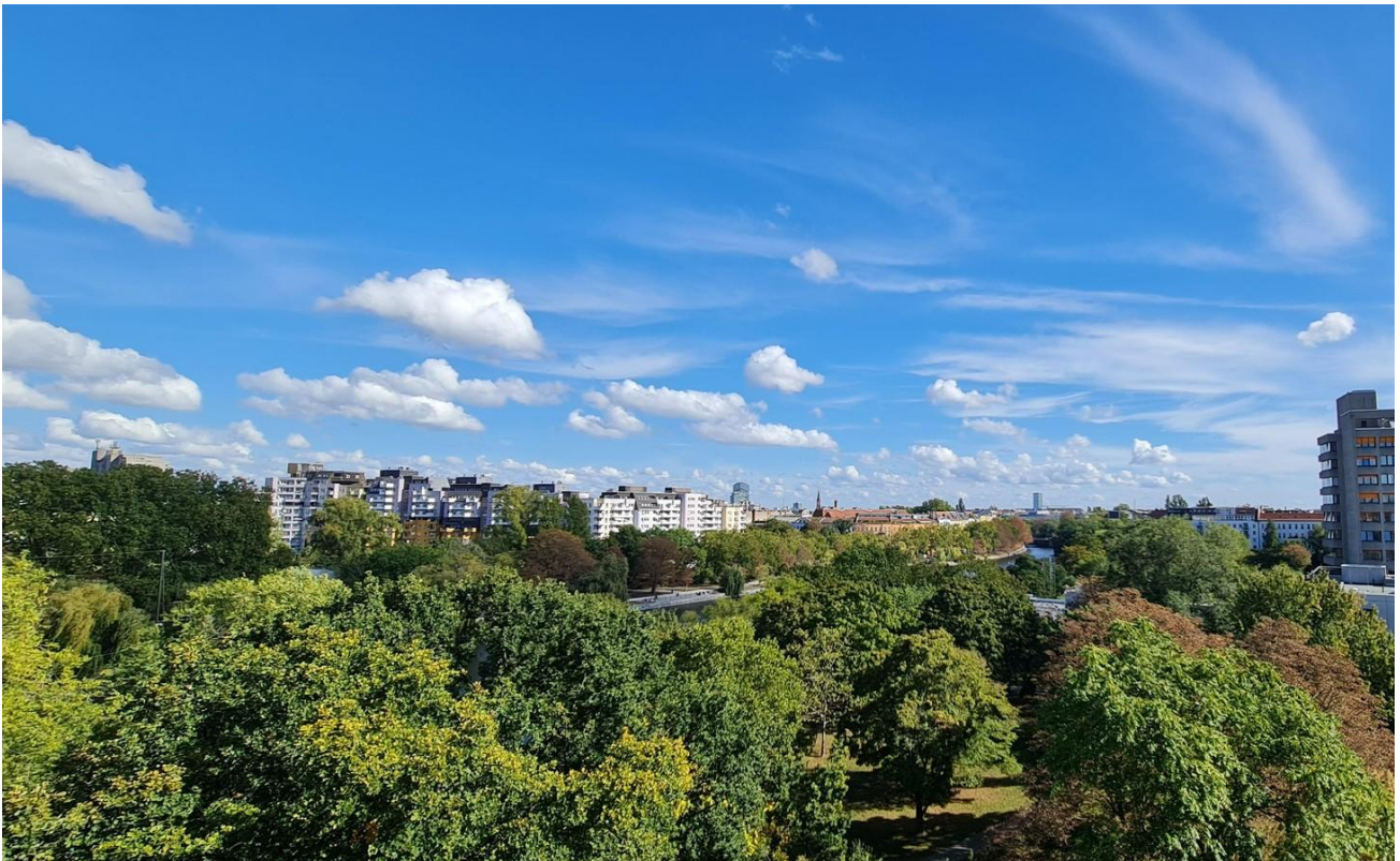
Blick von der Dachterrasse 1