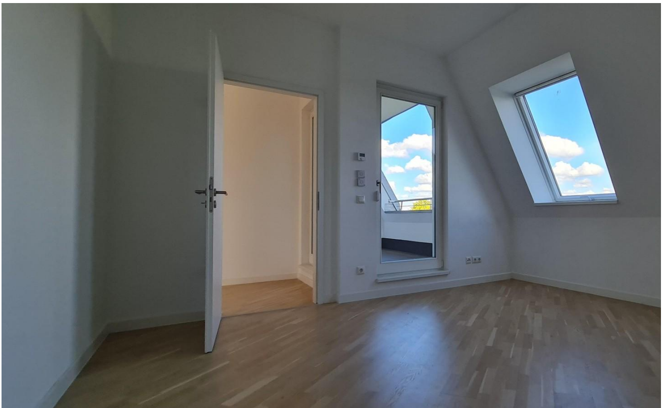
Büro / Kinderzimmer