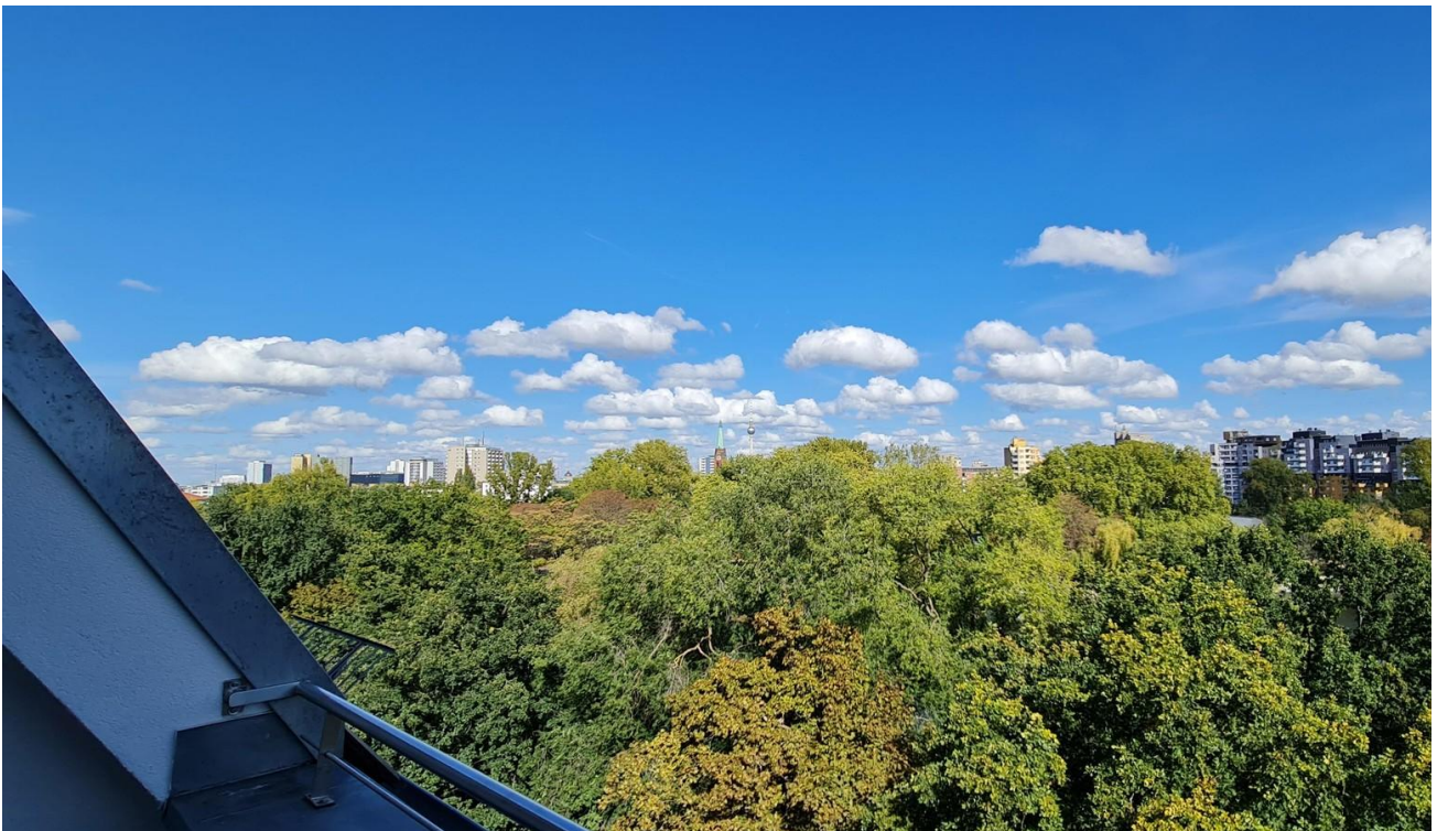
Blick von der Dachterrasse 1