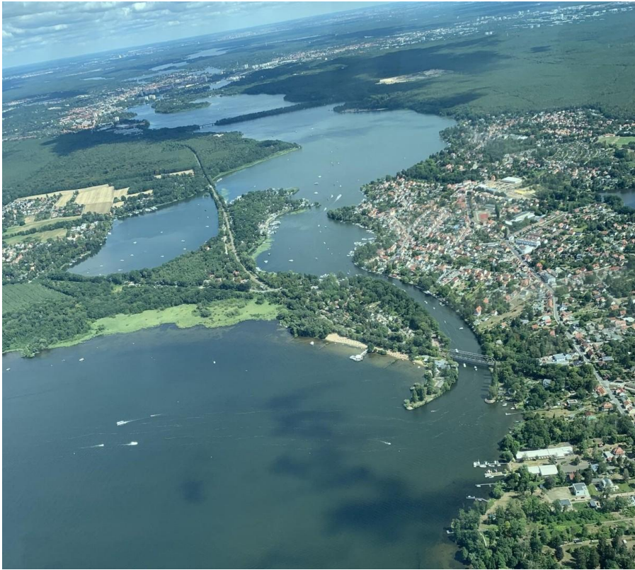
Aus der Luft!