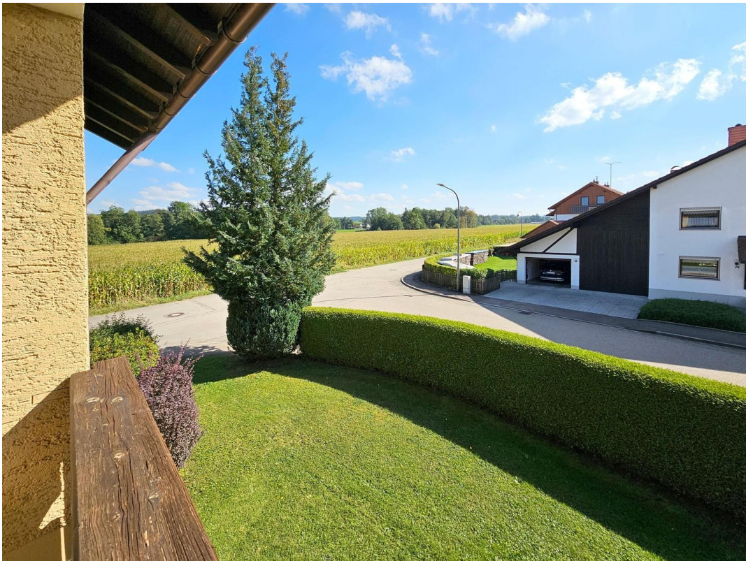
Ausblick vom Balkon