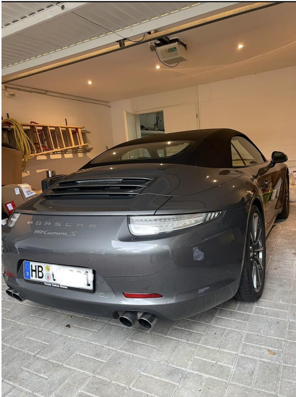
Doppelgarage ca. 30 m 2