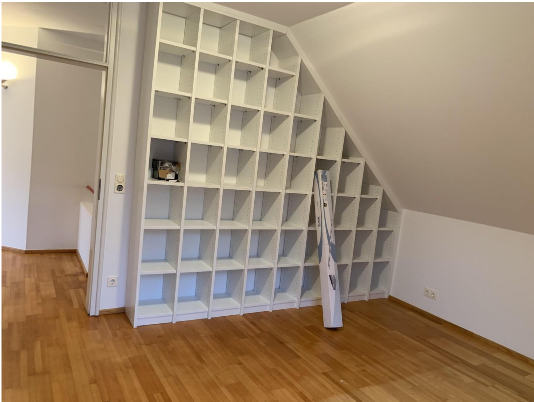
OG Schlafzimmer 4