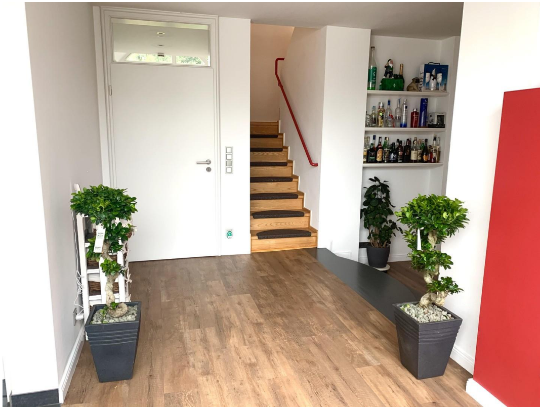
Treppe ins OG