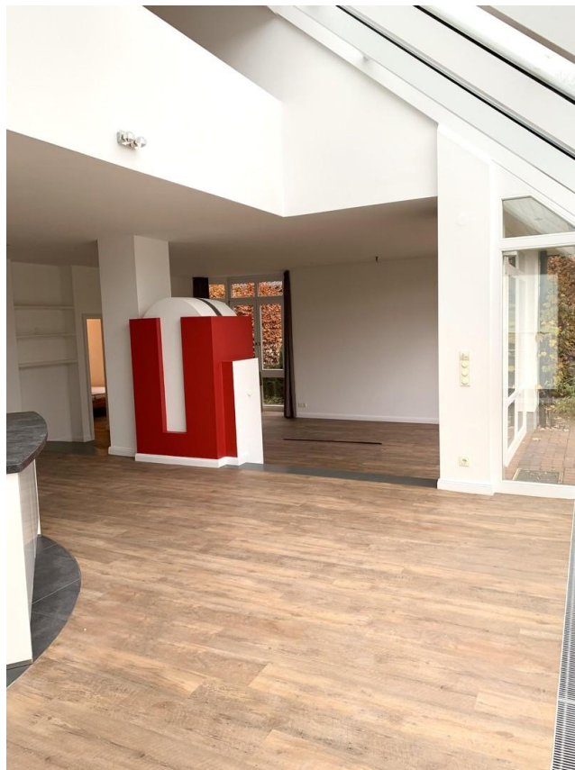
Wohnbereich ohne Möbel