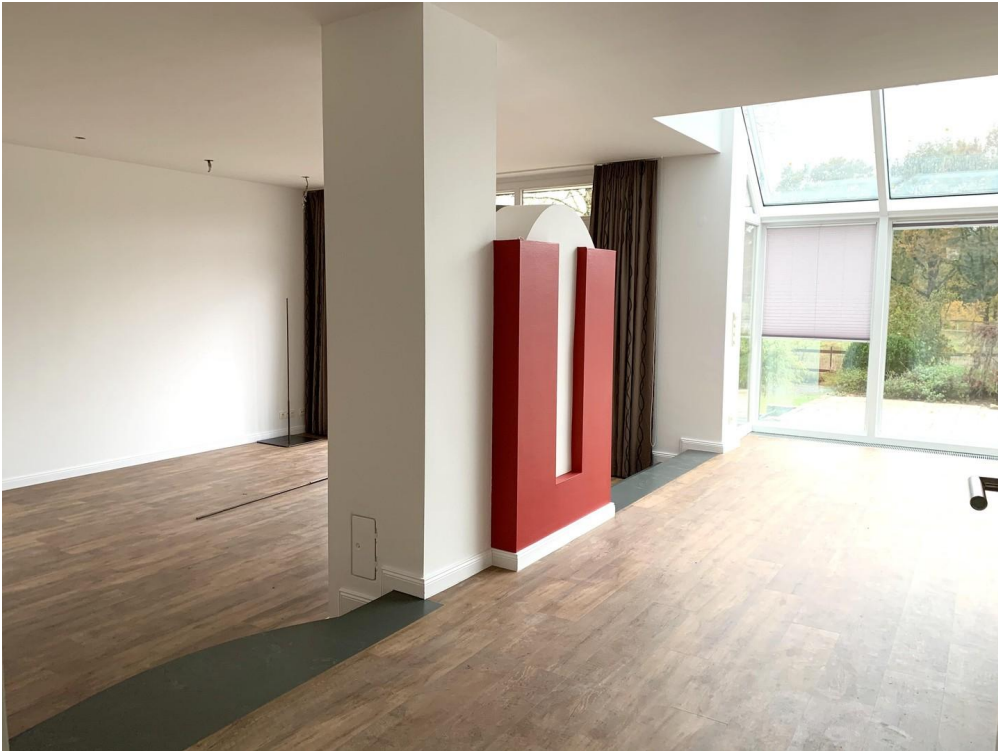
Wohnbereich ohne Möbel