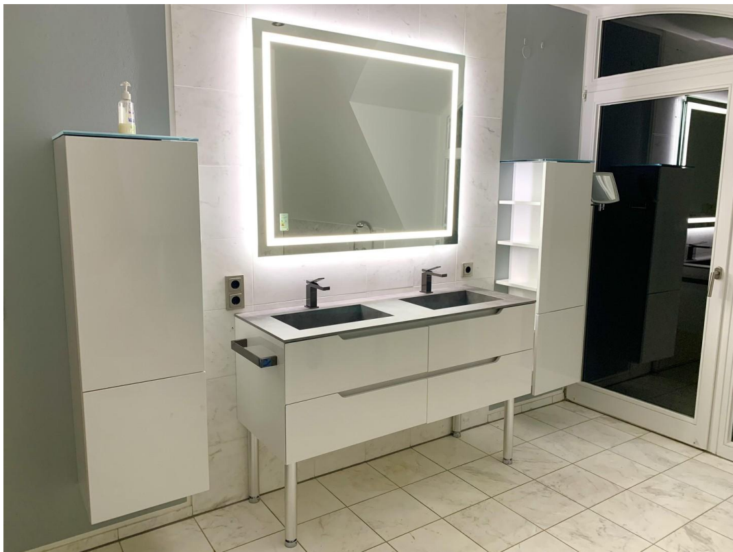
OG Hauptbad ital. Waschtisch