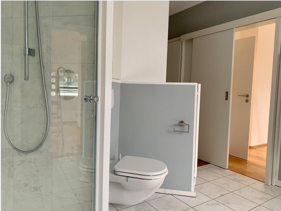
OG Hauptbad Dusche