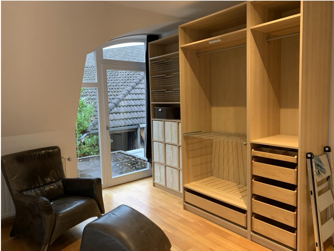
OG Schlafzimmer 3