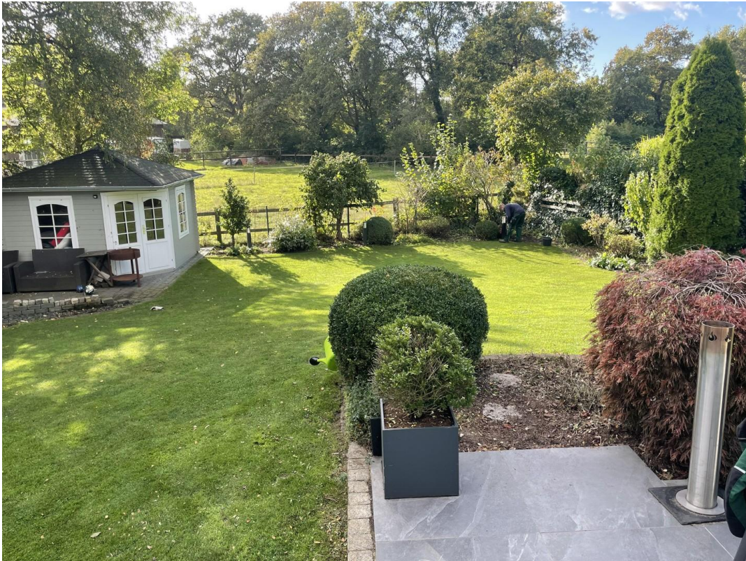
Blick von Terrasse