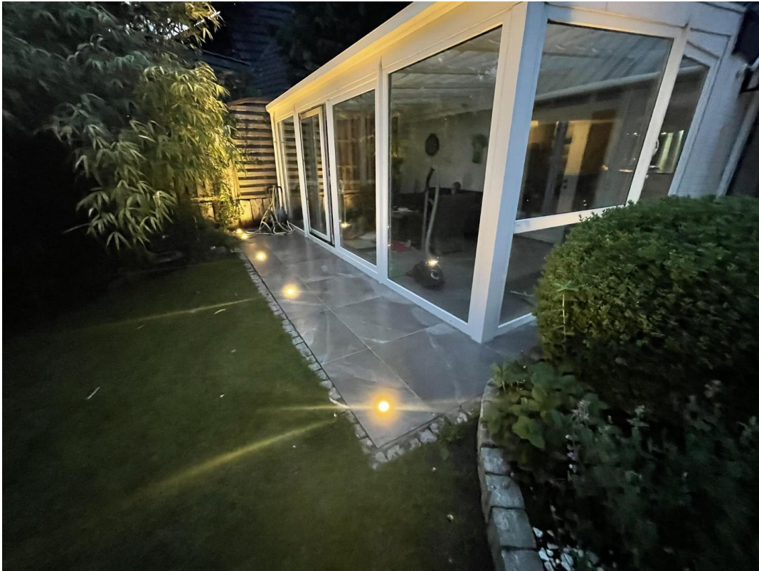
Wintergarten am Abend