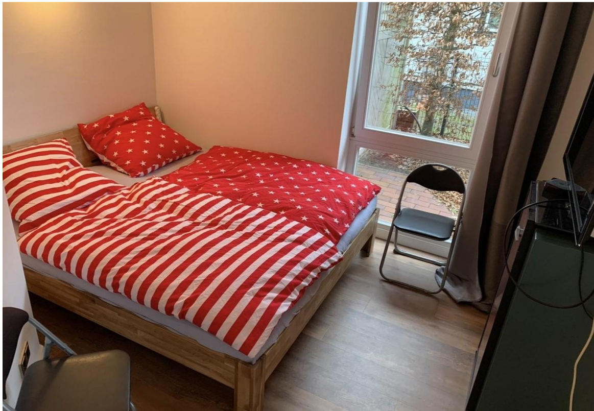
EG Schlafzimmer 1