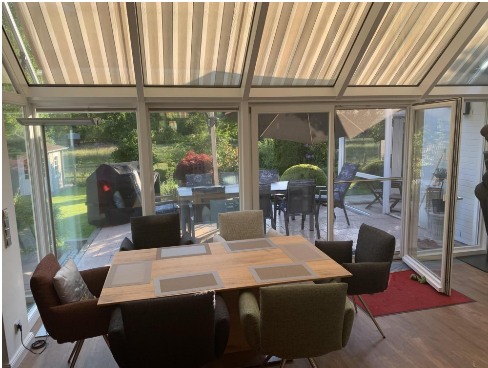
Essbereich mit Sonnenschutz