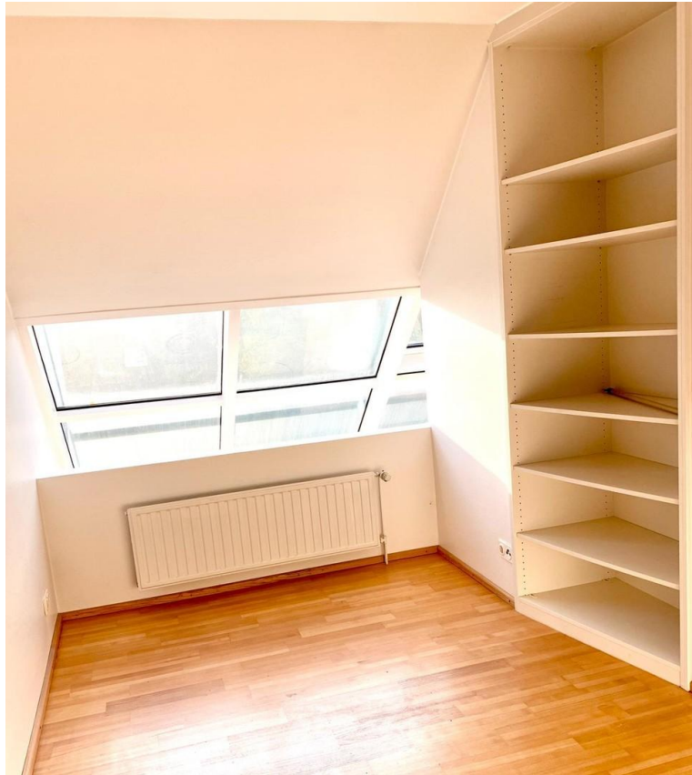
OG Galerie (z.B. Arbeitsplatz)