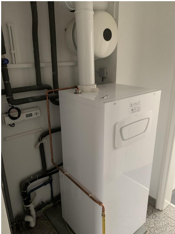
Heizungsanlage 2018 (HWS)