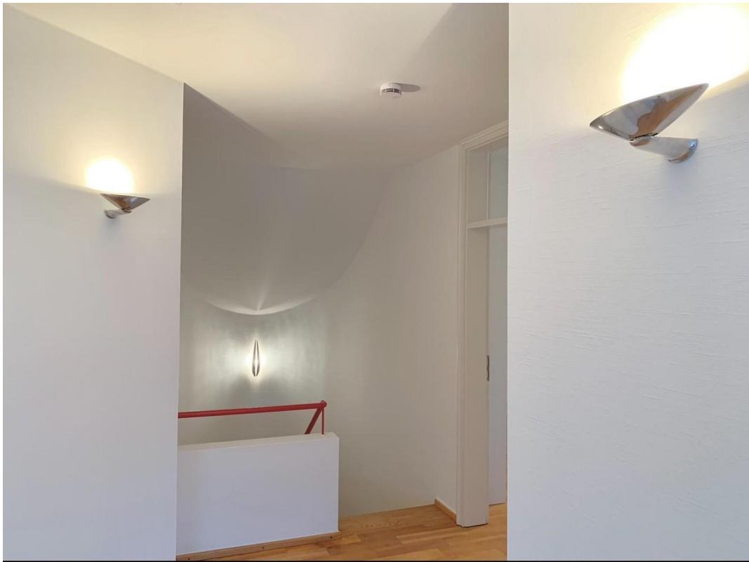
OG Flur Galerie