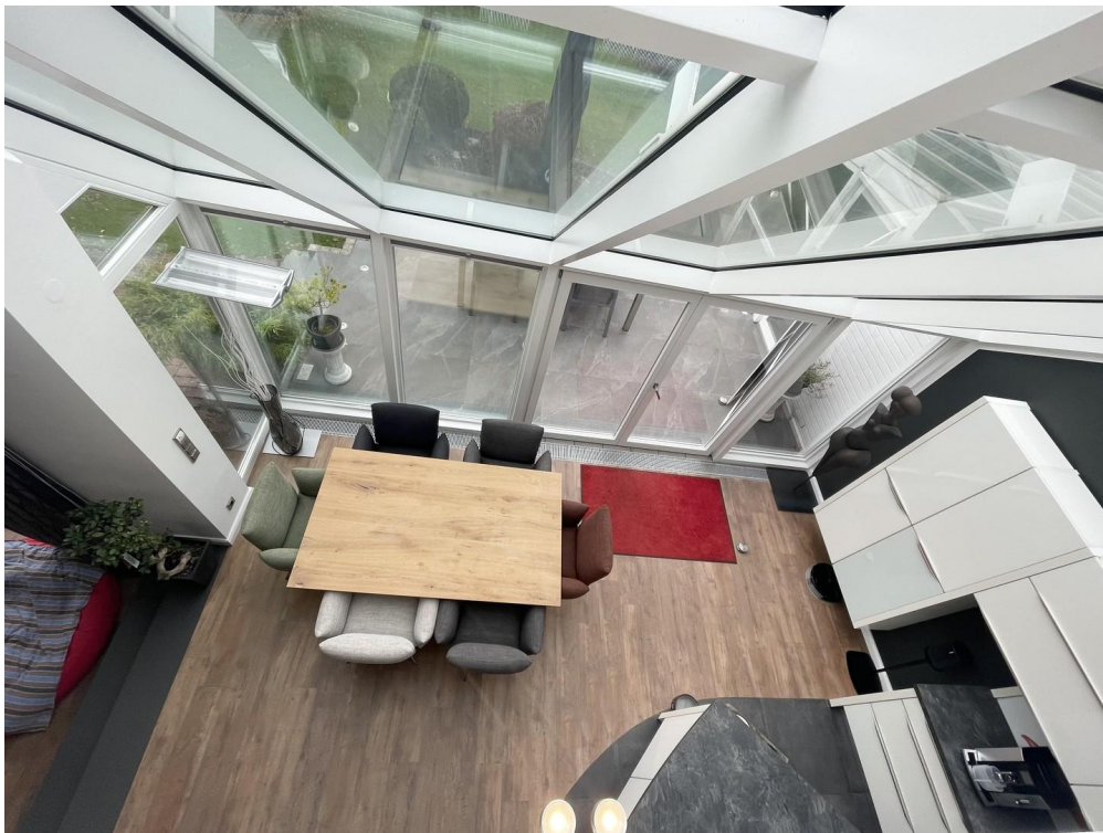
Blick von Galerie