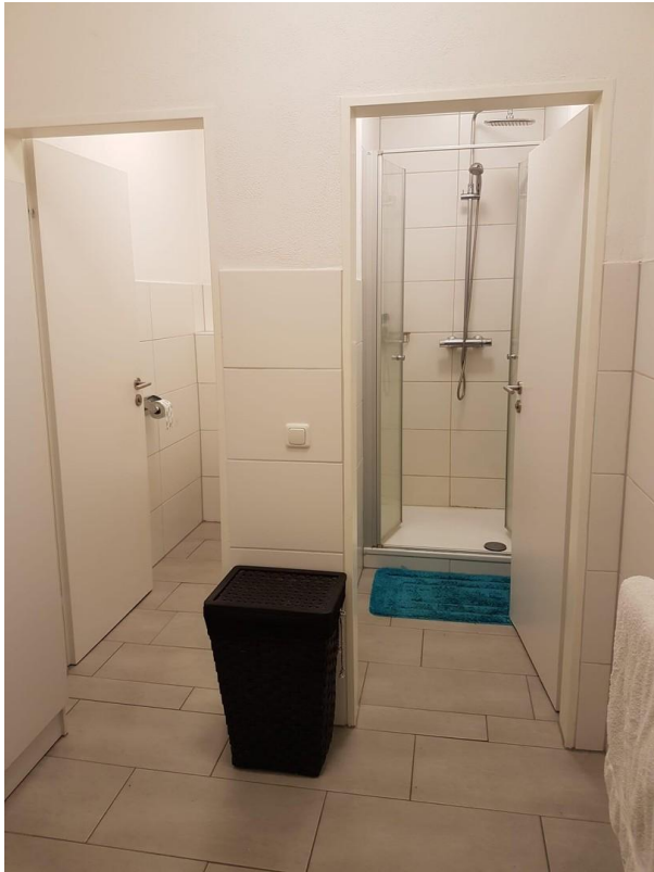
Waschraum/Toilette 3+ Dusche