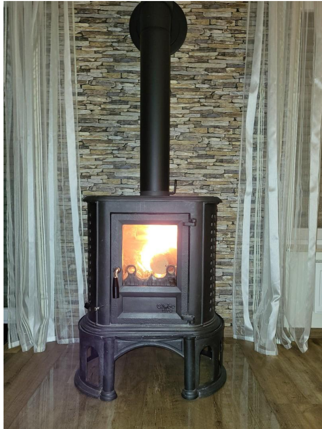
EG: Kaminofen im Wohnzimmer