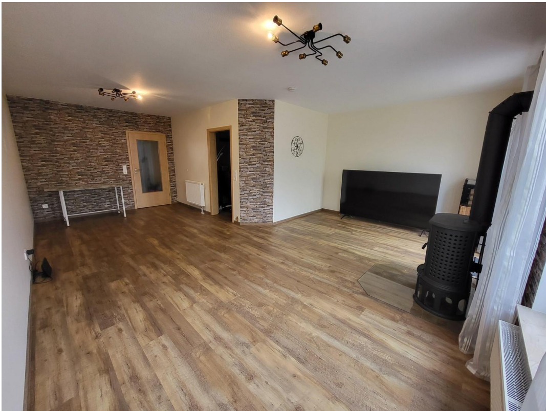
EG: Esszimmer und Wohnzimmer