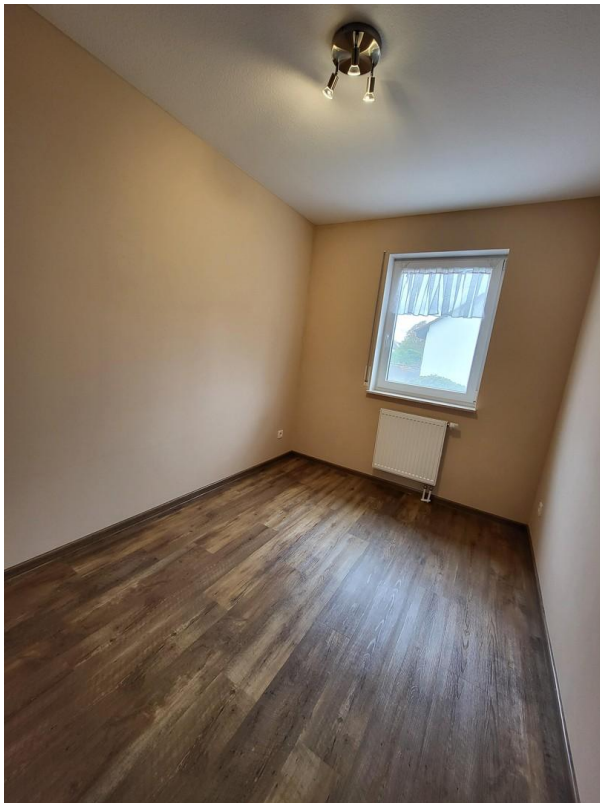
OG: 3. Schlafzimmer