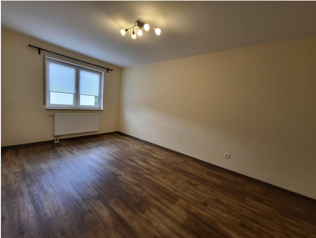
OG: 2. Schlafzimmer