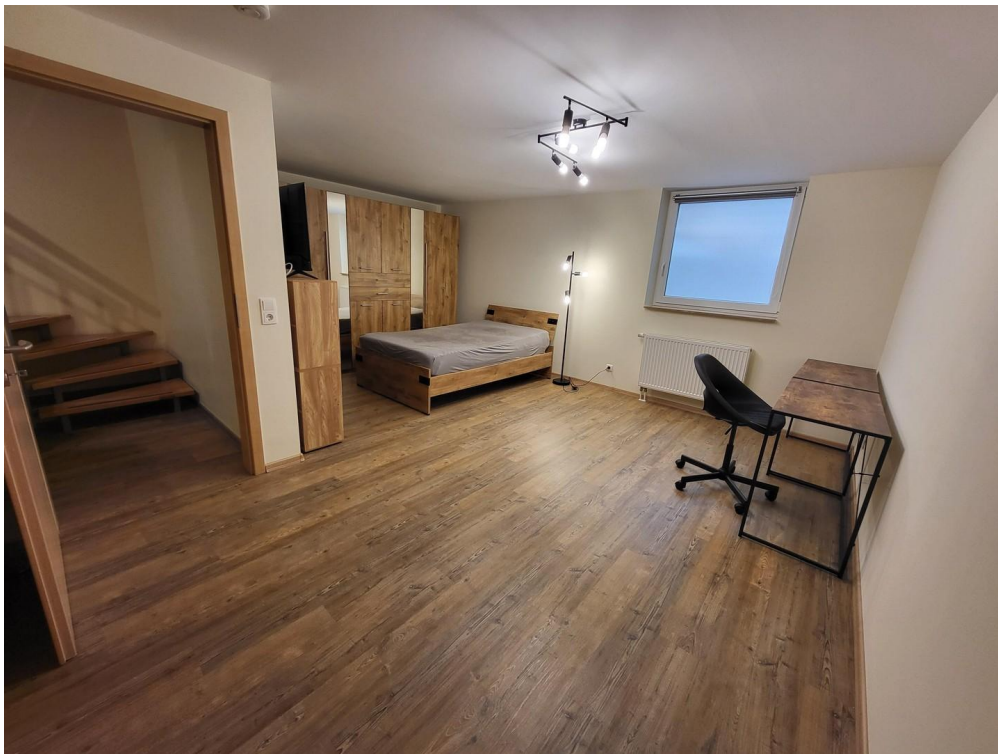
UG: riesiges Schlafzimmer