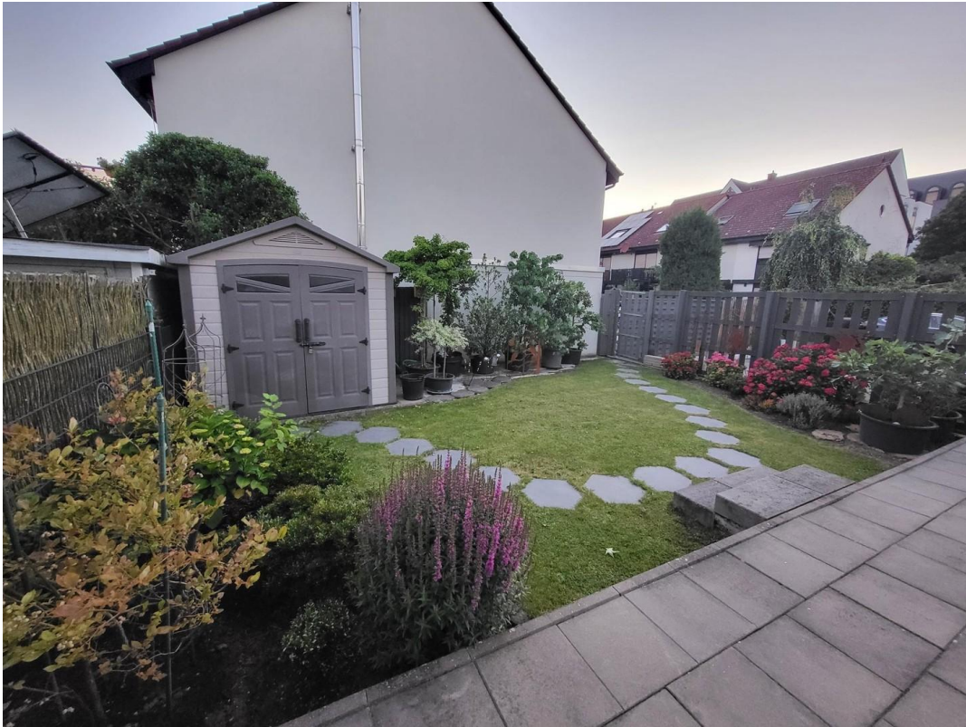
Garten mit Privatweg