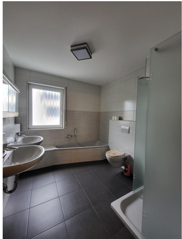
OG: großes Bad