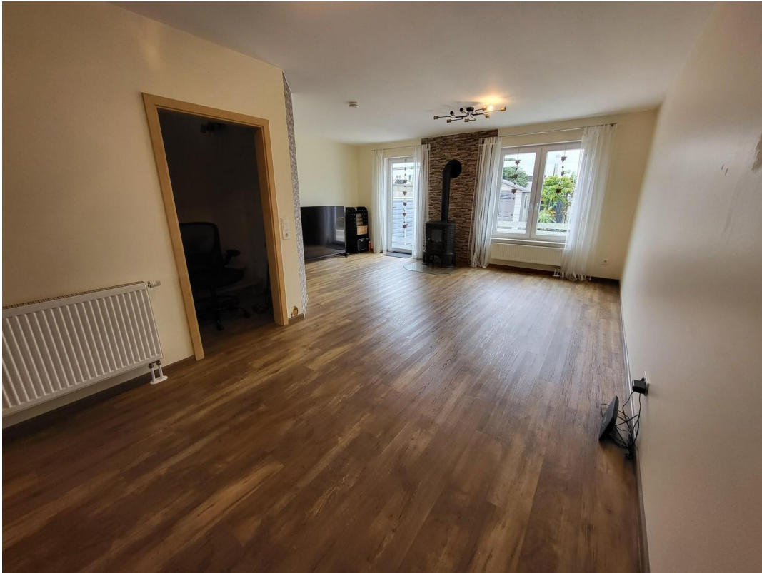
EG: Esszimmer und Wohnzimmer