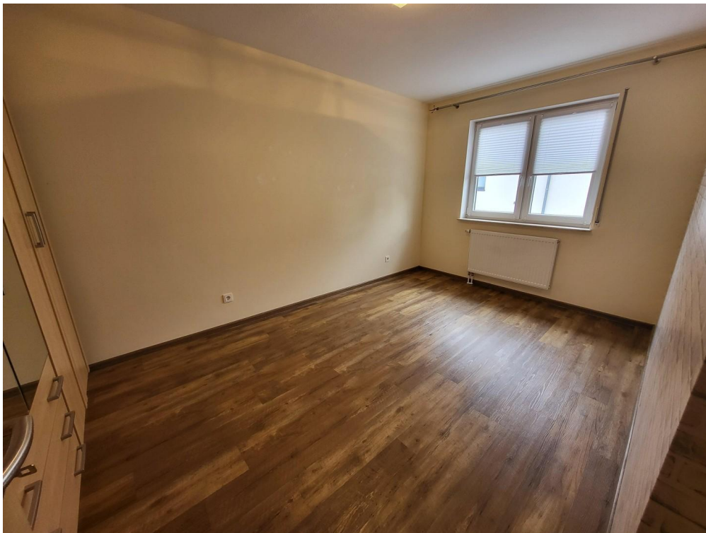
OG: 1. Schlafzimmer