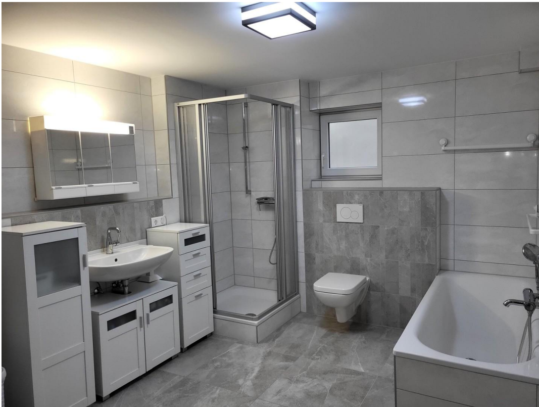
UG: großes Bad