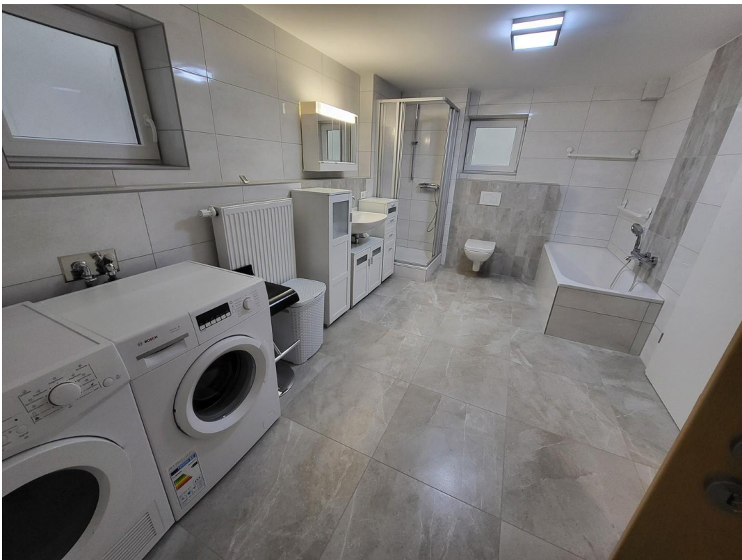
UG: großes Bad mit Waschmasch.