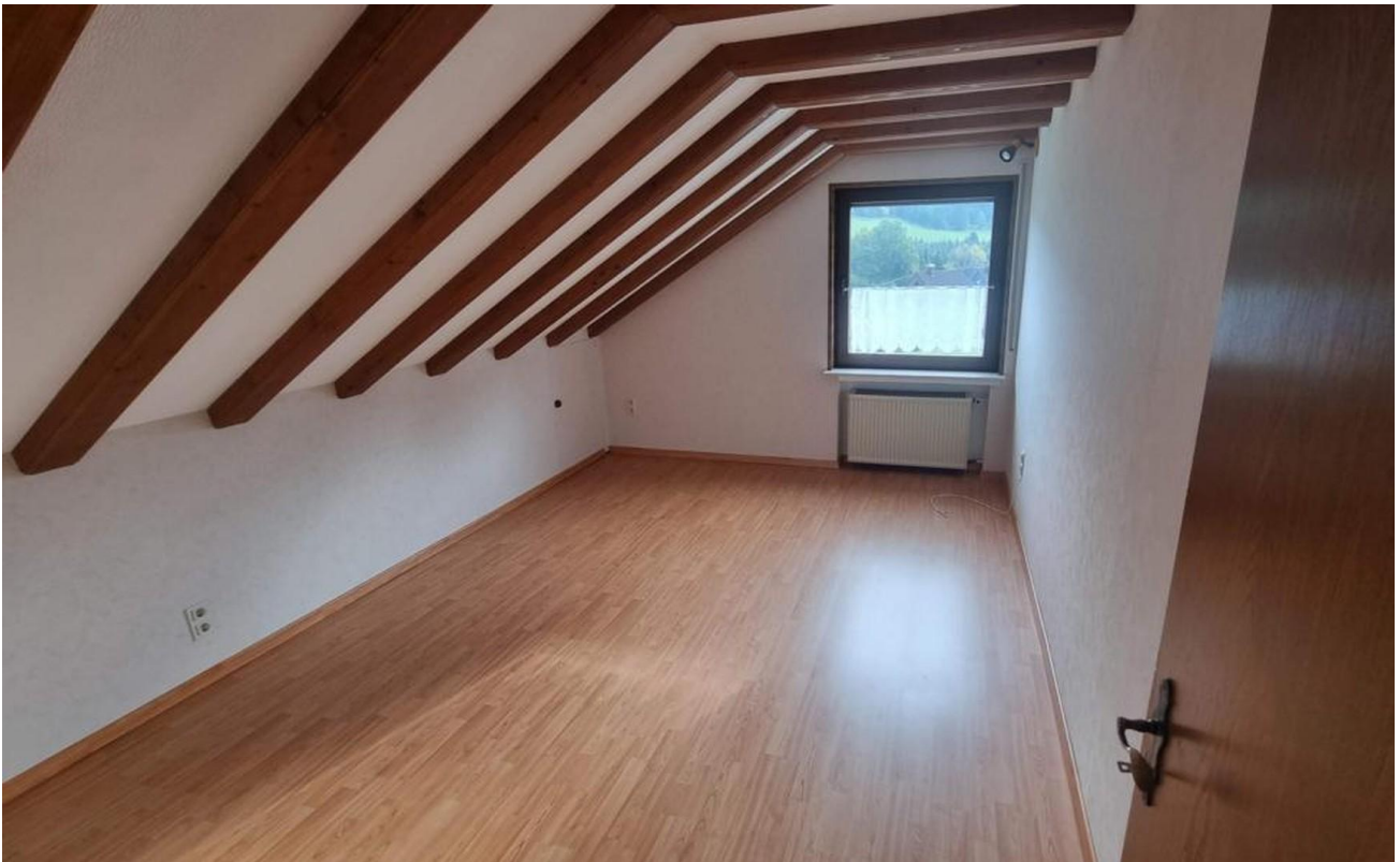
Schlafen/Kind 2 OG