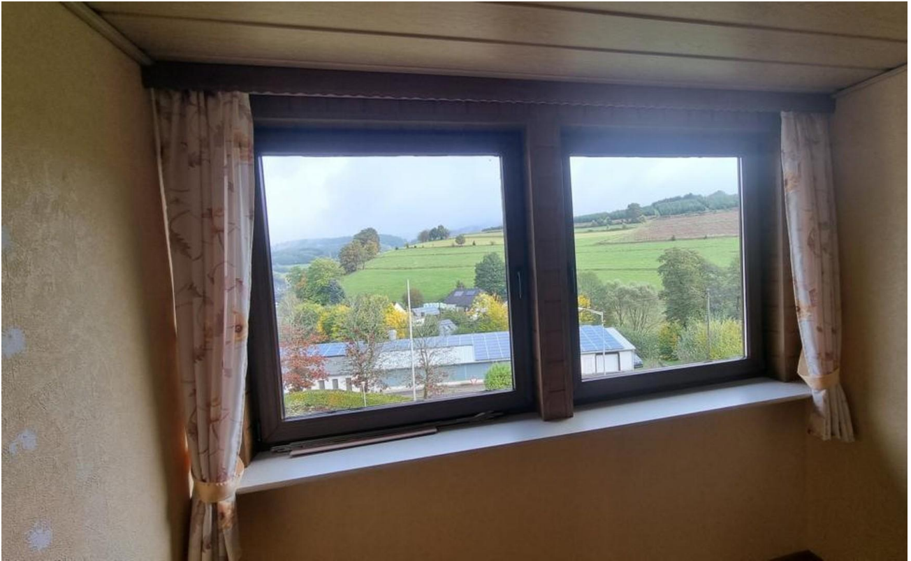
Aussicht Gaube OG