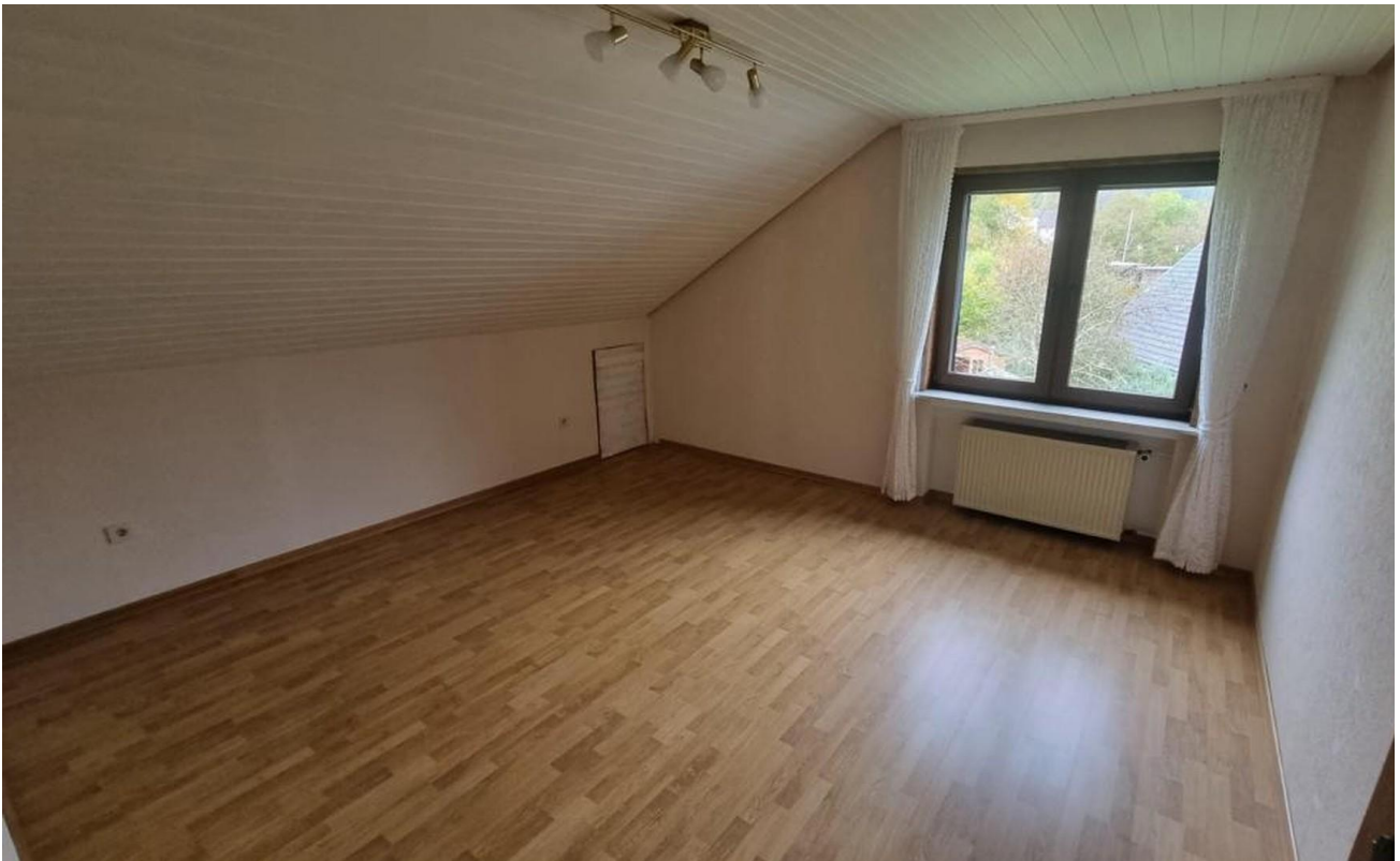
Schlafen/Kind 1 OG