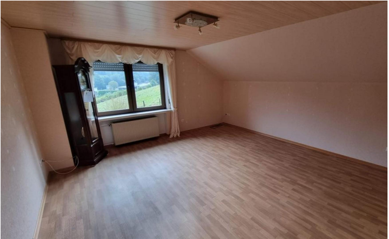
Schlafen/Kind 3 OG