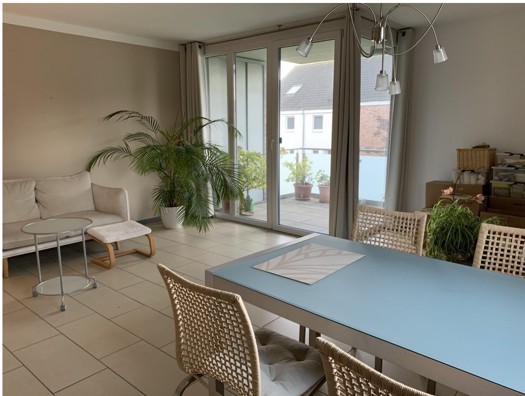
Ess- und Wohnbereich