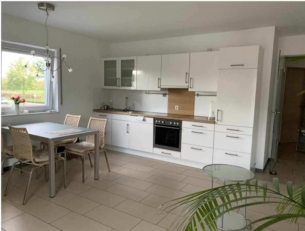
Koch- und Essbereich