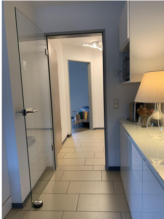
Flur zum Wohnbereich