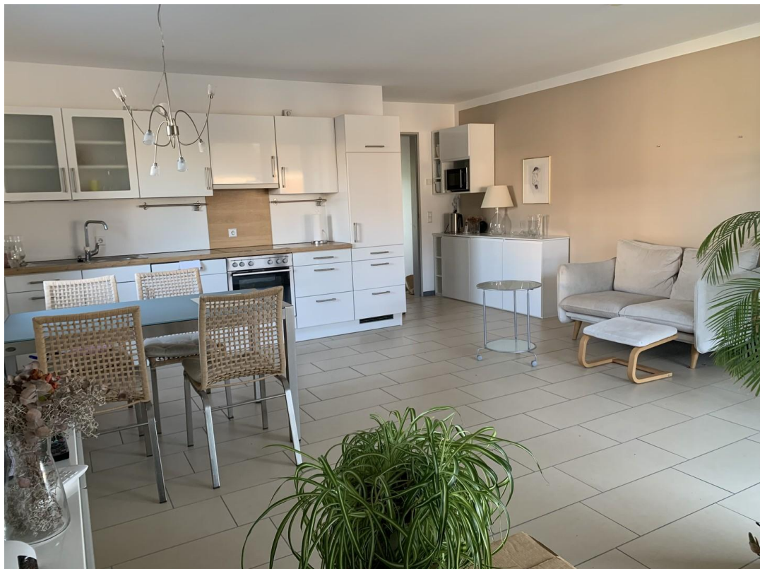
Koch- / Ess- und Wohnbereich