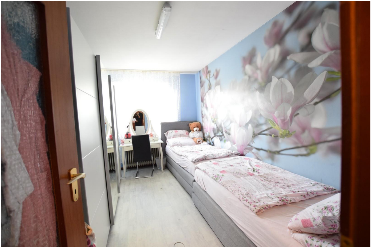
Kind / Arbeiten