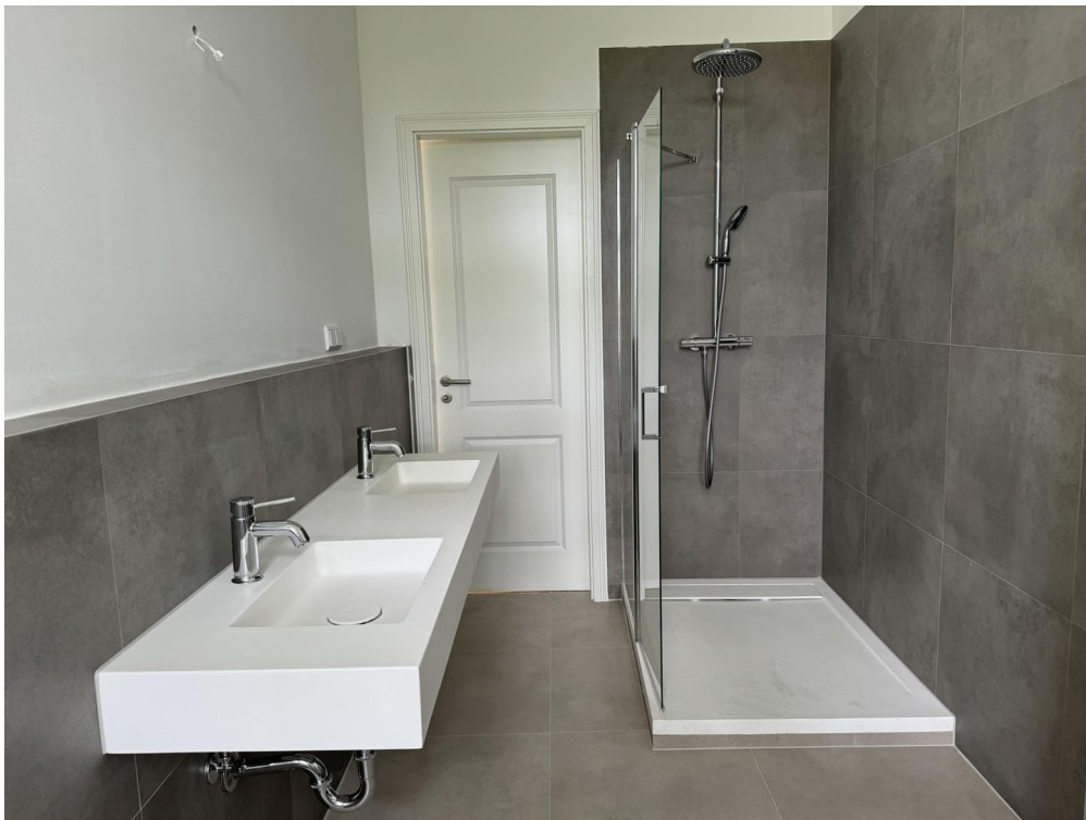
Beispielfoto für 2. Badezimmer