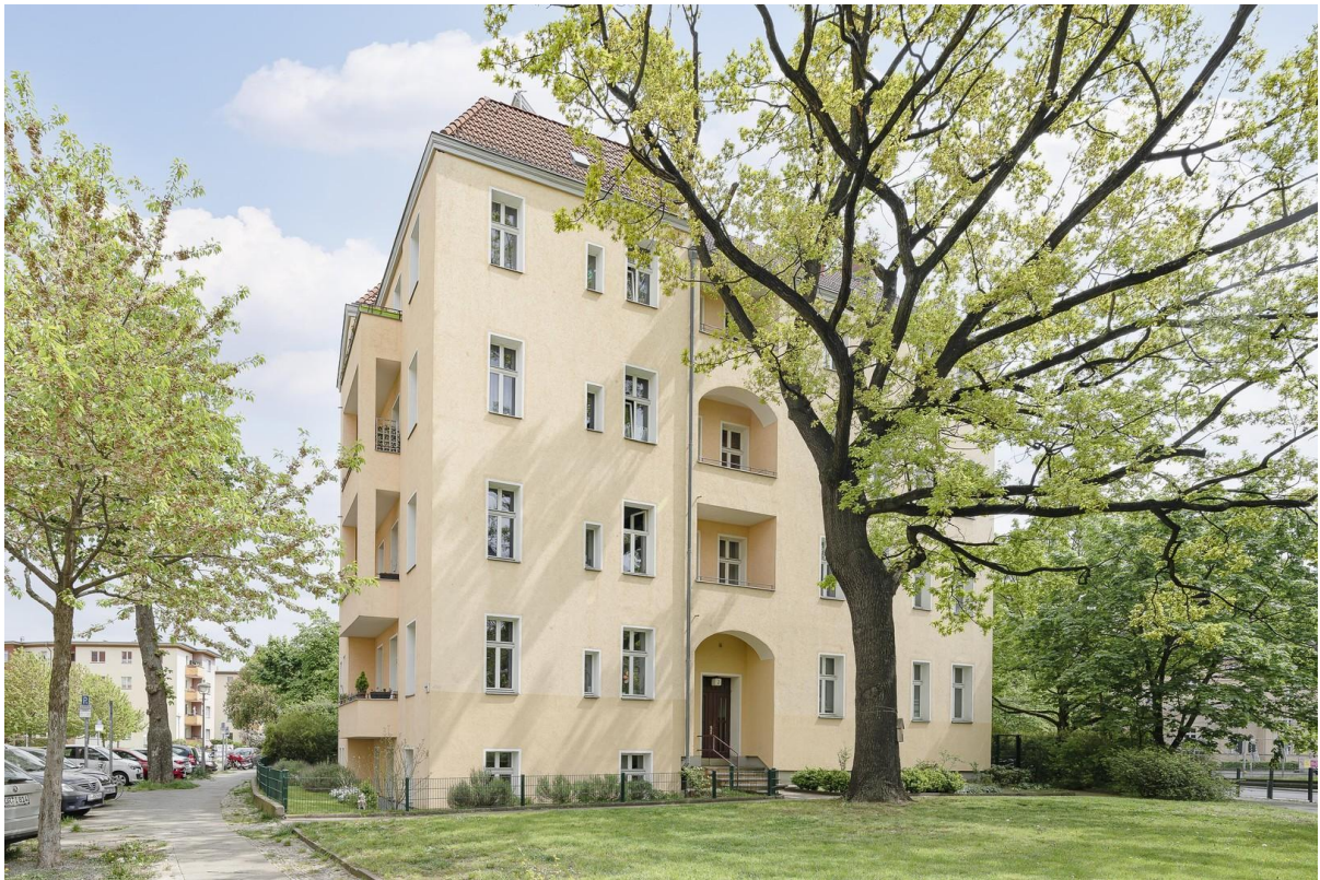
Haus von außen