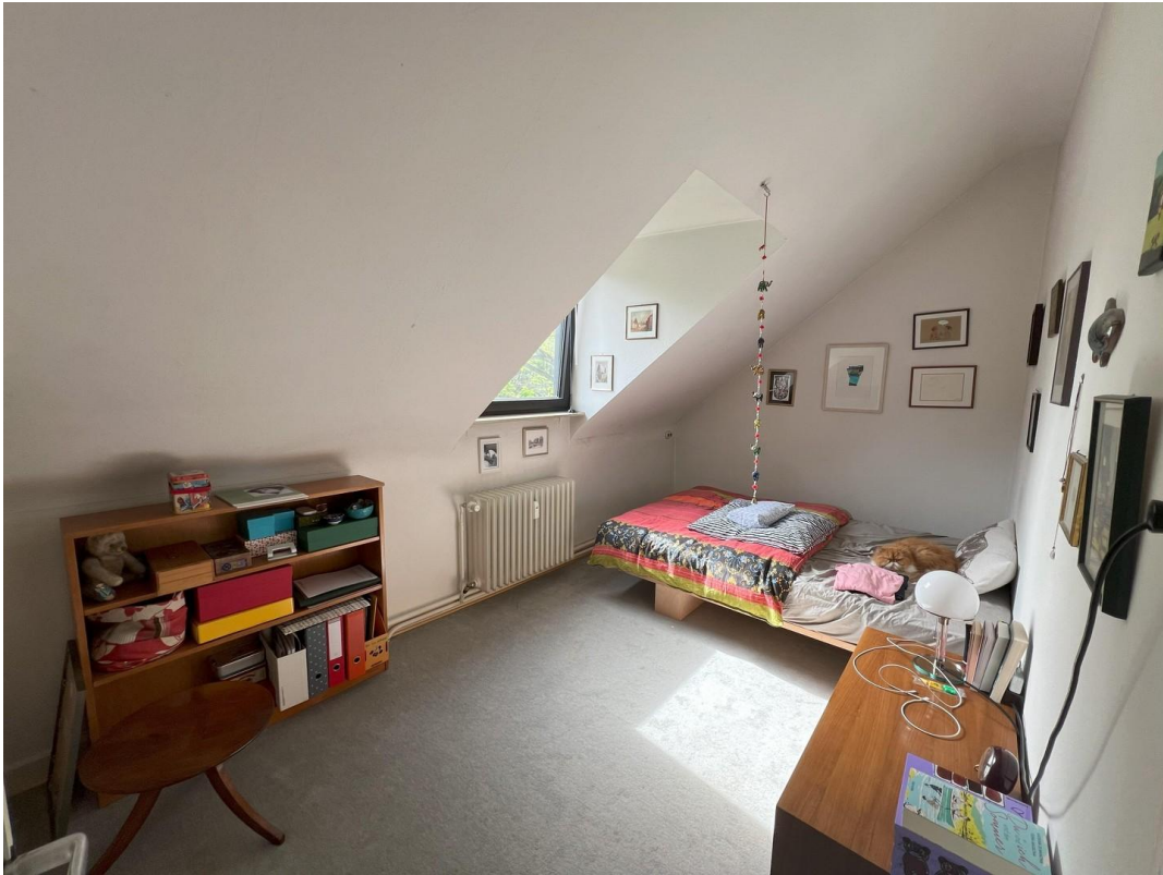
Zimmer 3 Schlafbereich