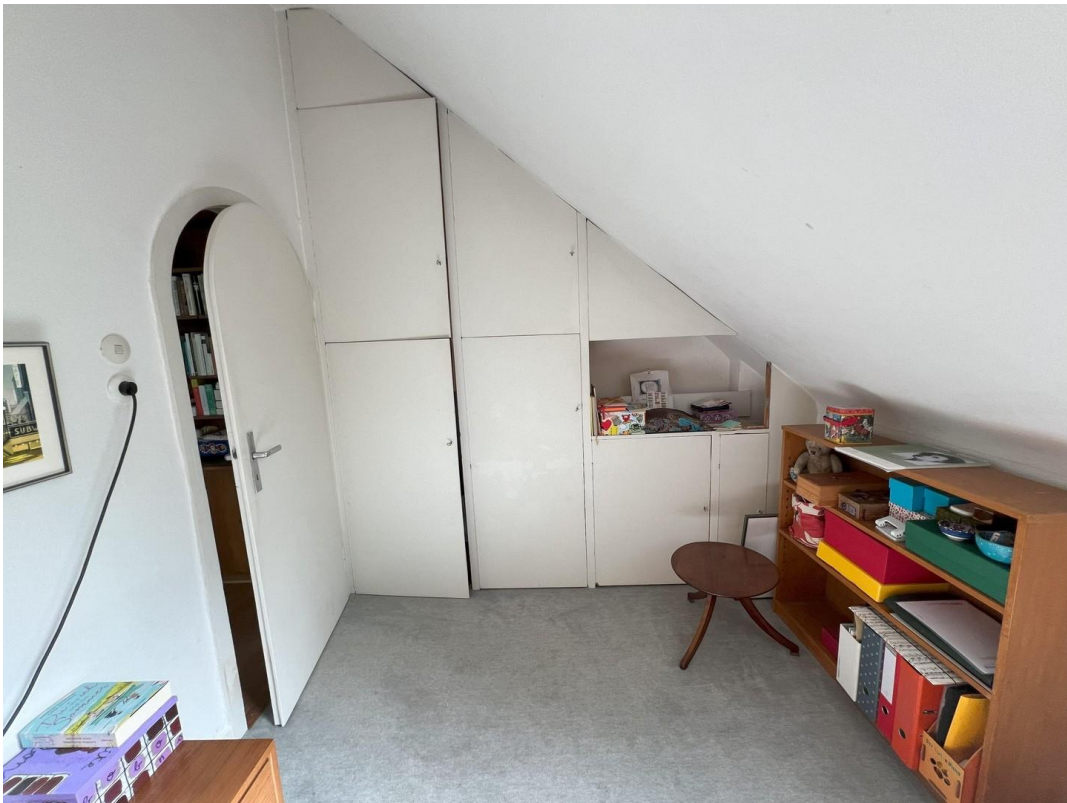
Zimmer 3 Wandschrank