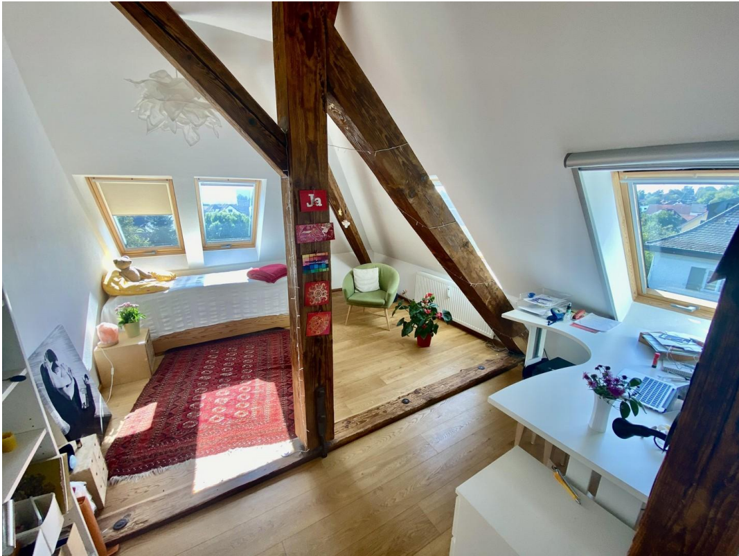
Rückzug, Arbeiten oder Spielen