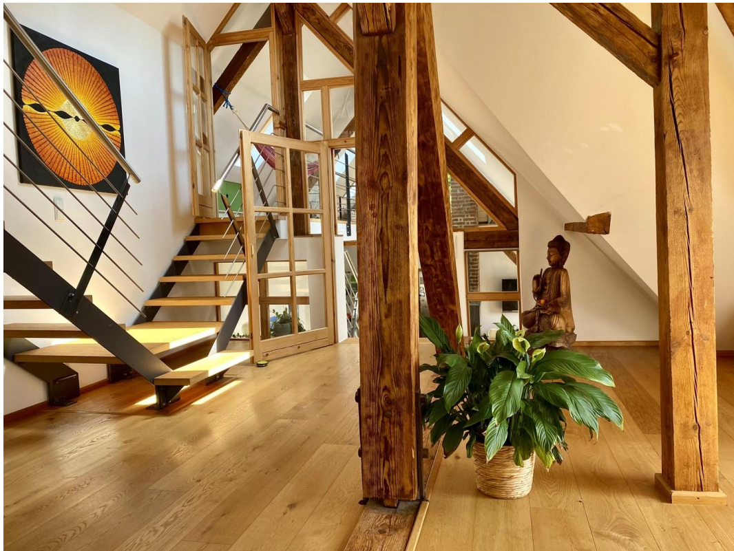
Holz & Raum