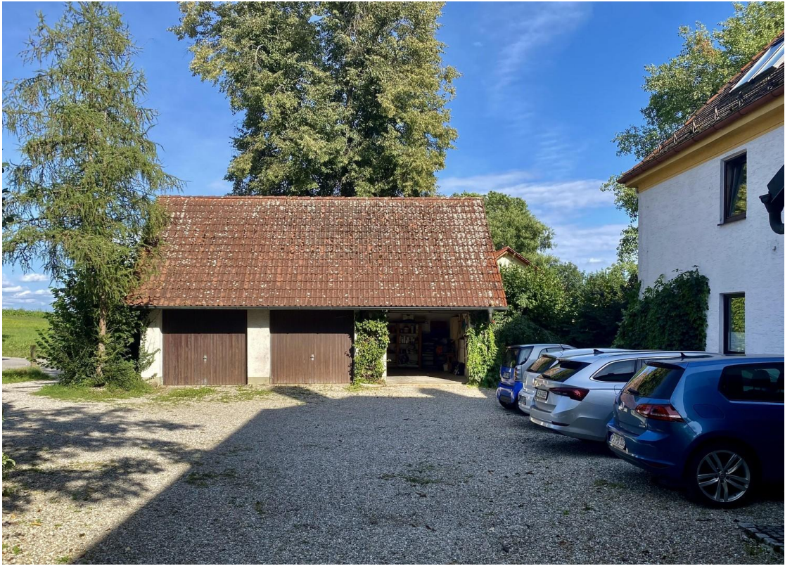
Garagen & Stellplätze