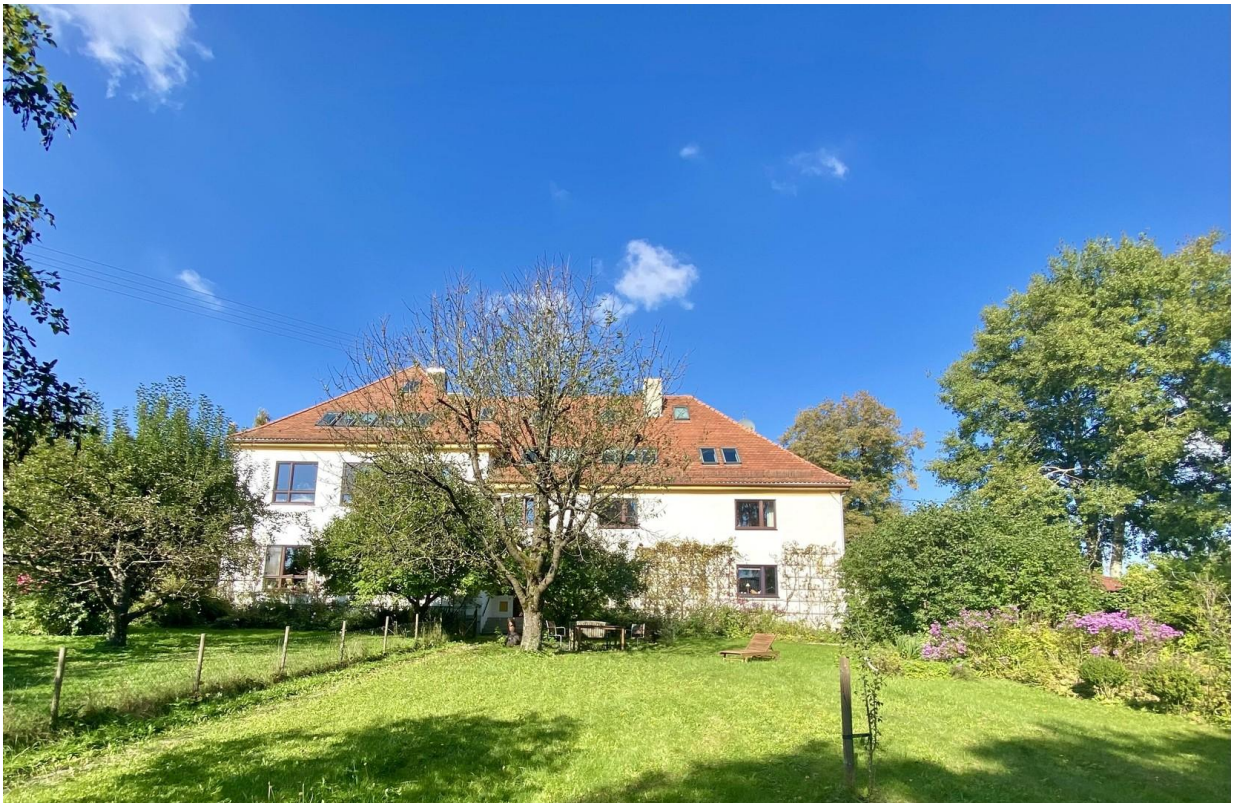
Das ganze Haus