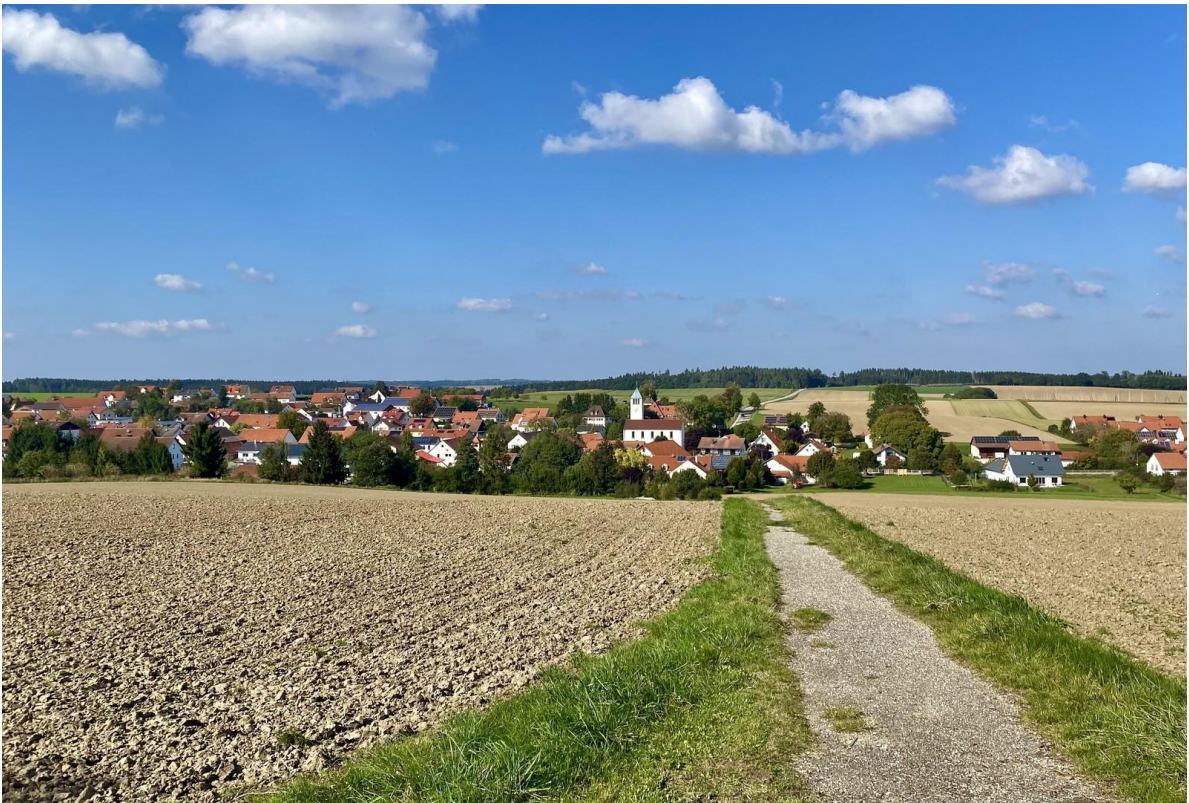
Blick auf Oberappersdorf