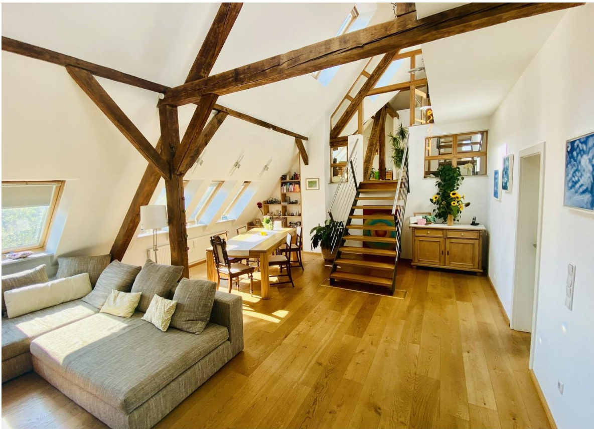
Wohnen, Essen & Austauschen