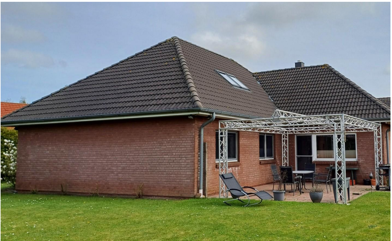
40 m 2 Terrasse