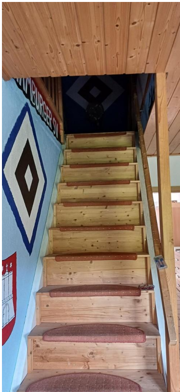
Treppe zum Dachboden