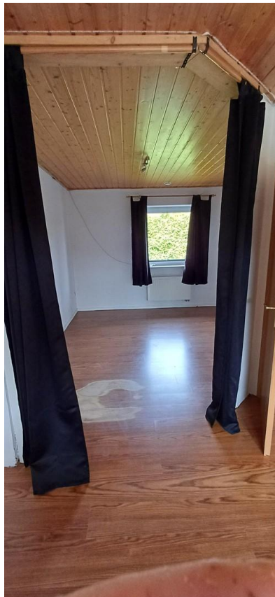
Grosses Kinderzimmer vorher 2