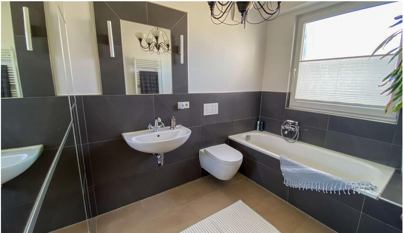
Vollbad mit Badewanne