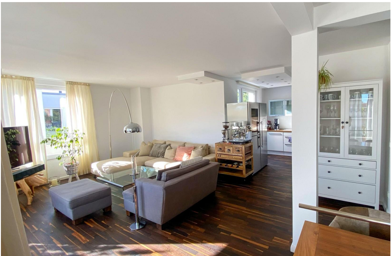
Wohn-/Essbereich und Küche