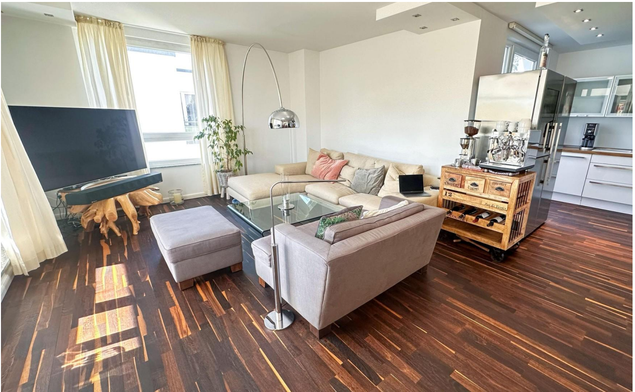
Wohnbereich und Küche