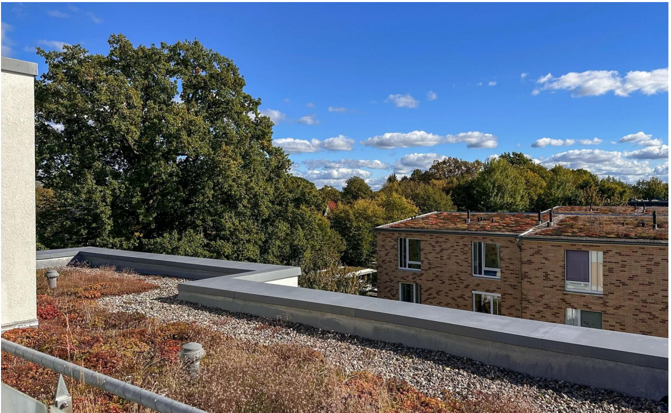
Ausblick ins Grüne