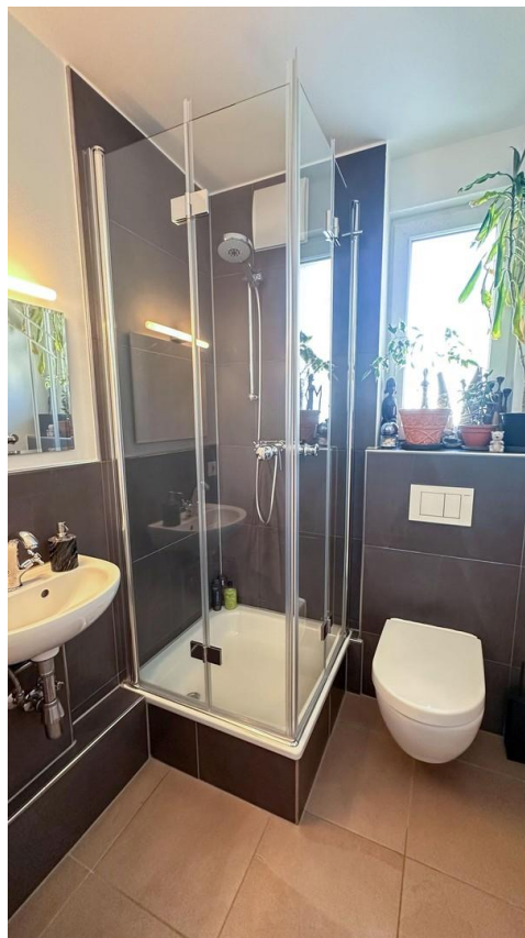
Gästebad mit Dusche