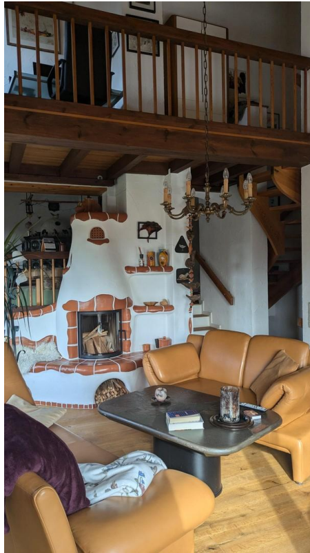
Wohnzimmer mit Kamin