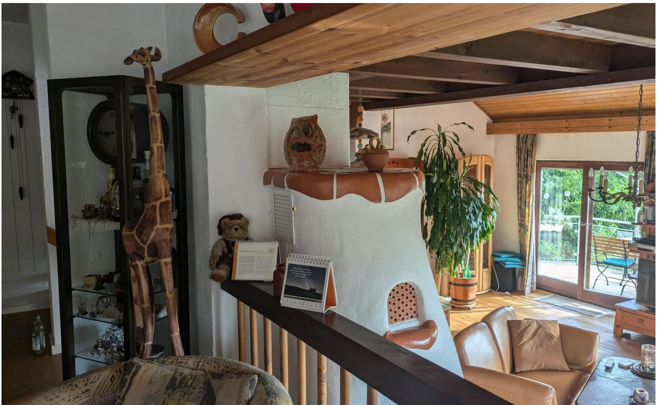
Blick vom Esszimmer auf WZ