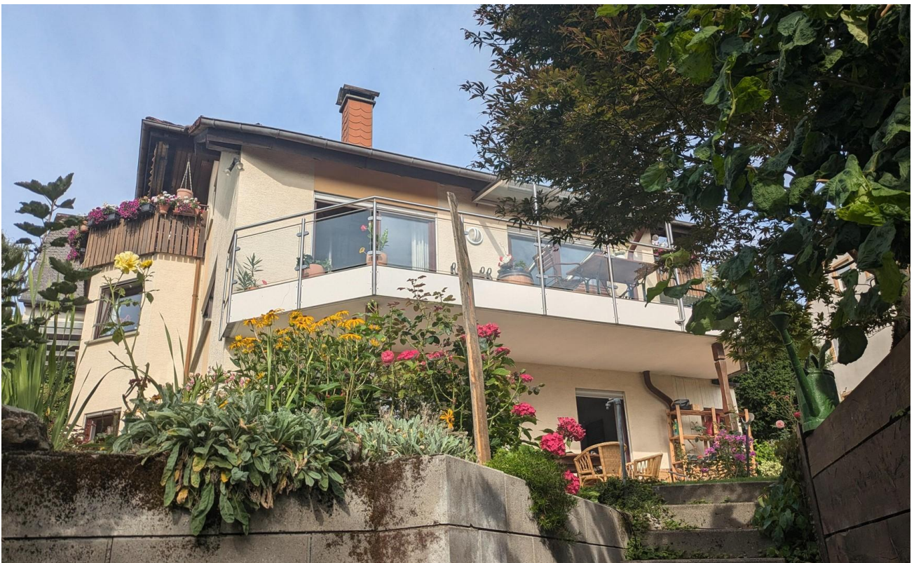
Hausansicht unterer Garten