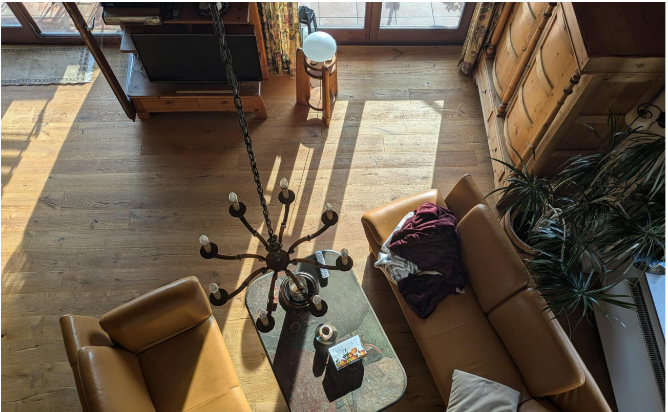
Wohnzimmer von oben