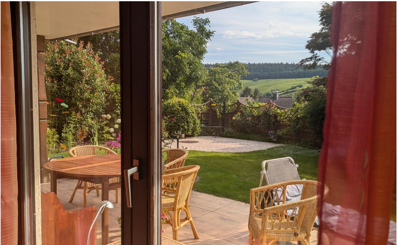
Schlafzimmer mit Terrasse