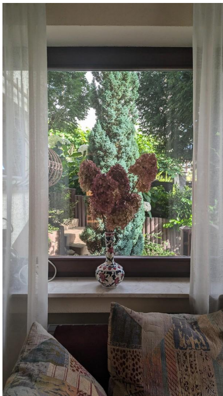
Fenster Schlafzimmer UG