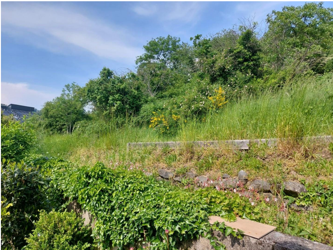
Ausblick hinter dem Haus