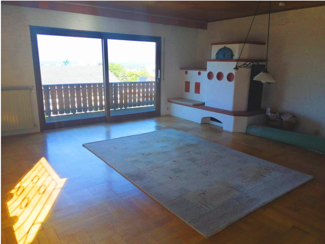
Wohnzimmer + Kamin OG