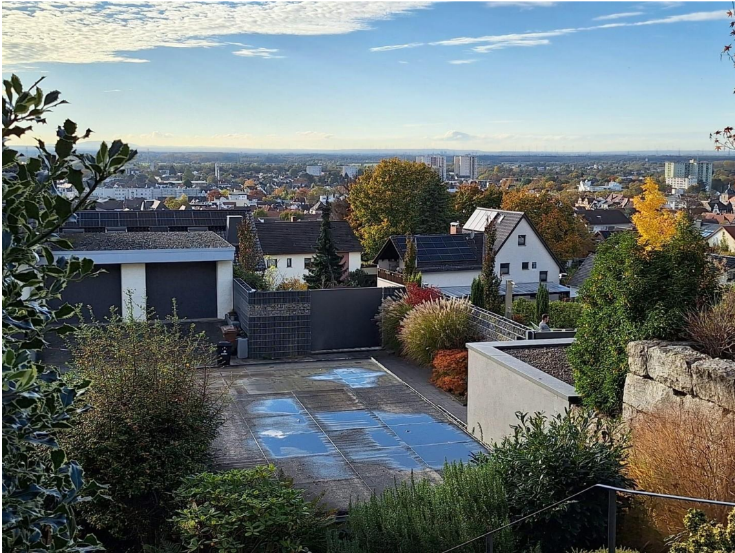
Blick vom hinteren Garten