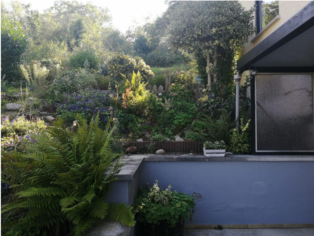
Garten seitlich, Eingang