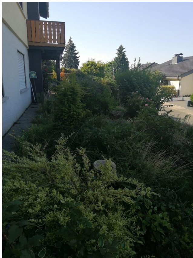
Weg zur Terrasse EG