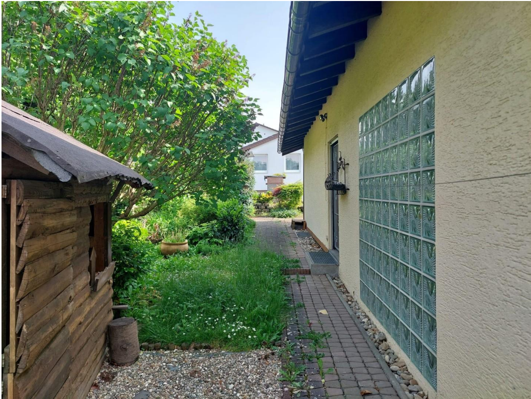
Garten hinter dem Haus