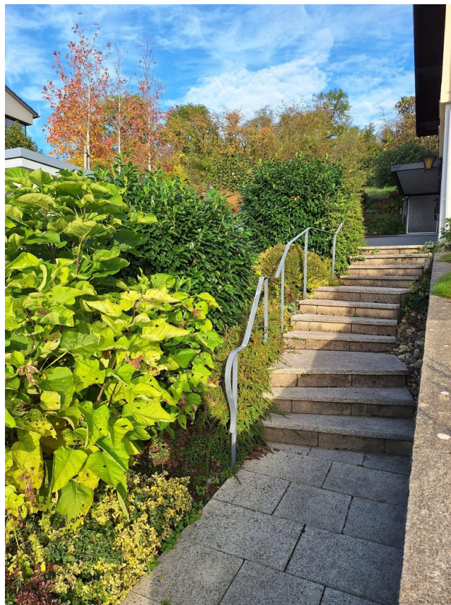
Treppenaufgang zum Haupteingang